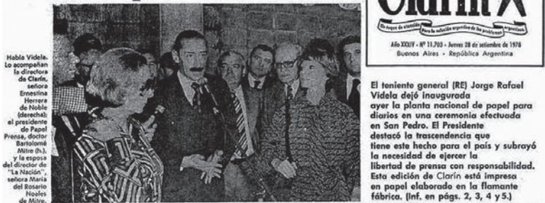
Facsimil del diario Clarín del 28/09/1978

nieron Magnetto, Noble y Mitre era el jefe del centro clandestino de detención y exterminio El Tolueno, en la zona 4 de Campo de Mayo, donde, entre otros crímenes, fueron asesinados los militantes del ERP capturados en el asalto al Batallón 601 Domingo Viejo Bueno, en Monte Chingolo, el 23 de diciembre de 1975.