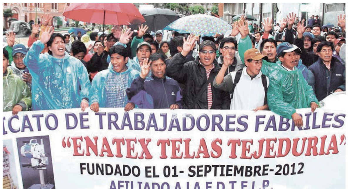
La lucha de los obreros de la textil Enatex contra el cierre fue uno de los grandes conflictos de 2016