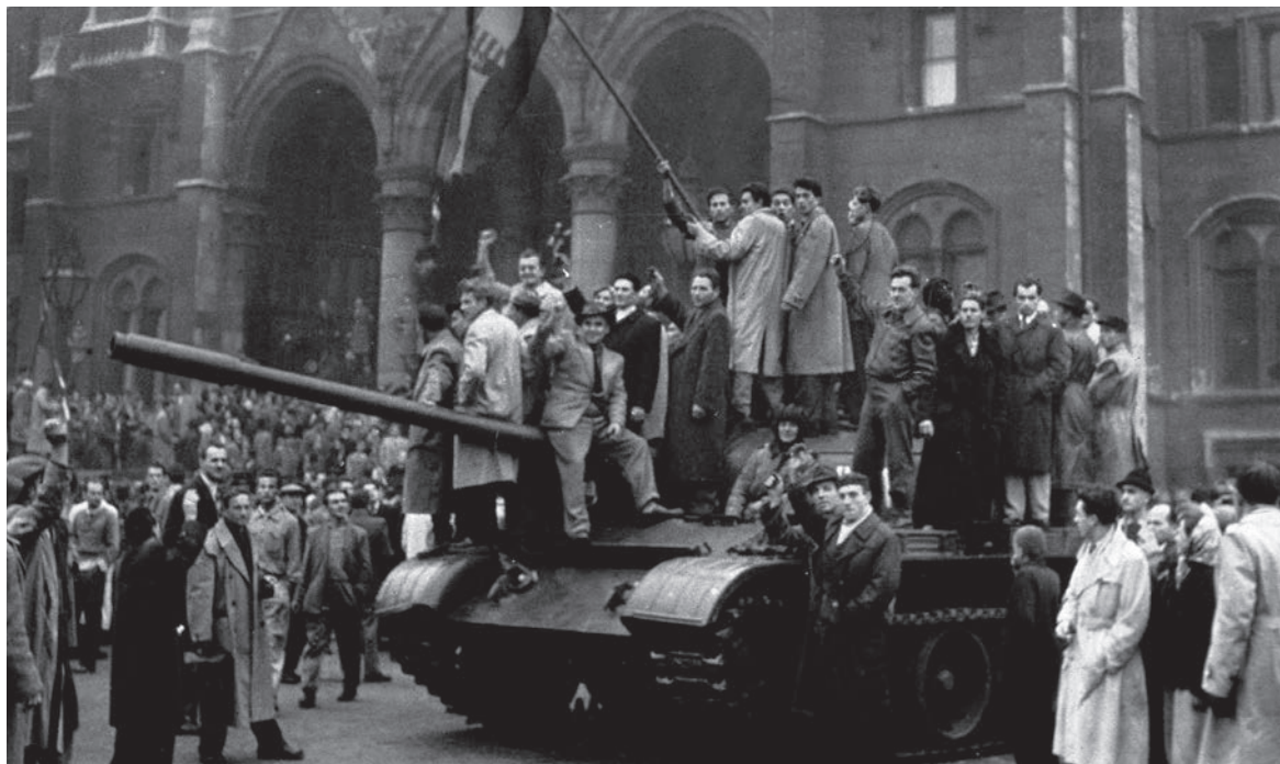
Trabajadores húngaros sobre un tanque ruso