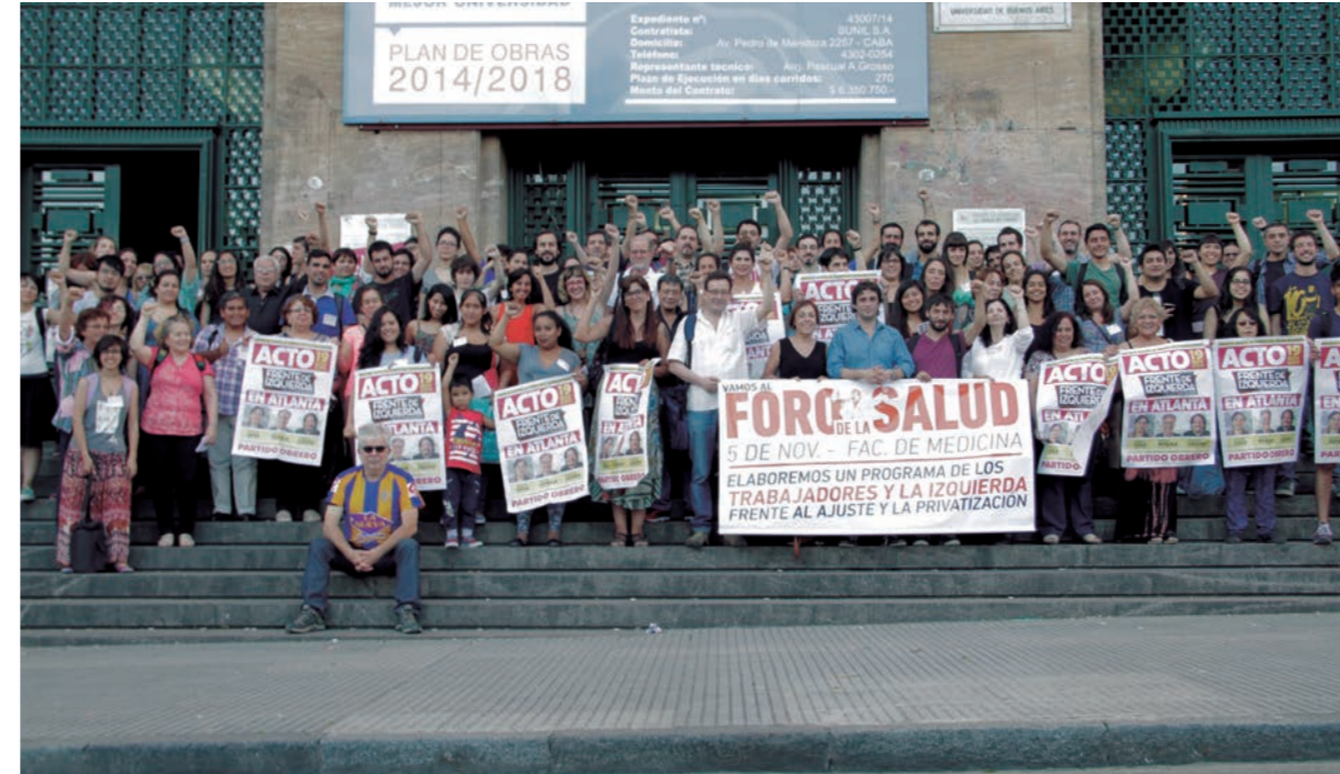
Más de 100 enfermeros, profesionales, médicos y residentes participaron del Foro de Salud desarrollado en la Facultad de Medicina y convocaron al acto del FIT en Atlanta

En el movimiento obrero, el triunfo aplastante de la Lista Negra en las elecciones del Cuerpo de Delegados de Pirelli, con el 70% de los votos, el triunfo del clasismo también en el sindicato de docentes universitarios de Tucumán (Adiunc), y la exitosa lucha de los choferes de La Plata son datos que avizoran tanto un crecimiento del clasismo como así también la posibilidad de propinarle derrotas a las patronales, a pesar de la tregua armada por la burocracia sindical. Un capítulo destacado de esta batalla