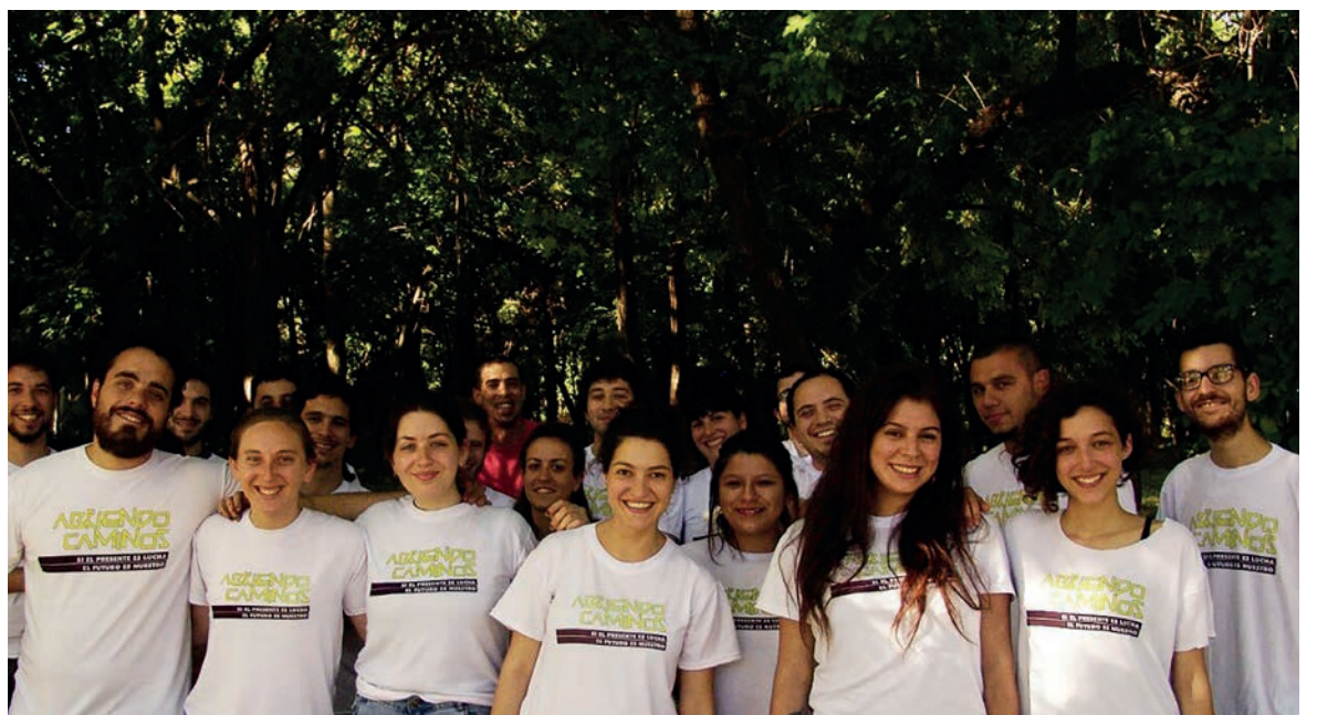
Abriendo Caminos, la lista impulsada por al UJS

Por nuestra parte, alcanzamos un resultado similar al del año pasado. A través de una intensa denuncia de las autoridades pusimos de manifiesto cada uno de los negociados a expensas de estudiantes, docentes e investigadores que existen en la facultad. Los votos que obtuvimos representan un respaldo a la lucha que dimos todo el año por presupuesto, en defensa del ambiente y la ciencia, y por los derechos de las mujeres. Es de destacar, además, que la representación que obtuvimos este año en la comisión de carreras técnicas