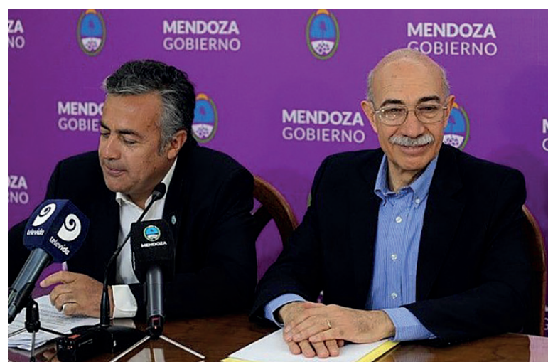
El gobernador Alfredo Cornejo junto al Juez José Valerio

La presidencia del Senado mendocino la ocupa la vicegobernadora, Laura Montero (UCR), una mujer que dice tener "perspectiva de género" y, sin embargo, cerró filas con el gobernador para