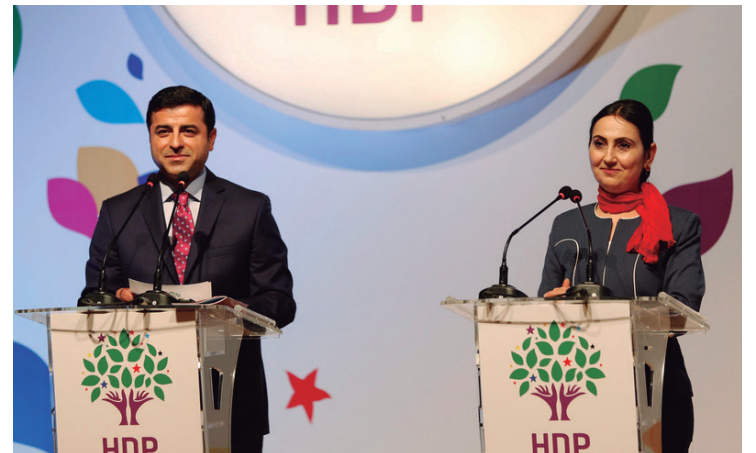
Los copresidentes del Partido Democrático de los Pueblos y otros referentes de la formación fueron detenidos por el régimen de Erdogan