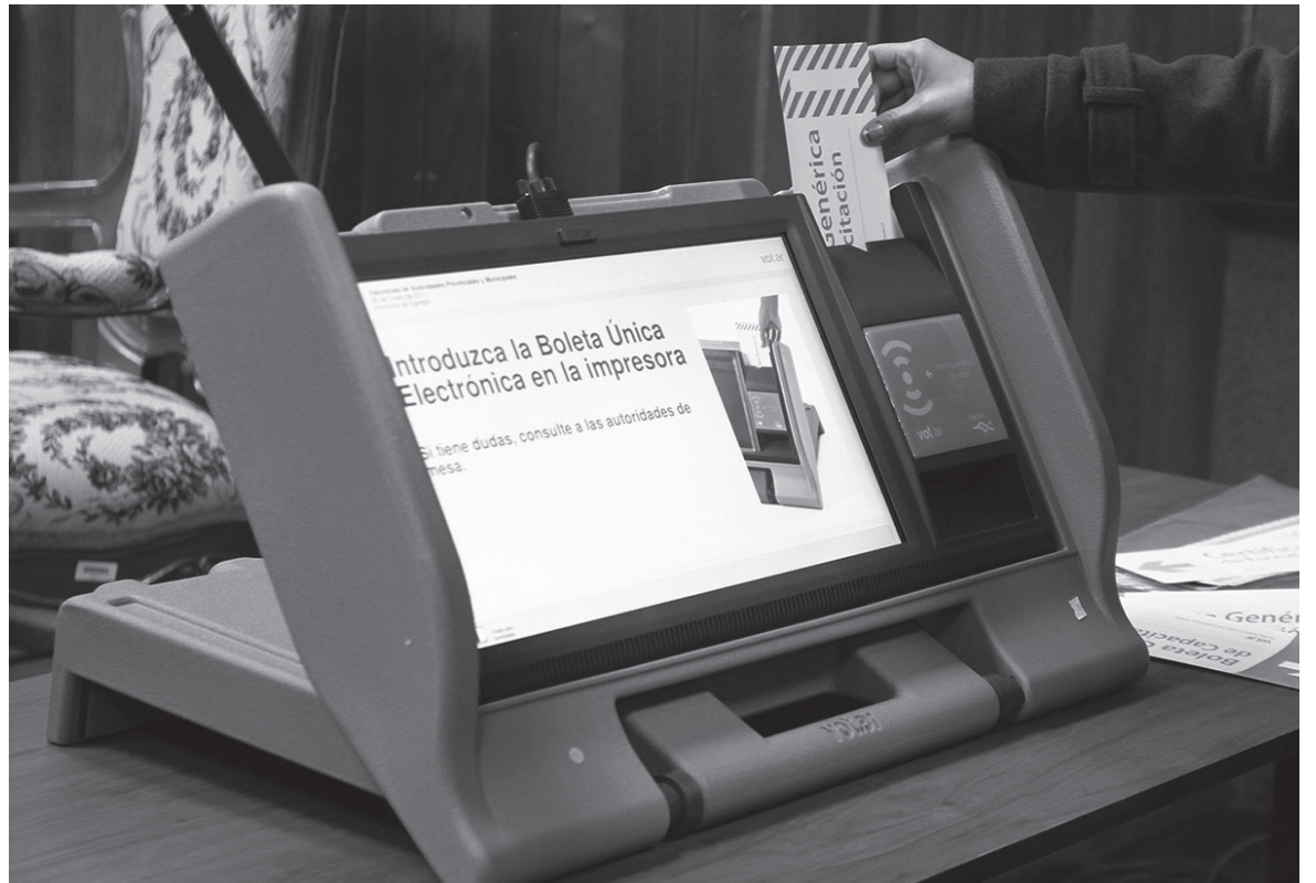
La estrategia macrista busca profundizar la intervención despótica del Estado ante el electorado y los partidos

Para justificar la prohibición de cortar boleta en las PASO el gobierno argumenta que un elector no puede votar en la interna de dos partidos o alianzas. Este argumento sería coherente si la elección interna fuese voluntaria, tanto para los partidos como para los electores. Pero sucede todo lo contrario.