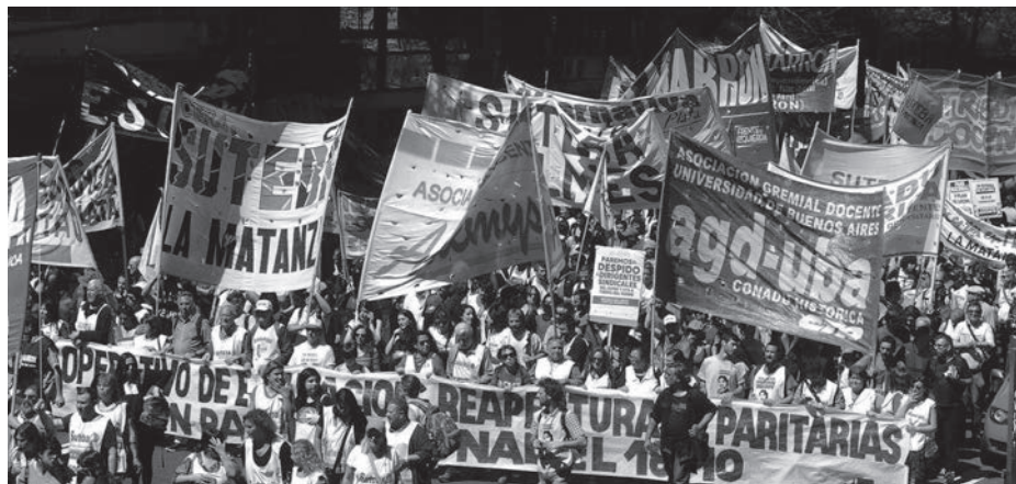
Columna combativa en la marcha docente del 27

cepcional a jubilados y precarizados. En el primer caso, los índices anualizados de la ‘movilidad jubilatoria’ oficial consagrarán una pérdida en los haberes del orden del 15% durante este año. Por su parte, la CGT ha subido al carro de la tregua a un conjunto de movimientos sociales, sin que ello signifique que dejen de percibir planes sociales que están por debajo del salario mínimo.