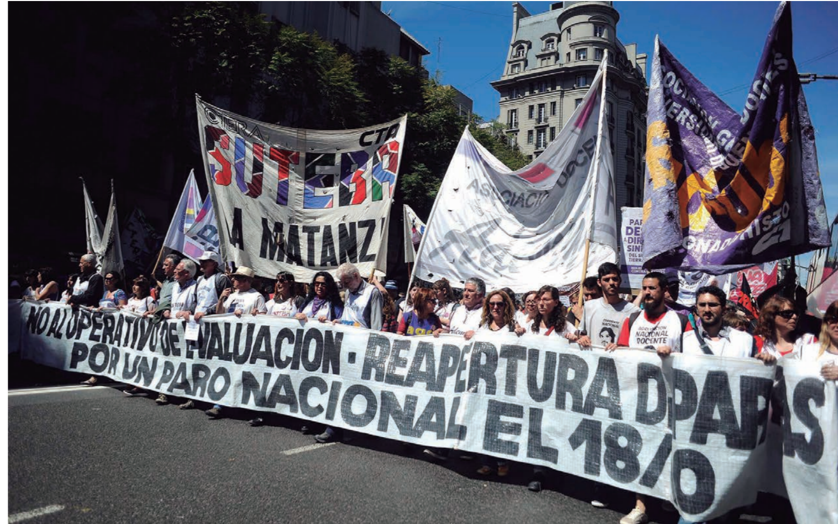
El sindicalismo combativo participó de las dos movilizaciones de la jornada

de ATE luego de carnear a la Marcha Federal, fue tomado en sus manos por la docencia combativa de la AGD-UBA y la Conadu Histórica, los Suteba multicolores, Ademys y Amsafe-Rosario, lo que obligó a la dirección celeste de Ctera a declarar también la huelga, en un plenario de secretarios generales clandestino. Los sectores docentes y estatales pararon y se movilizaron por la reapertura de las paritarias, la reincorporación de los estatales despedidos y por el pase a planta permanente de los precarizados, por la defensa de la jubilación y la eliminación del impuesto al salario, contra el operativo anti-educativo y privatizador planteado por la