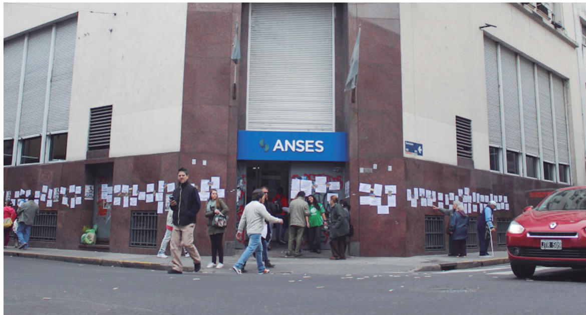
Liquidación de las acciones. Un capítulo de la destrucción de las jubilaciones

La orden de largada del remate de las acciones del FGS de la ANSES revela, por otro lado, las urgencias financieras del gobierno frente a la anunciada y fallida "lluvia de inversiones". Pero la ur-