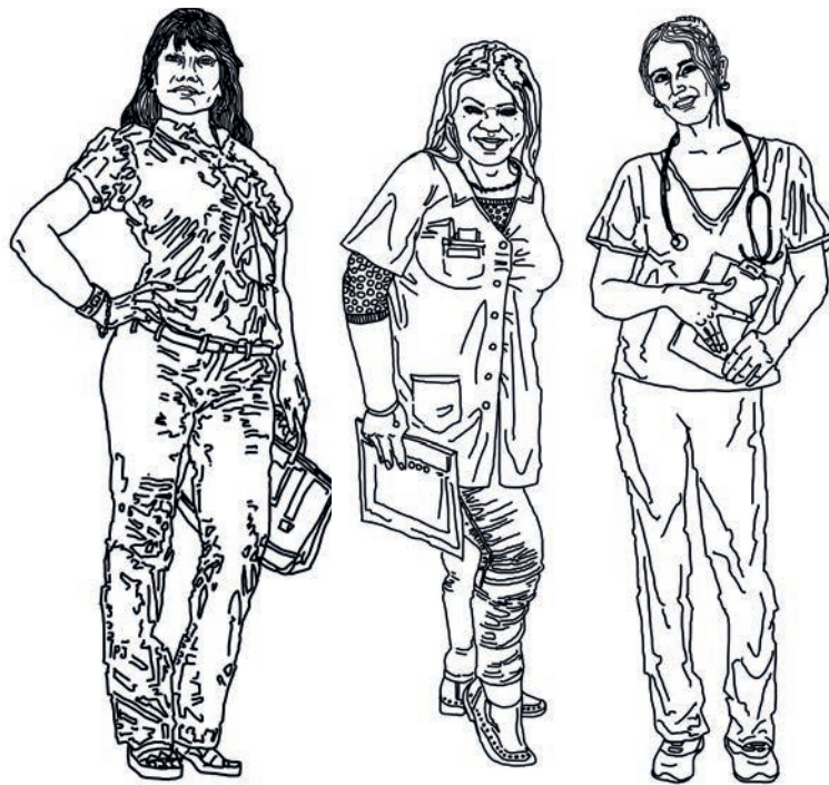
Ilustración Olga Suarez

Lanata se ha escandalizado por este planteo de inclusión laboral. Pero, en cambio, no le escuchamos decir una palabra sobre la degradante condición a la que es sometida la abrumadora mayoría de las trans y travestis, empujadas al comercio sexual para poder sobrevivir. Un relevamiento ubica en un 85% a las trans y travestis en estado de prostitución; al ser indagadas, la casi totalidad de las mismas declaró que, de contar con posibilidades laborales, abandonaría la calle. El conductor de PPT despachó en segundos la cuestión de las personas trans, sin detenerse, por ejemplo, en que la expectativa de vida del colectivo trans-travesti en