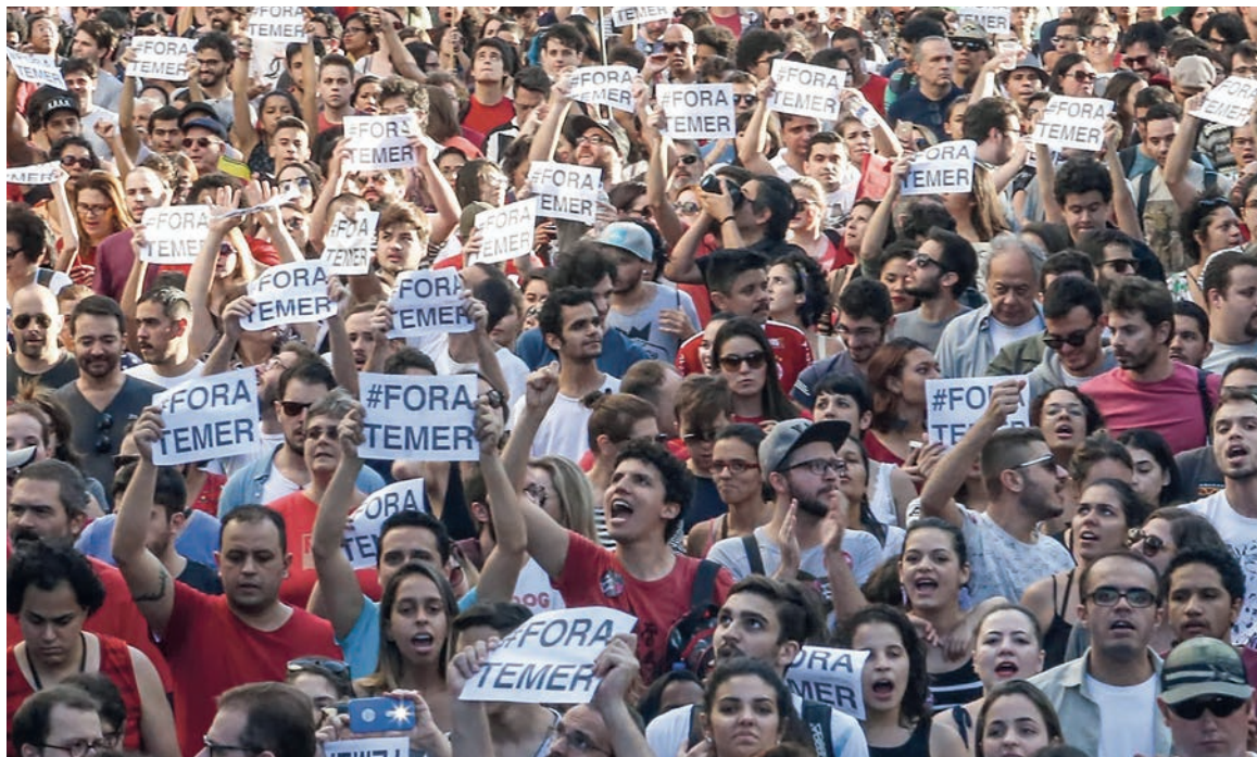
"Fora Temer" puede ser el leit motiv de la unificación del conjunto de las luchas en curso.

El presidente golpista Michel Temer habló en la ceremonia de apertura de los Juegos Olímpicos de Río de Janeiro. Fueron menos de diez segundos, sin aviso previo, suficientes para una fuerte silbatina del público que enseguida se convirtió en estremecedora. El régimen político supuestamente responsable por sacar al país de su peor crisis no puede mostrar a su presidente en público.