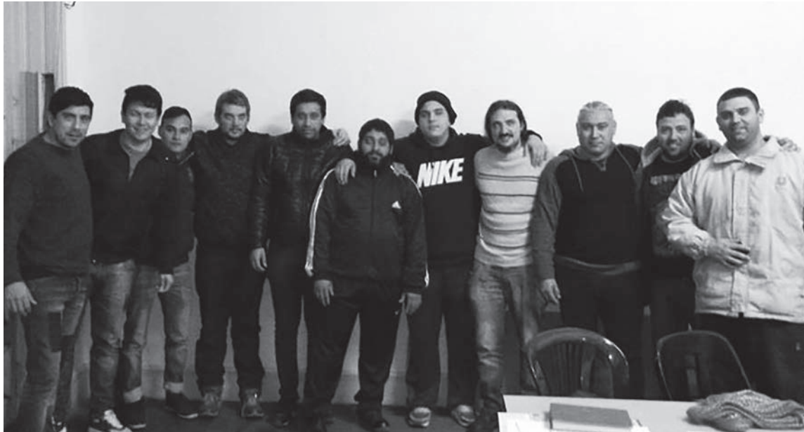
Compañeros de la lista Naranja de la alimentación

cierres, ajuste y atrasos salariales se generaliza por todo el gremio, y la respuesta de la Verde es siempre adaptarse a los planes patronales.