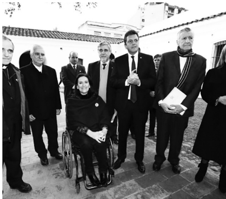
En la foto, entre otros: Gabriela Michetti, Sergio Massa, Jose Luis Gioja

No quieren sacar a luz que Argentina fue parida por estos le-