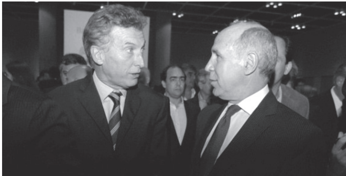
Mauricio Macri junto a Ricardo Lorenzetti, presidente de la Corte Suprema de Justicia