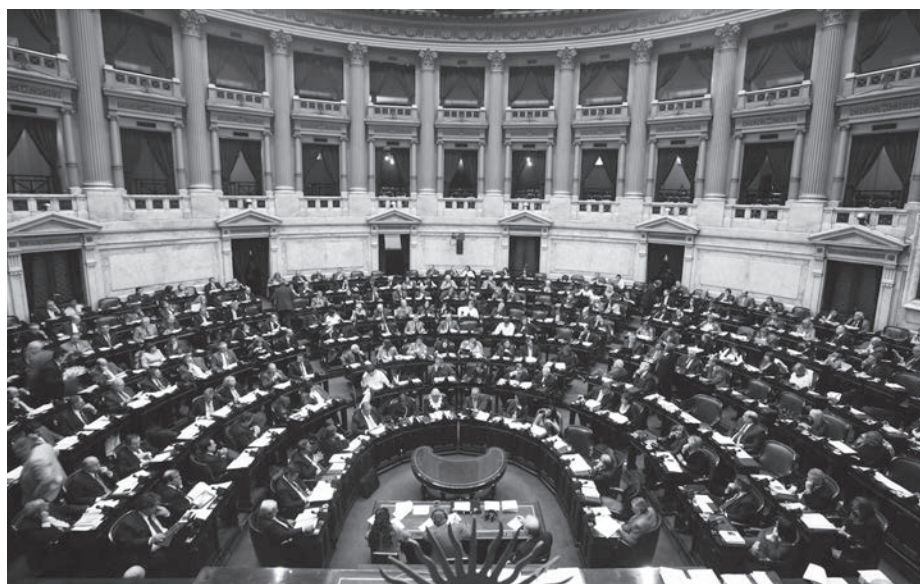
El Congreso que convalidó el pacto con los buitres no será quien pare los despidos y suspensiones

El Frente para la Victoria y el kirchnerismo participaron conscientemente en esta farsa. Primero decidieron dejar de lado el de por sí estrecho proyecto presentado en Diputados, para hacer suya una versión limitadísima votada en el Senado, que excluye la retroactividad, reduce el alcance de la prohibición a seis meses y mantiene los "recursos preventivos de crisis", por los cuales los capitalistas le transfieren a los trabajadores los costos de las bancarrotas económicas. Pero, luego, el propio bloque del PJ-FpV del Senado se desentendió de este proyecto. Sus mandantes, los gobernadores, hicieron un gesto claro: el mismo día que debía tratarse la ley en Diputados se reunieron con el gobierno nacional en Córdoba para firmar un acuerdo de distribución de la coparticipación federal, que tiene