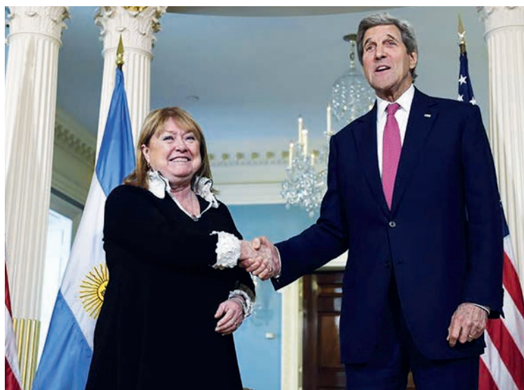
La canciller argentina Susana Malcorra y John Kerry

A la vez, un acuerdo llevaría a anular las disposiciones votadas por el Congreso, que prohíben a las empresas petroleras que realizan exploraciones petroleras en Malvinas o en aguas adyacentes realizar también inversiones en el continente. Este tipo de disposición, aunque puede ser violada por los monopolios mediante diferentes tipos