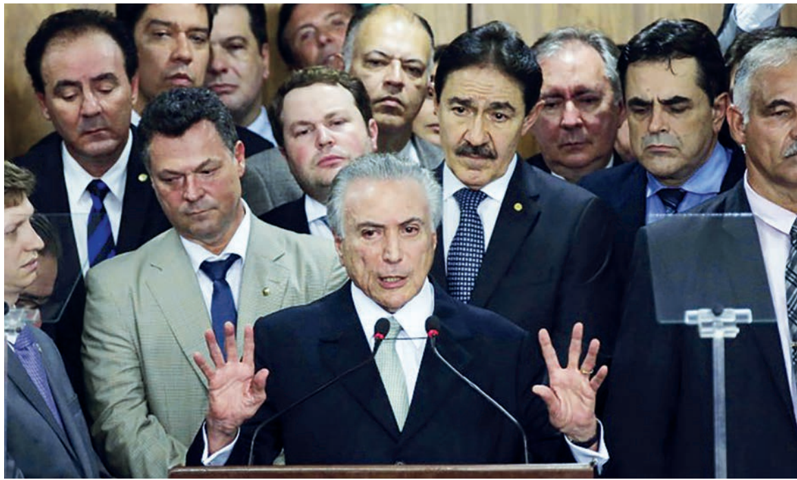
Michel Temer, del PMDB, asumió la presidencia de Brasil

Si bien Temer dijo que no temía ser "impopular" y tomar las medidas que hicieran falta, evitó en el arranque "los temas económicos más espinosos, como la reforma de las jubilaciones o la alteración del sistema de indexación de los salarios" ( La Nación , 17/5). Tampoco hubo una referencia clara a los planes sociales. La vaguedad de los anuncios acerca del ajuste se reflejó en la reacción de los "mercados". La caída de la bolsa con que se recibió la primera jornada de gobierno de Temer es una señal de desaprobación de la clase capitalista. Los círculos empresarios le acaban de bajar el pulgar a la tentativa del nuevo ministro de Hacienda de imponer un nuevo impuesto. Se trata de la Contribución Provisoria al Movimiento Financiero (CPMF), "pública-