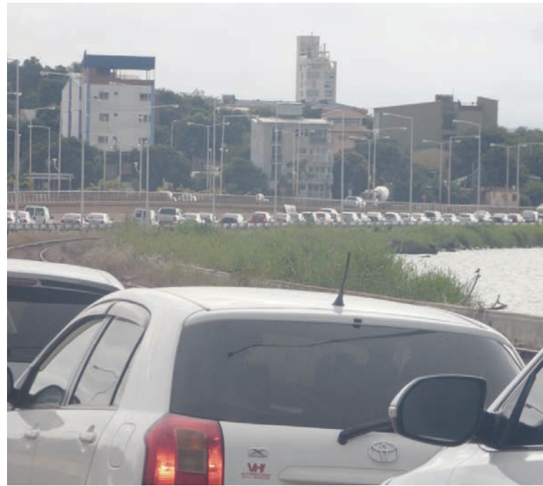
Fila de autos argentinos cruzan la frontera para cargar combustible en Paraguay

En este cuadro, una fracción del gabinete -y de la propia burguesía- plantea salir de la deuda explosiva del Central en base a un ajuste fiscal de características brutales. Aunque el gobierno paralizó por completo a la obra pública y despidió a trabajadores precarizados, sufre por otro lado una caída de los ingresos del fisco, como resultado de la baja de las retenciones y otros beneficios a los grupos capitalistas. Sólo para cubrir el déficit fiscal, el gobierno prevé una emisión de deuda de 37.000 millones de dólares. Nuevamente, y como en los años del kirchnerismo, un aportante compulsivo a este financiamiento será la Anses, pero percibiendo la mitad del rendimiento que obtendrán los bancos que financiaron el pago a los fondos buitres. El fisco también quiere financiarse con parte de los ahorros que se encuentran en el “colchón”, que se ha reforzado bajo su mandato: 3.700 millones de dólares fueron atesorados en el primer trimestre, y después de que el gobierno se endeudara en 5.000 millones para reforzar las reservas del Central! El derrumbe del crédito