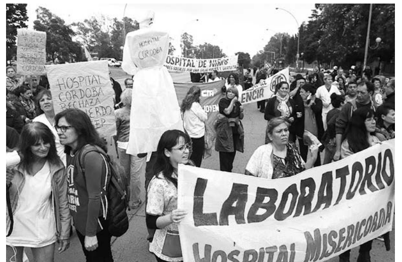
Trabajadores de la salud de Córdoba, seis semanas de lucha