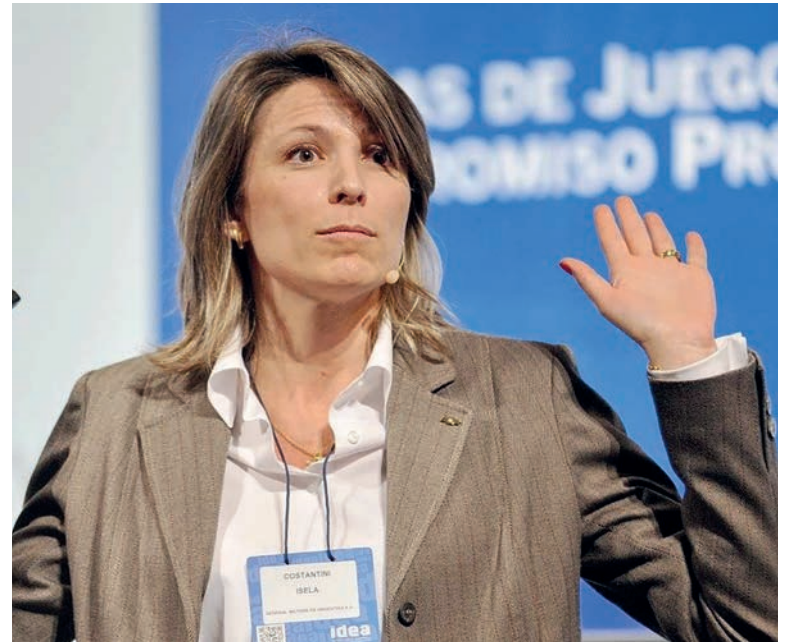
Isela Costantini, presidenta de Aerolíneas Argentinas

La burocracia de la Federación Argentina del Personal Aeronáutico (Fapa), que agrupa a los