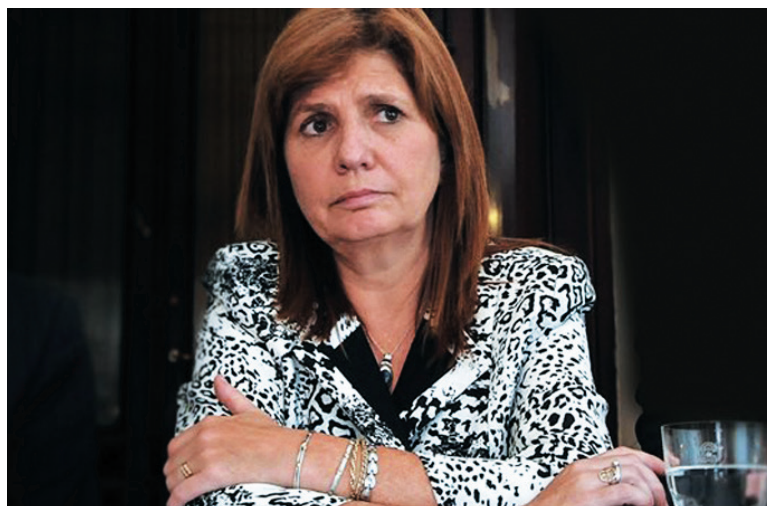
Un calco de las acusaciones clásicas de Aníbal Fernández y Feinmann se hizo trizas en pocas horas.

El Partido Obrero presentó una denuncia penal por calumnias e injurias a las 11 del 23 de diciembre. A las 16 horas, el ministerio levanta-