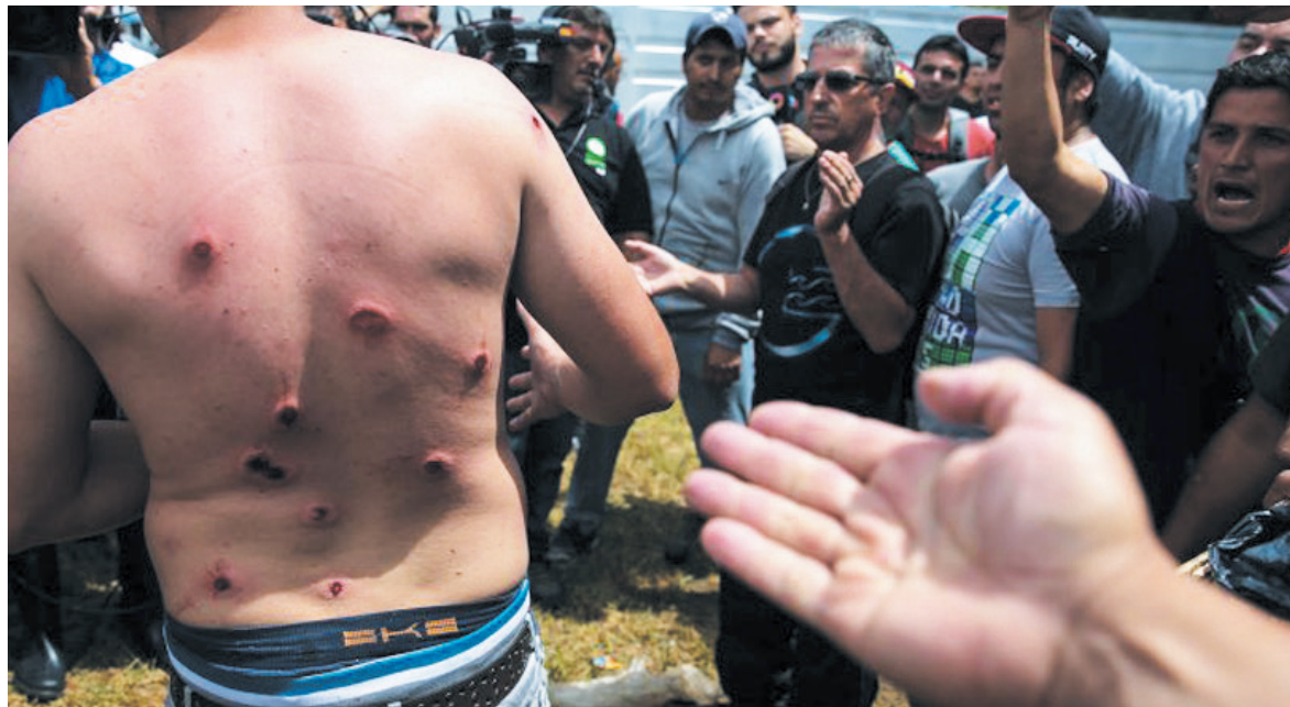
El gobierno se ha autoasignado superpoderes para una militarización de la vida social.

En la misma línea, se inscribe el anunciado "protocolo