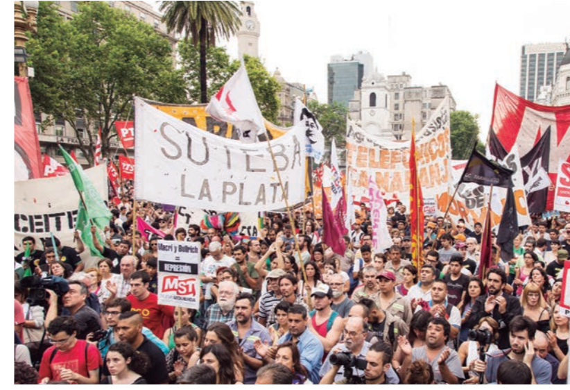
Miles de trabajadores se movilizaron a Plaza de Mayo convocados por el sindicalismo clasista y la izquierda.

Un punto a resaltar de esta confluencia sindical combativa fue la vasta participación de sectores de ATE, que saltaron por encima de la defeción de la dirección del sindicato, que a la postre llevó a la defeción de