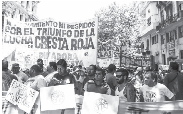
Los trabajadores de Cresta Roja marchan a la Plaza de Mayo con el clasismo y la izquierda.