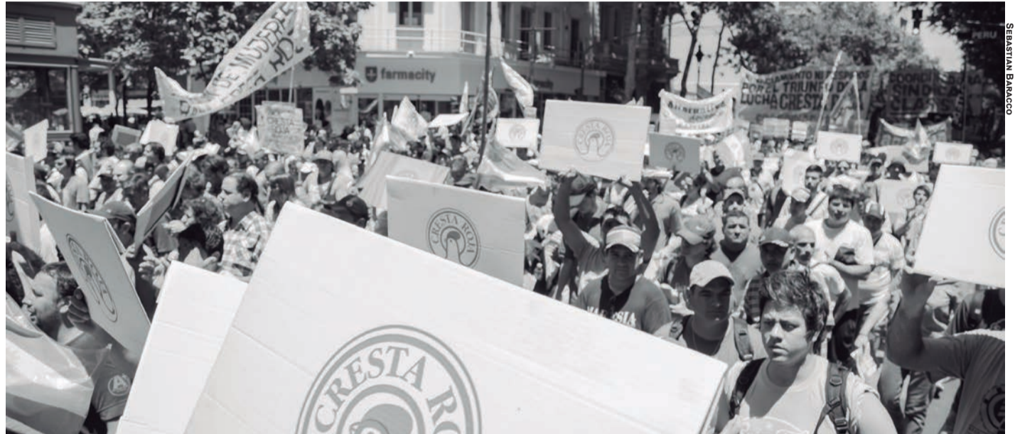
El primer episodio de la "emergencia en seguridad" no fue contra el delito organizado sino contra los trabajadores de la avícola.

tregada a los trabajadores como paliativo, por un lado, y el anuncio de la quiebra, por el otro, buscaron descomprimir el conflicto sin que el gobierno renunciara ni por un momento a una salida antiobrera. Entre los principales acreedores de la quiebra, figuran la Afip, Rentas de Buenos Aires y varios bancos estatales. En esas circunstancias, la ejecución de estas deudas impondría la expropiación de la planta por parte del Estado y su funcionamiento con todos los trabajadores adentro. En cambio, los "cráneos" oficiales que pergeñan la venta a un grupo privado no sólo quieren hacerlo contra el derecho al trabajo de la mitad de los obreros, sino planteando, además, que "la deuda con los organismos del Estado y bancos debería ser refinanciable a muy largo plazo para (...) que la firma sea viable" ( La Nación , 24/12). O sea que después del subsidio del Estado K a los vaciadores de Rasic, vendría el subsidio del Estado PRO a sus eventuales compradores (la licuación de la deuda con el Estado). Como se ve, la "austeridad fiscal" que pregonó el gobierno sólo vale para los trabajadores o los gastos sociales, nunca para los capitalistas.