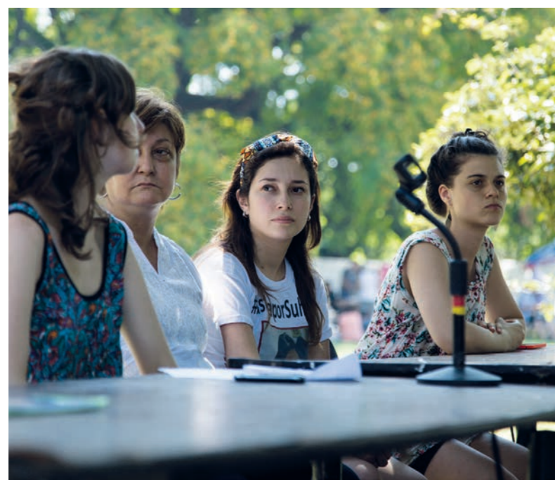
Femicidio, trata: dos aspectos que recorrieron el debate.

La lucha por el desmantelamiento de las redes de explotación sexual y laboral exige una lucha política contra el Estado capitalista, sin cuya connivencia es imposible que las mismas operen. En este punto, no podemos esperar un cambio por parte