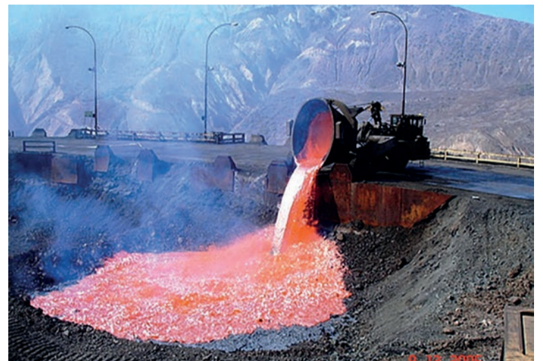
El cobre chileno, en el precio más bajo en casi una década

La reforma laboral reaccionaria que impulsa Bachelet forma parte de un intento de ajustar las clavijas contra el movimiento obrero ante la agudización de la crisis, que no da respiro a los gobiernos latinoamericanos. Como el petróleo venezolano o la soja argentina, el cobre chi-