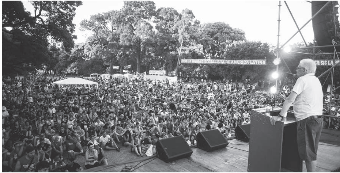
Altamira denunció que el gobierno comienza su mandato a espaldas del Congreso, para actuar por decreto, tomando los instrumentos políticos que les criticaba a los K