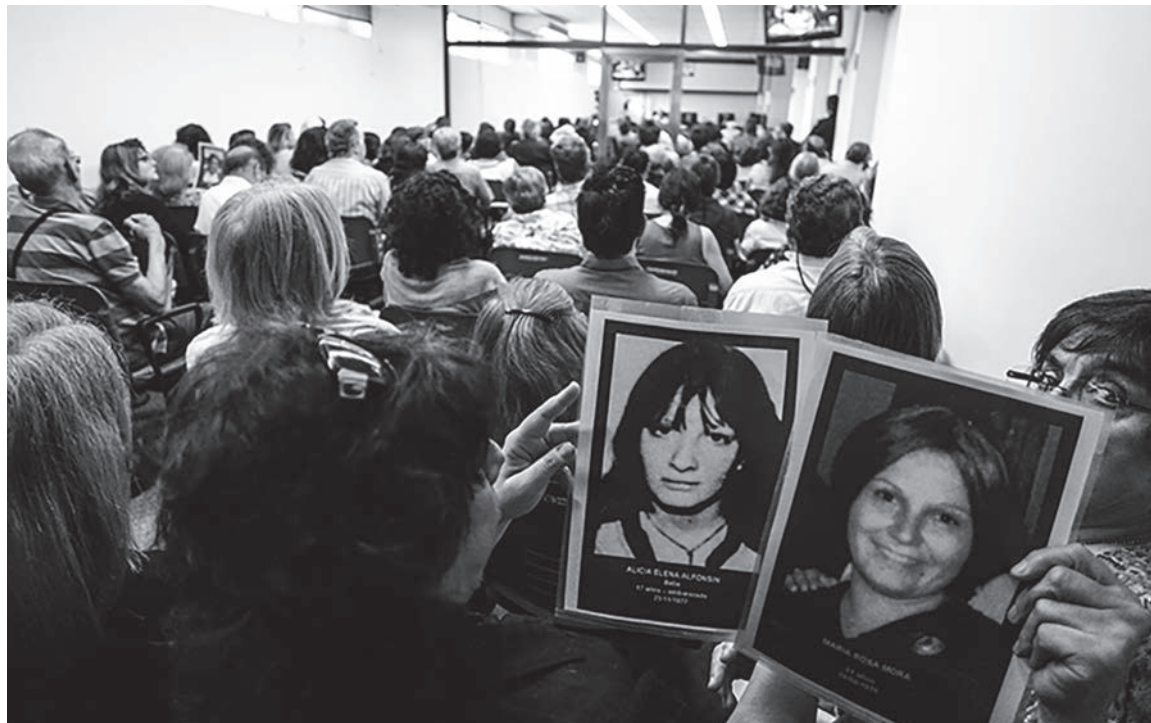
La querrela de Justicia Ya!, representada por Apel, acusará por genocidio.

Durante febrero será el turno de la querrela de Justicia Ya!, representada por Apel,