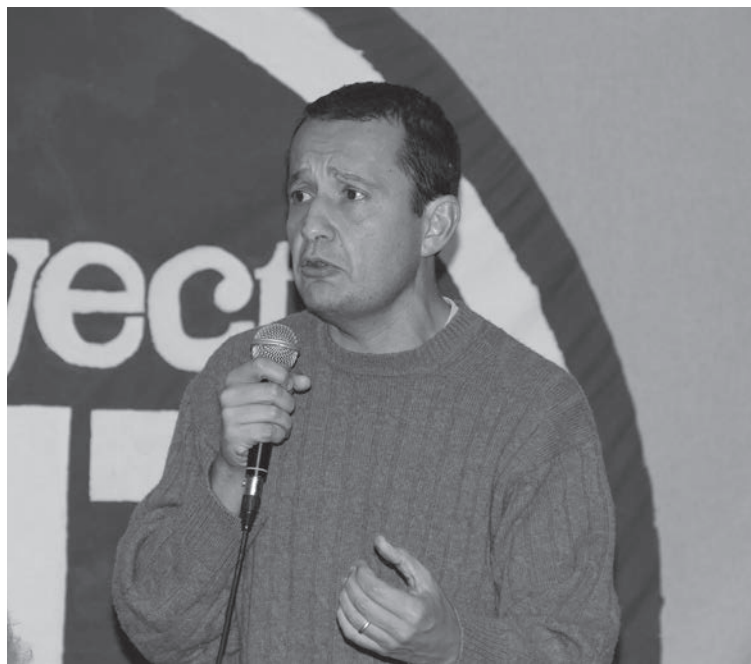
Del Frade llamó a votar por Scioli sin miramientos.

En su discurso frente a los autores de la Campaña #NoMacriNo, lanzó: "Los intereses que representa Scioli son los intereses de esos sectores trabajadores" y "el peronismo sigue vivo...". No se privó de elogiar la Asignación Universal por Hijo, la "integración"