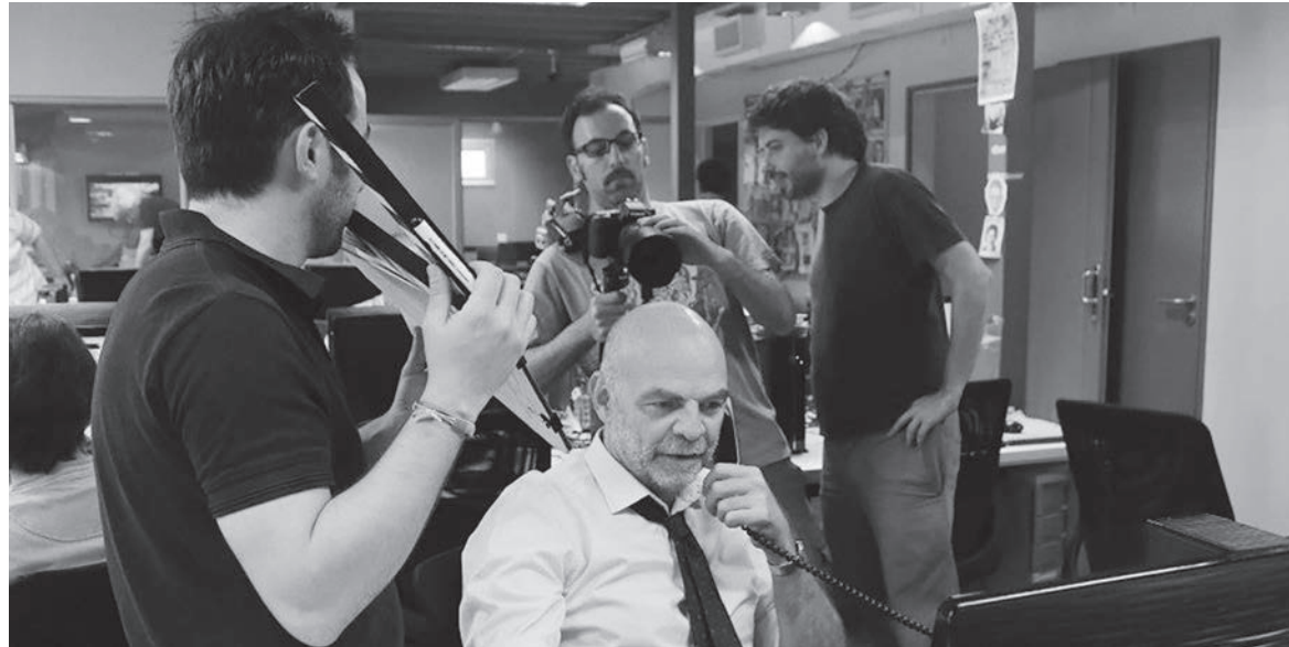
¿Quién mató a Mariano Ferreyra?, una de las películas que fue posible tras la lucha de los documentalistas.

A partir de aquel año, la producción de documentales representa la mitad del cine realizado en el país. La conformación de jurados no designados por la gestión del