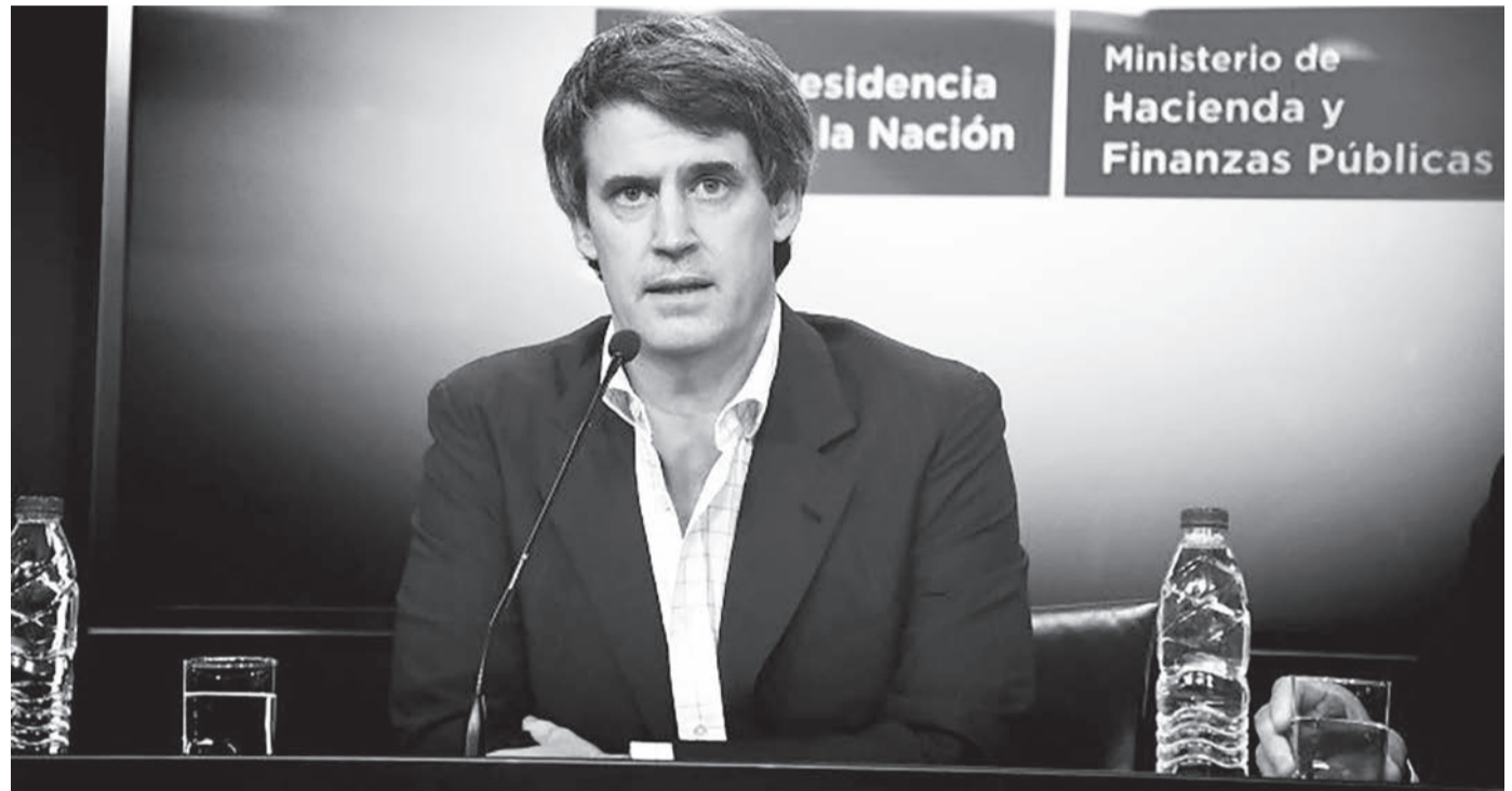
El ministro de Hacienda Alfonso Prat Gay anunciando la devaluación

En medio del revuelo de propios y ajenos, Macri reculó parcialmente (postergó para febrero la asunción de los nuevos jueces). Esta módica echa de lastre le ha servido para hacer pasar el resto de los decretazos que marcaron el debut del nuevo gobierno. En la lista de "necesidad y urgencia" están la reducción y eliminación de las retenciones, la 'emergencia eléctrica' y los arreglos de deuda que se apresta a cerrar en las próximas