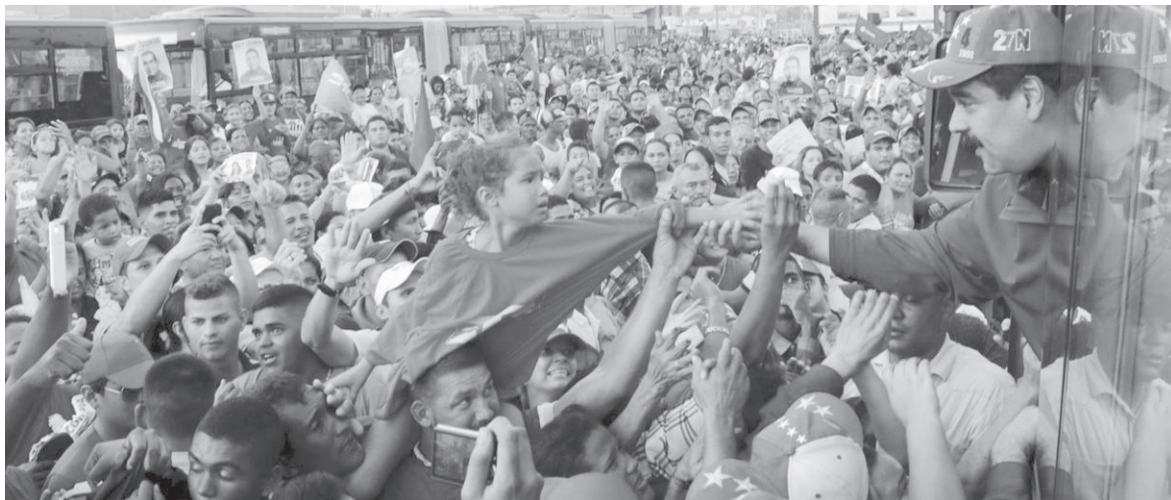
Nicolás Maduro en una movilización electoral. Rechazamos esta injerencia, que Macri impulsa a cuenta del imperialismo, sin que ello implique de nuestra parte el menor apoyo al régimen chavista.

En cualquier caso, queda claro que el ingreso de Venezuela al Mercosur, que no aportó nada en términos de una integración económica soberana de los pueblos, sí ha servido para darle a las burguesías latinoamericanas, vinculadas con el imperialismo por mil lazos, un medio para intervenir en la política interna de