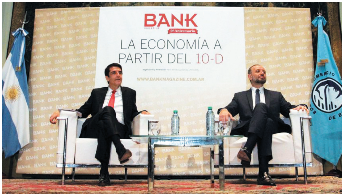
Melconian y Marangoni

Entre tanto, el dólar "a futuro" ha facilitado aún más la dolarización, al tiempo que acentúa las presiones devaluatorias. A la par de ello, se generaliza el debate sobre el levantamiento del cepo y el alcance de la devaluación. En el campo oficialista, existen vacilaciones en esta materia. Roberto Frenkel, economista ligado al gobierno, "opina que la economía no está en condiciones de dejar flotar el tipo de cambio" y advierte "sobre un rebrote inflacionario". El economista calcula un inflación del 6% en el primer mes después de una devaluación del 40%. La clave "estará en los salarios", apunta Frenkel. En otras palabras, hay que mantener a raya los reclamos salariales.