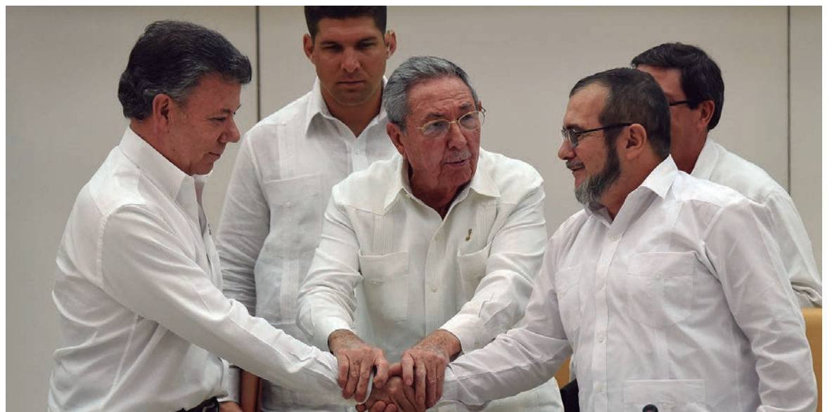
El presidente colombiano Juan Manuel Santos y el comandante de las Farc Timochenko, junto a Raúl Castro

El gobierno de Santos ha deglutido a buena parte de la centroizquierda y la izquierda, que lo votó en la segunda vuelta de las últimas elecciones presidenciales contra el candidato de Uribe. Santos es el responsable de la actual militarización colombiana y fue ministro de defensa del gobierno criminal de Uribe. Entre los que se pronunciaron en apoyo de Santos, figuran los dos grandes derrotados del progresismo en estas elecciones: Clara López, que fue la última candidata presidencial del Polo Democrático, y Gustavo Petro, el alcalde saliente de Bogotá,