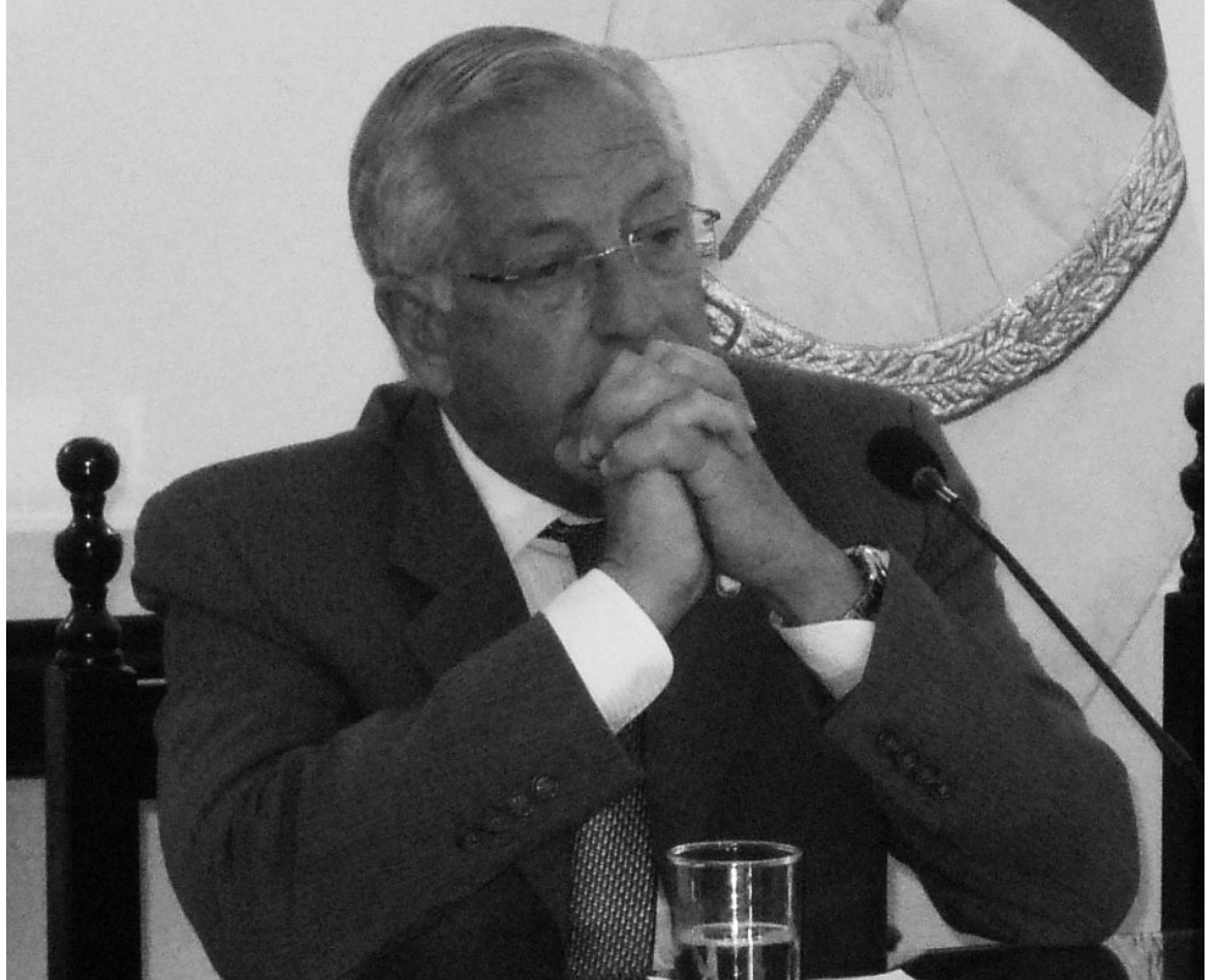
El gobernador saliente Eduardo Fellner. La derrota kirchnerista por mayor diferencia en el país.

Casi todos los sindicatos han tomado partido por una variante capitalista en estas elecciones. Dentro del histórico Frente de Gremios Estatales, los sindicatos de Cedems (docentes de media) y ATSA se han manifestado a favor del FpV, incluso intentaron meter candidatos en la lista. El Seom, el otro sindicato de envergadura del Frente, no tomó una posición pública. La intersindical de los trabajadores (ATE, Adep -docentes de primaria-, Sijempro, etc.) jugaron abiertamente a favor de las