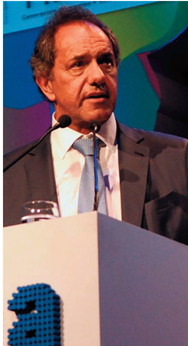
Scioli y Macri en el Coloquio de Idea

Esta catarata de concesiones anunciadas en vísperas de las elecciones no ha sido suficiente, sin embargo, para seducir a las patronales del campo y a la clase capitalista. El macrismo, por ejemplo, arrasó en los distritos agrarios de la provincia de Buenos Aires, duplicando la votación que cosechó el oficialismo.