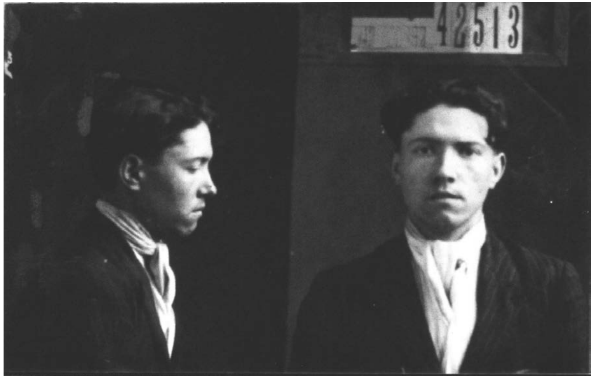
Joaquín Penina, primer fusilado en la historia del movimiento obrero, ante el silencio de la naciente CGT.