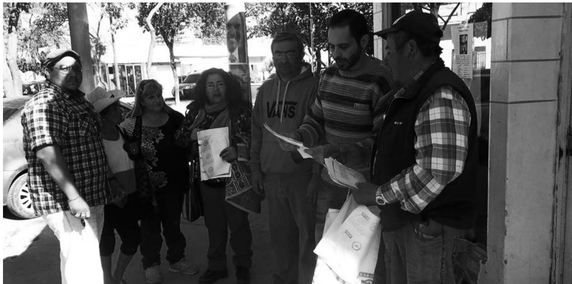
El PO en campaña

A diferencia de lo que había sido el panorama previo de 2015, los últimos días de la campaña electoral mostraron un interesante panorama de luchas: obreros de la empresa Panedile (constructora ligada a De Vido, una de las principales beneficiarias de las obras públicas locales) corta-