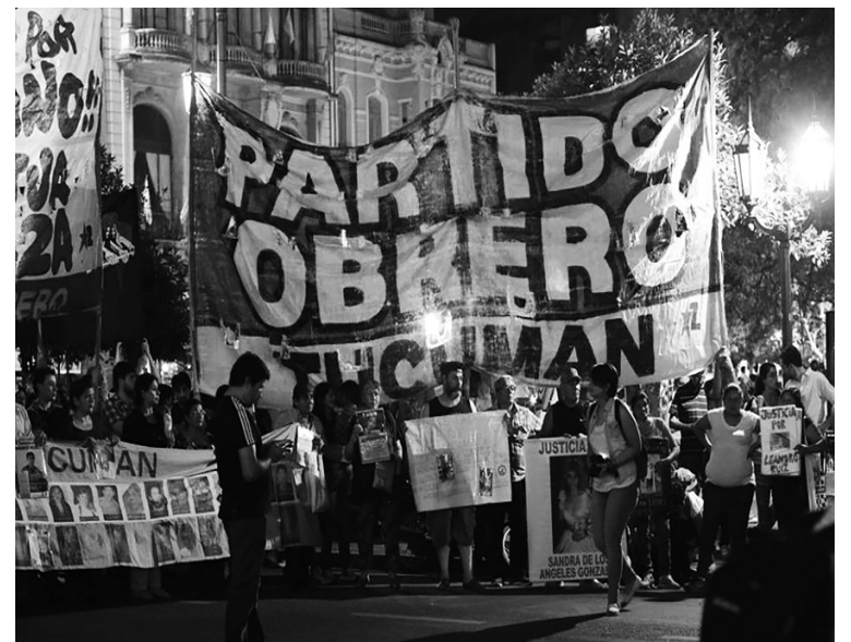
Movilización contra el fraude.