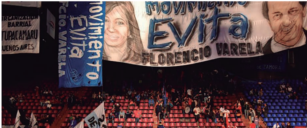
El rápido desbande en el frustrado festejo en el Luna Park

compitiendo con sus propuestas fascizantes por derecha con el macrismo, no está en condiciones de colocarse como candidato a una reorganización del peronismo. Sus votos fueron netamente opositores y negociará con Macri, lo que agravará la crisis del peronismo y la disgregación de sus filas de punteros. Por otro lado, el massismo tiene nueve diputados dispuestos a retirarse del Frente Renovador, con Roberti a la cabeza (su mujer ya se fue), pero hacia Scioli.