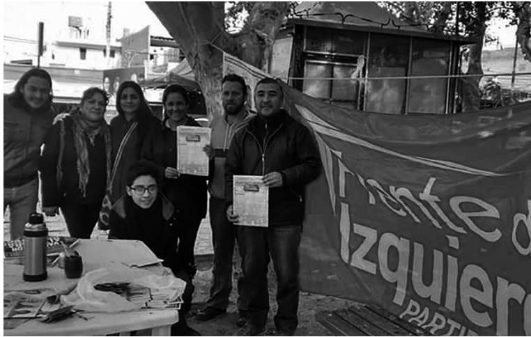
La rebelión popular contra la depredación ambiental influyó en la derrota de Beder

El Frente de Izquierda acrecentó su votación, de 2.300 votos lo-