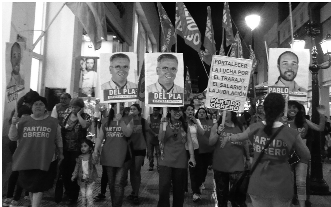
En Salta capital Claudio Del Plá obtiene casi un 10% y Pablo López más del 11%

En relación a la votación a presidente, el 2,77% está por debajo del 3,20% obtenido por las dos listas del FIT en las Paso -es decir, la fórmula liderada por Del Caño no llegó a sumar el