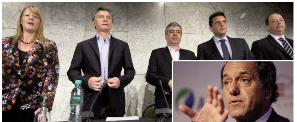
El compromiso de los candidatos: una tarifa social que cubre un consumo de indigencia.

Nada de abrir los libros de las empresas, controlar los costos y pasar a manos del Estado la prestación de los servicios públicos.