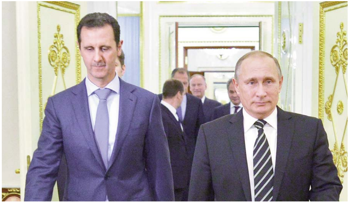
Al Assad y Putin: Putin no hubiera podido enviar tropas a Siria sin el consentimiento de E.E.U.U. y el estado sionista.

Rusia repite, contra EI, la táctica de Alemania contra la URSS en la Segunda Guerra: