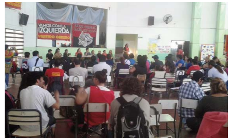
Un momento del congreso

Las intervenciones en las comisiones dieron cuenta de las enormes experiencias de lucha de la región, en donde resultaron ilustrativos los ejemplos de los vecinos de Villa Regina, que hace más de un año sostienen una asamblea de 140 vecinos sin techo, arrancando un comprome-