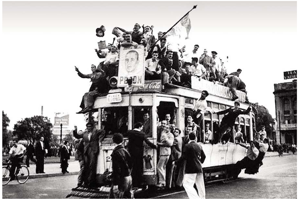
Dos momentos del 17 de octubre de 1945

En pocas horas, la celebración por el 17 de octubre, que el comando de campaña electoral de Daniel Scioli llegó a imaginar como una movilización multitudinaria e inapelable en cuanto a la lozanía del peronismo, pasó de Plaza de Mayo a una ceremonia íntima.