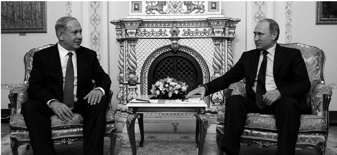
El primer ministro israelí, Benjamín Netanyahu, junto al presidente ruso Vladimir Putin

La movida militar rusa en Siria vino precedida, entre otras cosas, por un encuentro entre el primer ministro ruso, Vladimir Putin, y su par israelí, Benjamín Netanyahu. Allí, Rusia dio garantías de que el nuevo operativo militar no comprometería los intereses estratégicos de Israel. Señal de ello es que el régimen sionista volvió a lanzar misiles contra posiciones del ejército sirio en las alturas del Golán, respondiendo, según sus autoridades, a un ataque previo de morteros provenientes de esa zona. Rusia hizo la vista gorda a este episodio pese a la encendida defensa que hace de su aliado sirio, Bashar al-Asad, en Naciones Unidas.