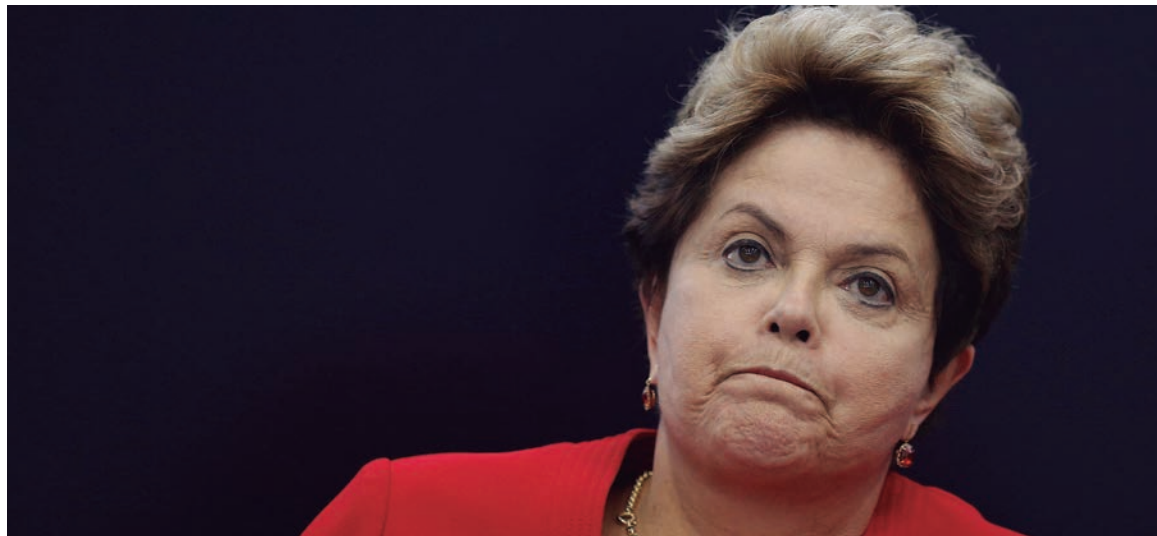
Dilma Rousseff, presidenta de Brasil.

La gobernabilidad se ha convertido en la principal prioridad, en momentos en que la recesión