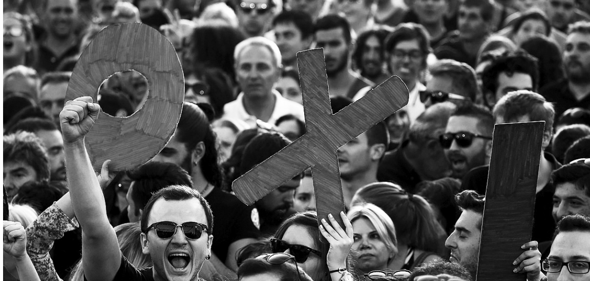
Una de las movilizaciones por el NO en Atenas.

La llamada 'traición' de Syriza es tan evidente como relativa. En primer lugar, porque nunca ocultó su posición de apoyo incondicional a la Unión Europea y al sistema euro, y porque se trata de una organización políticamente democratizante, o sea que adopta las condiciones del estado capitalista. A esto hay que agregar la renuncia a formar un gobierno independiente y establecer una coalición con la derecha clerical y militarista. Su gestión de gobierno fue un recu-