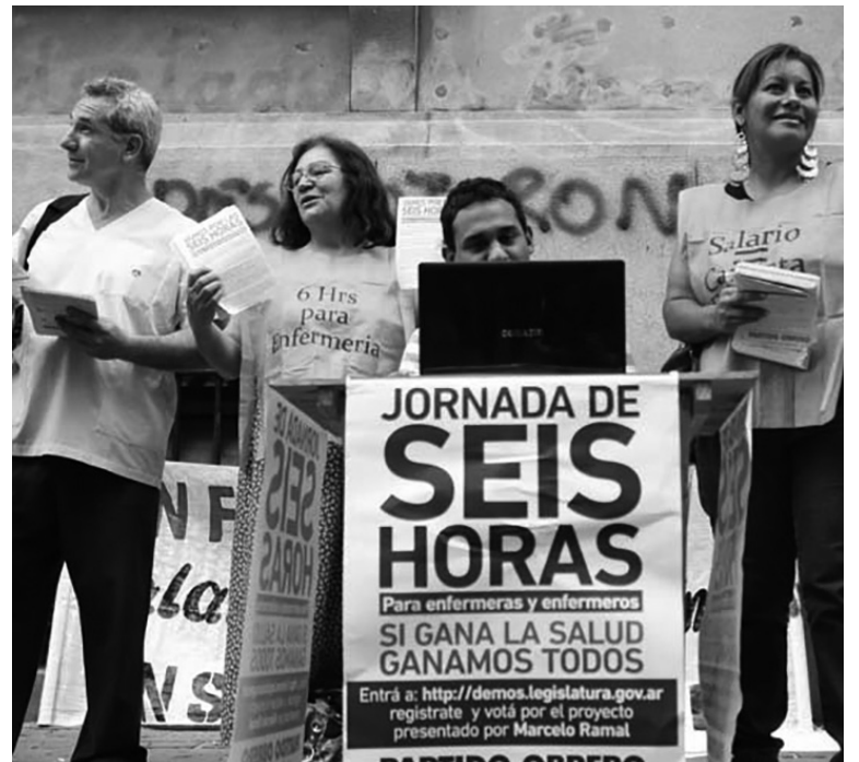
Una lucha que se instala en la Ciudad