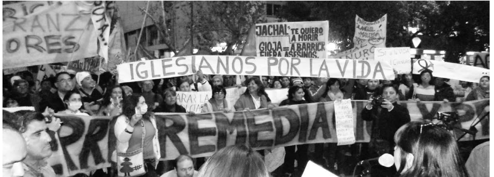
En Jáchal se movilizó un tercio de la población.

Esto significó la destrucción de miles de puestos de trabajo en fincas y chacras. Para botón de muestra sirve la producción de cebolla, que en 15 años se redujo de dos mil