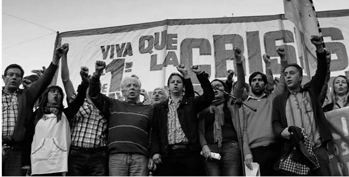
Lo que está en juego no es una forma de hacer política sino qué clase social paga la factura de la quiebra nacional

El revoledo de carpetas retrata la descomposición de los partidos de la burguesía, reducidos a un grupo de camarillas que sobrevive del saqueo del presupuesto público. Desde el punto de vista