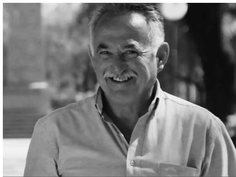
AURELIO DÍAZ CANDIDATO A DIPUTADO PROVINCIAL