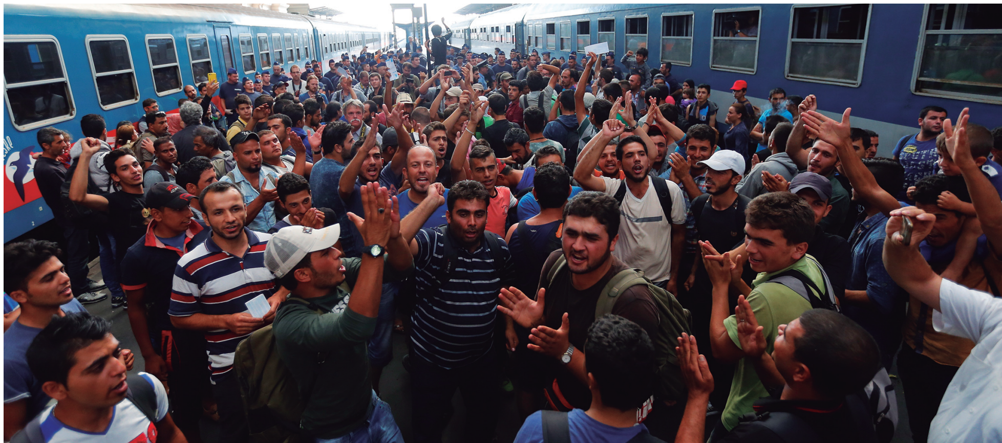
Estación Budapest, la rebelión en marcha: inmigrantes esperando partir hacia Austria

El llamado "cambio de actitud" de la Unión Europea (UE) frente a la cuestión de los refugiados es sólo una cortina de humo. Si por un lado responde a la presión de la opinión pública de Alemania y de Austria para acoger a los refugiados, y por el otro a la rebelión popular de los propios refugiados, que salieron en masa a las rutas y desecharon los 'refugios' y 'registros', en la cuestión esencial de esta crisis humanitaria, las cosas empeoran visiblemente. Nos referimos a la acentuación de bombardeos en Irak y Siria y por sobre todo los bombardeos de Arabia Saudita y Estados Unidos a Yemen, de donde saldrá una inminente ola de nuevos refugiados. Francia ha de-