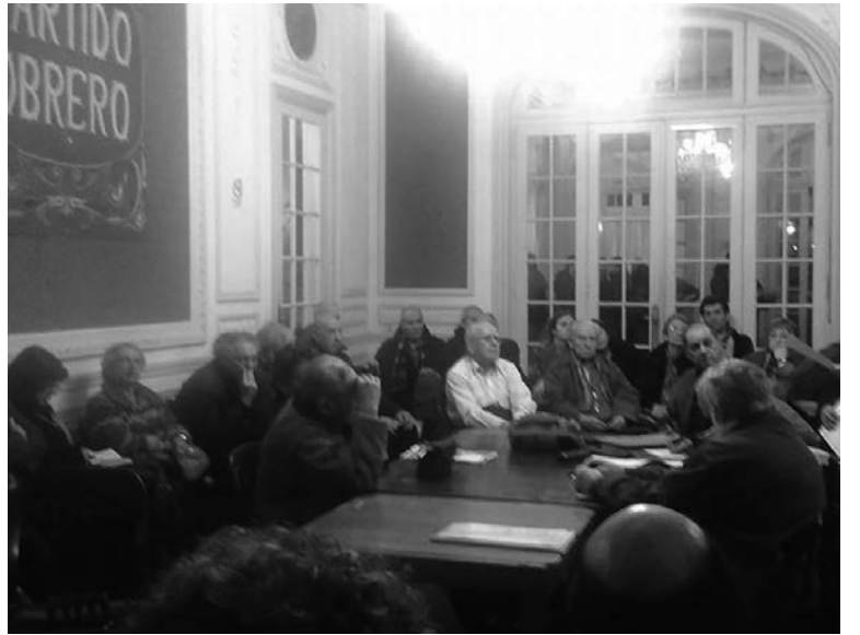
Asamblea de ex trabajadores de Gas del Estado.

Una asamblea de alrededor de 150 ex trabajadores de Gas del Estado votó un plan de movilizaciones para lograr su ley de resarcimiento económico y una mesa de dirección de su coordinadora.