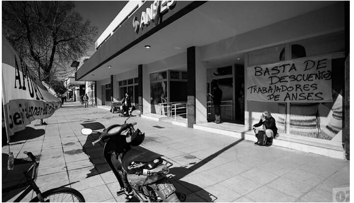
El flagelo del impuesto hizo estallar el acuerdo paritario.

El flagelo del impuesto hizo estallar el acuerdo paritario. Se ha puesto en pie un movimiento unitario, desde las asambleas de trabajadores de las Udai y los edificios, desbordando por completo a todas las conducciones sindicales. Apops y ATE se recomodaron rápidamente brindando cobertura gremial y tratando de remediar el repudio que había generado el acuerdo del aumento salarial. UPCN y Secasfpi intentaron por todos los medios levantar el conflicto, incluso apelando a las patotas. El nivel de adhesión a la medida en