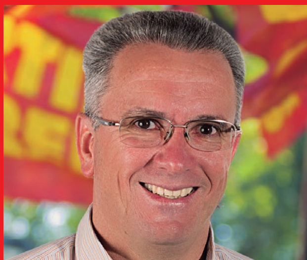
Claudio del Plá DIPUTADO POR SALTA