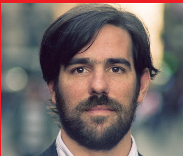
Nicolás del Caño PRESIDENTE