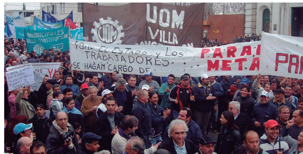
Movilización por Paraná Metal, en 2009.