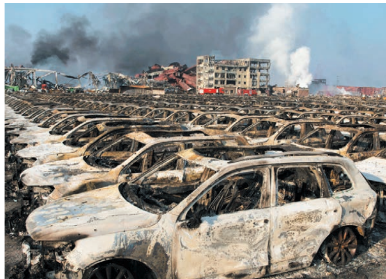
La explosión en Tianjin provocó 139 muertos.