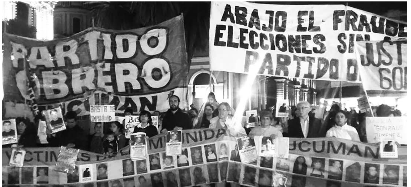
Movilización en Tucumán

Massa y Stolbizer se apresuraron a 'unirse' en una conferencia de prensa para sostener lo mismo que el kirchnerismo: que la crisis se debía resolver en el ámbito de la Justicia Electoral. Cano, por su lado, tocaba un arreglo musical diferente al denunciar al oficialismo local como una asociación ilícita para organizar el fraude, involucrando a la propia junta electoral. Este planteo parecía mostrar una brecha entre la coalición local de la oposición y sus tutores nacionales. La disposición de Macri y Massa a un compromiso con los K ponía de manifiesto una fuerte presión de los gobernadores pejetistas, decididos a rescatar a su 'partiducumano' -no sea que el asunto se propague por el norte argentino.