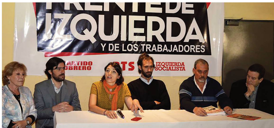
Conferencia de prensa del Frente de Izquierda en Córdoba