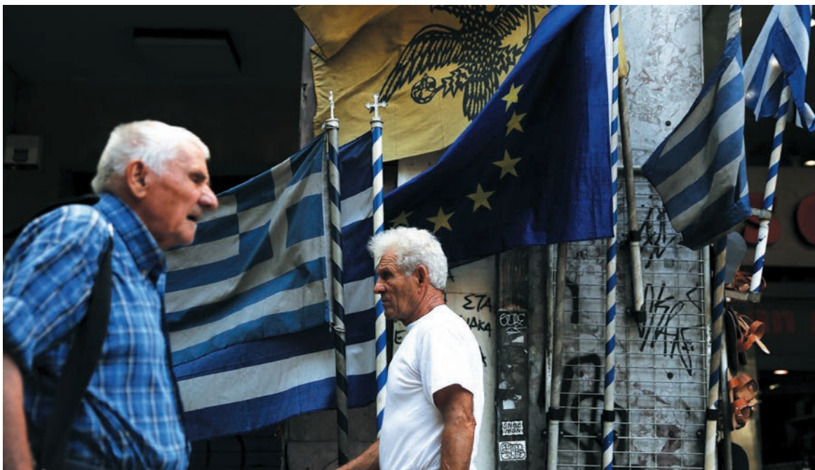
Banderas de Grecia y la Unión Europea en Atenas.

Las elecciones anticipadas en Grecia transitan por un campo minado. Los sondeos no le aseguran a Alexis Tsipras una mayoría absoluta. No habría que descartar que, si no la consigue con su aliado Griegos Independientes (y con la ayuda de los cincuenta diputados que recibe el que sale primero), acabe renunciando -esta vez en forma definitiva.