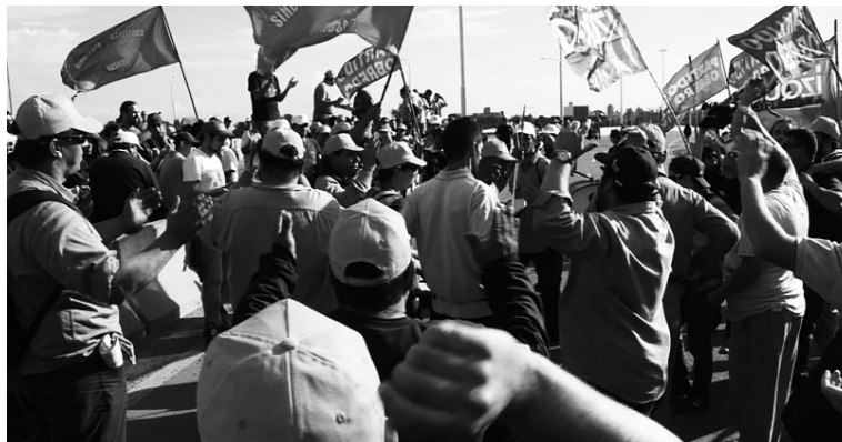
Piquete durante el paro aceitero. El derecho de huelga seguirá en peligro.

La Corte produjo fallos -en medio de la crisis política con el gobierno, dos años atrás- a favor del reconocimiento de reclamos de sindicatos simplemente inscrip-