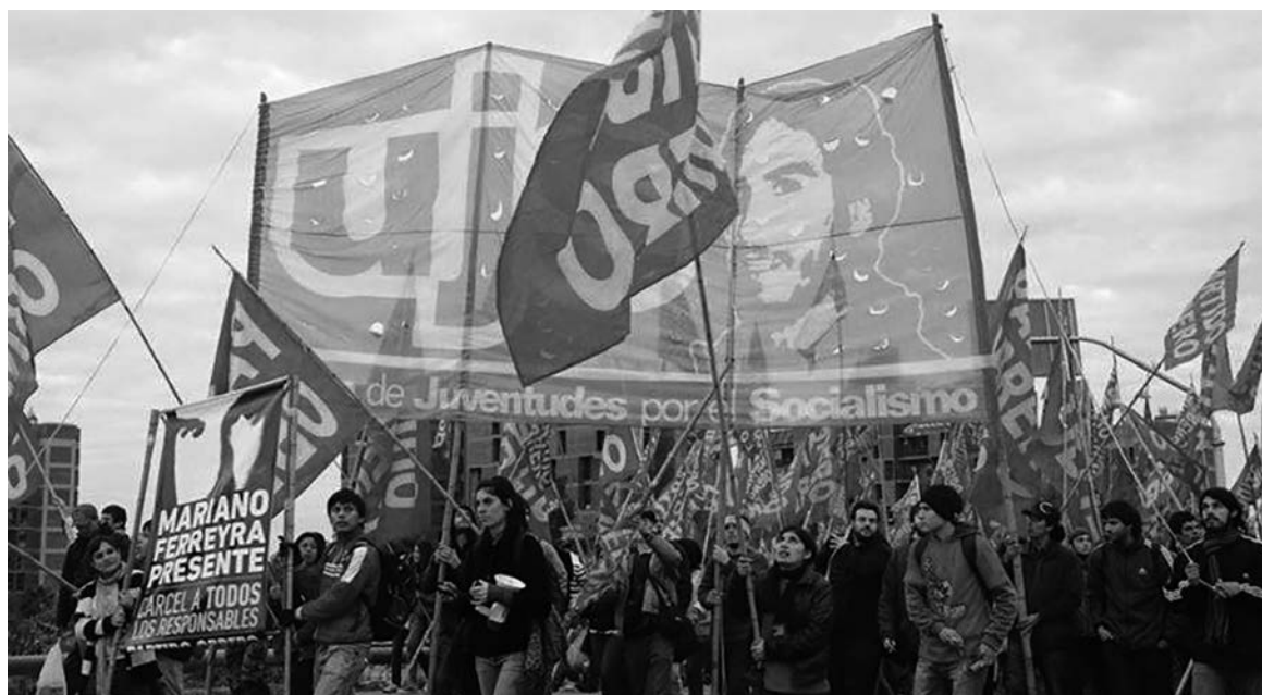
La UJS-PO, única fuerza que se presenta en las trece facultades.

La UJS-PO, la única fuerza que participa en las elecciones de las trece facultades de la UBA, desarrolla una gran campaña para derrotar a las listas que responden a las camarillas capitalistas. Otras corrientes, como La Bemba en Fi-