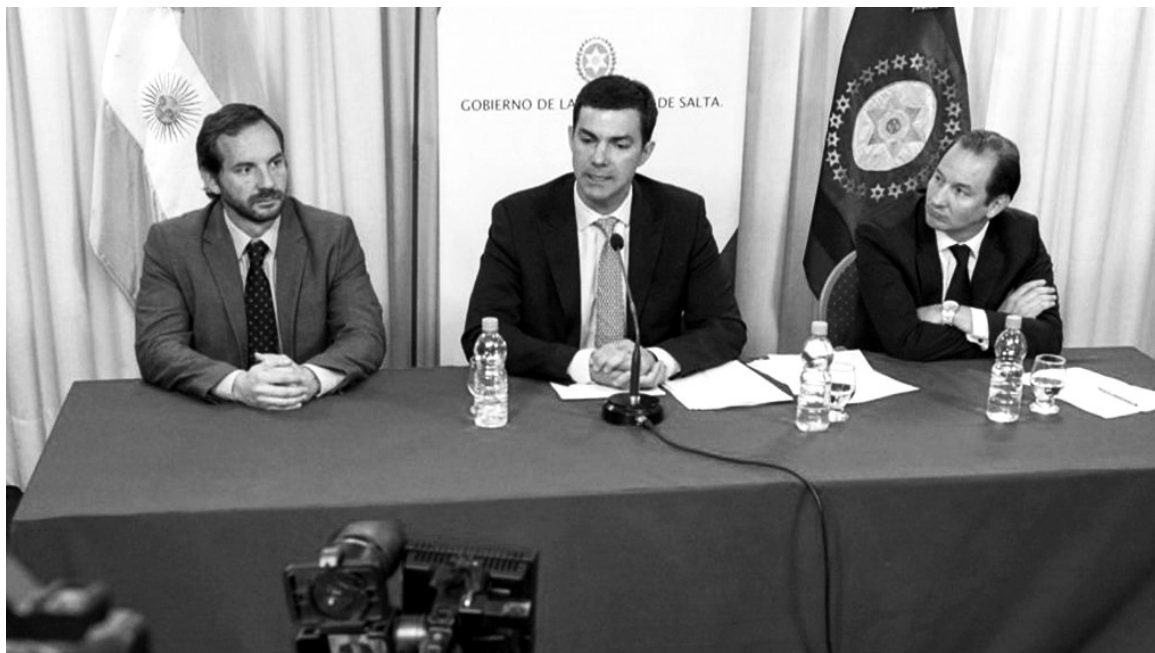
El gobernador de Salta, Juan Manuel Urtubey, en una conferencia de prensa luego de reunirse con dirigentes rurales.

Desde la bancada del PO presentamos un proyecto alternativo para confrontar con la iniciativa oficialista. Ya que se criticaba la 'presión impositiva', propusimos eliminar los impuestos al consumo, el impuesto a las ganancias sobre el salario y el cobro del impuesto inmobiliario rural sobre el valor real de la tierra -que los terratenientes y consorcios agrarios pagan 20 veces por debajo de su valor. Ya que se denunciaba la carga de los fletes para el comercio agrario, planteamos el enorme sobrepeso que hoy reciben las petroleras, equivalente a un plus del 75% por encima del pre-