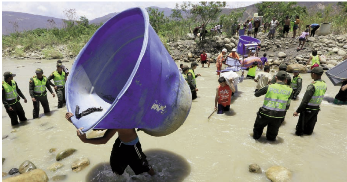
Colombianos atravesando la frontera que divide a Colombia y Venezuela.

La crisis, en Venezuela, parece no tener límites. El "tejido social", históricamente débil, se descompone a un fuerte ritmo como consecuencia de una inflación que escala sin controles y el desabastecimiento. Objetivamente, la revolución bolivariana ha llegado a su final: diversos avances sociales, pero también nacionales (recuperación de PDVSA), están siendo arrasados por la marcha de la crisis. Desde diversos sectores del partido oficial, el Partido Socialista Unido de Venezuela (PSUV), se ha denunciado el lucro que obtiene la llamada "boliburguesía", por su acceso privilegiado a divisas oficiales o permisos de importación. Es indudable que se desarrolla una "guerra económica" contra el gobierno, como el acaparamiento o el contrabando de petróleo, pero el terreno ha sido abonado por el fracaso del intervencionismo estatal (burocrático) de contenido burgués, por un lado, y por la permisividad oficial frente a esta misma guerra, por el otro. En los últimos días, esta crisis ha alcanzado un punto extremo con la decisión de prohibir el tráfico comercial y el tránsito de personas en la frontera con Colombia. El contrabando de combustible de uno a otro lado ocurre, sin embargo, desde hace más de una década -incluida la instalación de ductos subterráneos, es curioso que recrudezca ahora que los precios in-