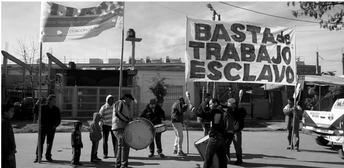
Movilización del Sitraic en Lomas de Zamora.

En horas de la mañana del viernes 21 de agosto, cuando el equipo de trabajo del Sitraic se dirigía hacia una obra en conflicto, ubicada en la localidad de Villa Fiorito, advirtió la presencia inusitada de una cantidad llamativa de oficiales de policía en las inmediaciones del lugar. Se trataba de un operativo montado para detener a los compañeros del Sitraic que intentaran garantizar la continuidad del cese de actividades impulsado junto a los trabajadores de la obra en cuestión.