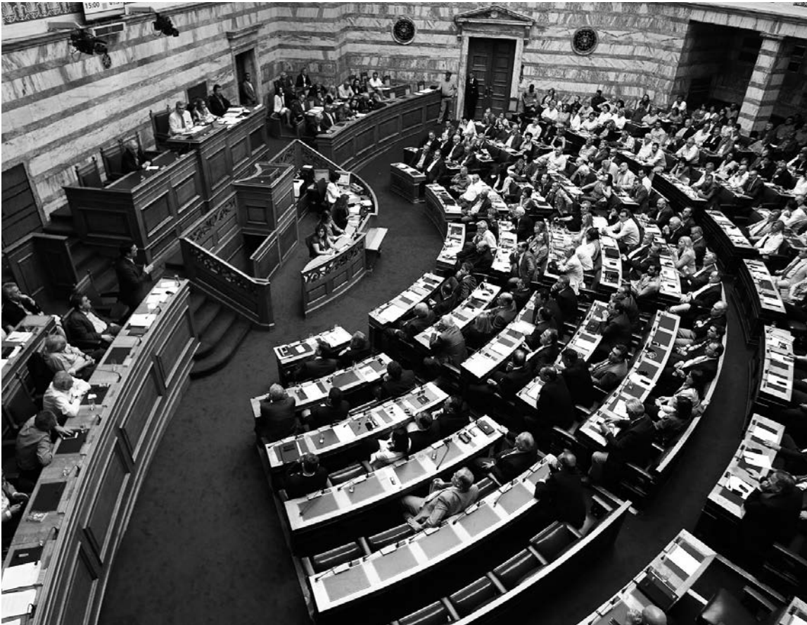
Julio de 2015. El parlamento griego aprueba una parte del paquete de reformas exigido por la Troika.