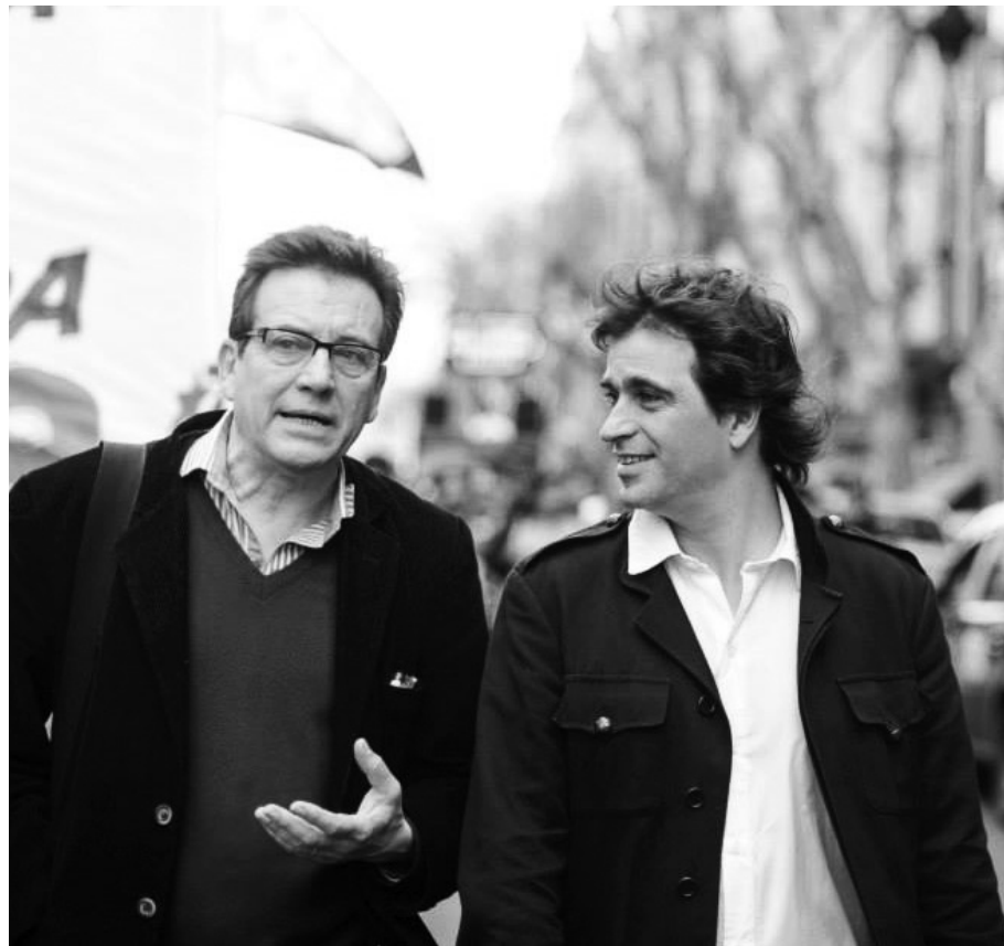
En oposición a la agenda del ajuste, un mayor número de diputados reforzará la condición de oposición política exclusiva del FIT, y una referencia política para los trabajadores.

El Frente de Izquierda aspira a recoger al electorado que ha votado por las tendencias de izquierda y centroizquierda que no lograron superar el piso proscriptivo. Aún es prematuro, sin embargo, determinar las consecuencias que tendría sobre el Frente de Izquierda, a nivel nacional, una polarización anticipada. Por de pronto, impulsaremos una campaña para denunciar los compromisos que esta falsa oposición está buscando con el oficialismo, para limitar el tema del fraude