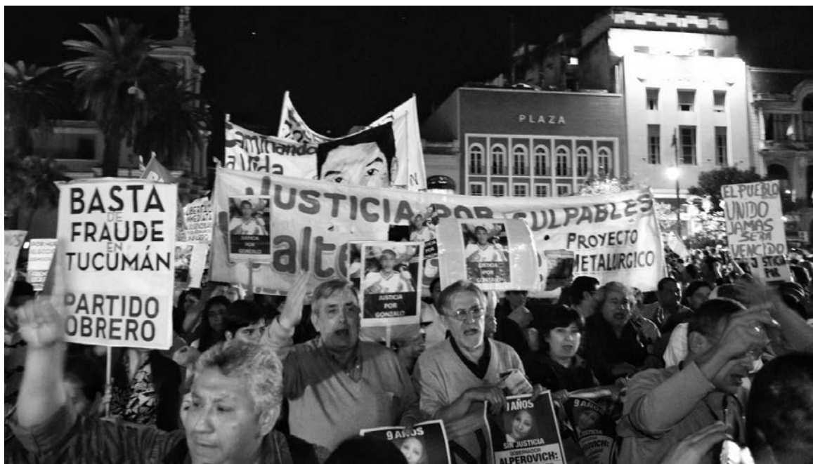
Columna de la Comisión de Víctimas de la Impunidad en la movilización de Tucumán.

En Tucumán, el robo de boletas o la quema de urnas es la consecuencia de un sistema electoral fraudulento -los acoples, que permiten multiplicar hasta por centenares el número de clanes punteriles o incluso familiares que suman sus votos al candidato oficial. Es lo que la Justicia acaba de aprobar para Santa Cruz -de