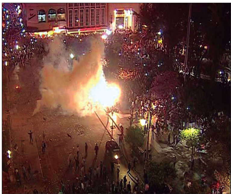
Escenas del Tucumanazo, represión y respuesta popular. Exigimos nuevas elecciones generales para todos los cargos, y sin acoples.

Es necesario darle continuidad a la movilización, que ha comenzado a extenderse a los pueblos del interior de la provincia, y debatir la necesidad de un paro general contra el fraude, convocado desde las puebladas y asambleas.