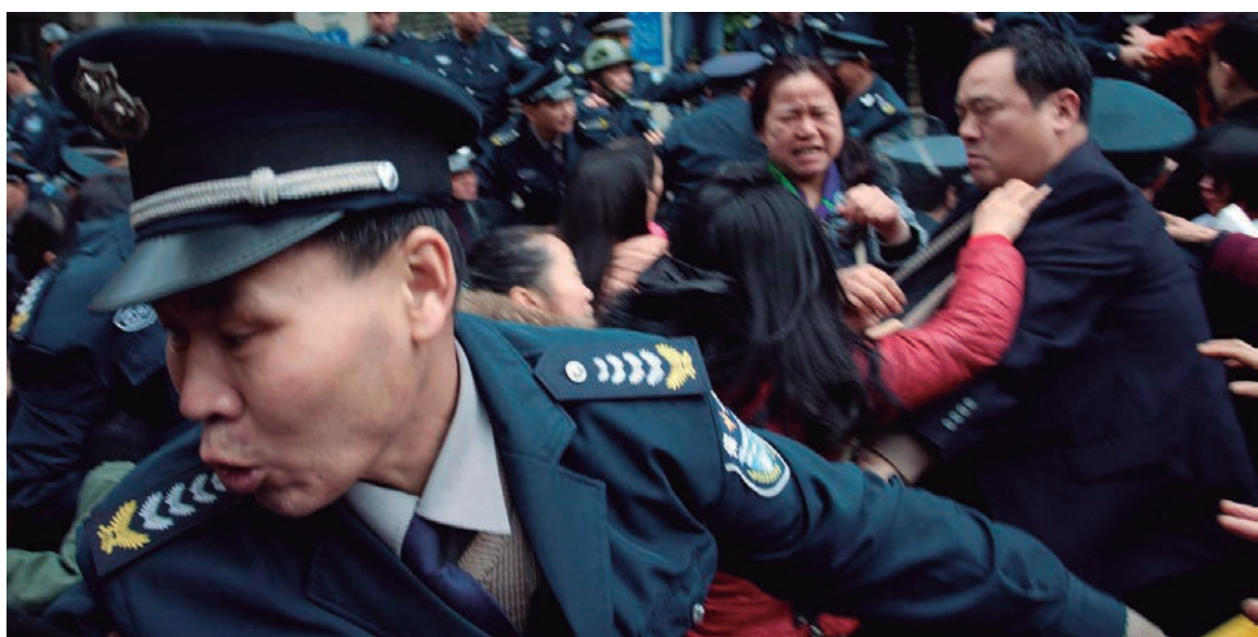
¿Hacia otro "evento Lehman Brothers"? El edificio capitalista internacional está montado en una especulación gigantesca.

tada por la caída de los precios internacionales, provocada a su vez por la crisis de China. Un perro, en fin, que se muerde la cola.