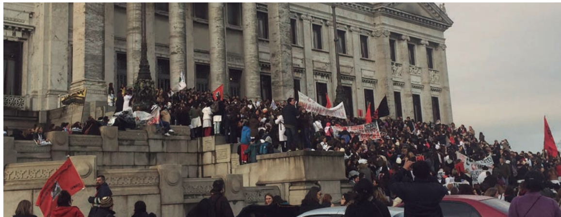
Movilización docente frente al parlamento uruguayo.

Frente a la imposibilidad de conciliación, Tabaré Vázquez decretó la "esencialidad" (prohibición de la huelga) a partir del miércoles 26 para la educación primaria, secundaria y universi-