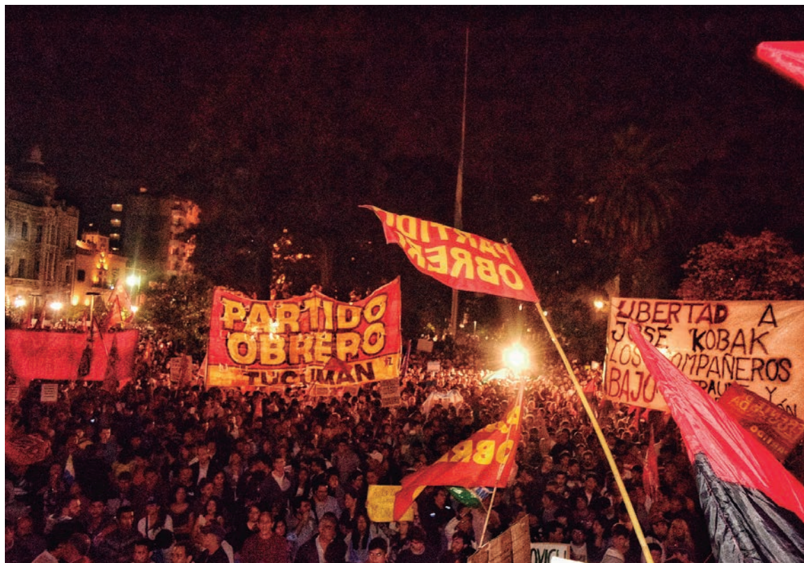
EL MONO LOPEZ