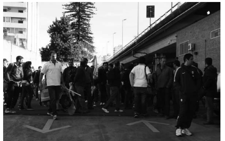
Patota agrede a activistas en asamblea de Apta

Estas maniobras buscan controlar la rebelión antiburocrática en desarrollo. El ministerio, en defensa de los intereses del Estado que controla Aerolíneas-Austral,