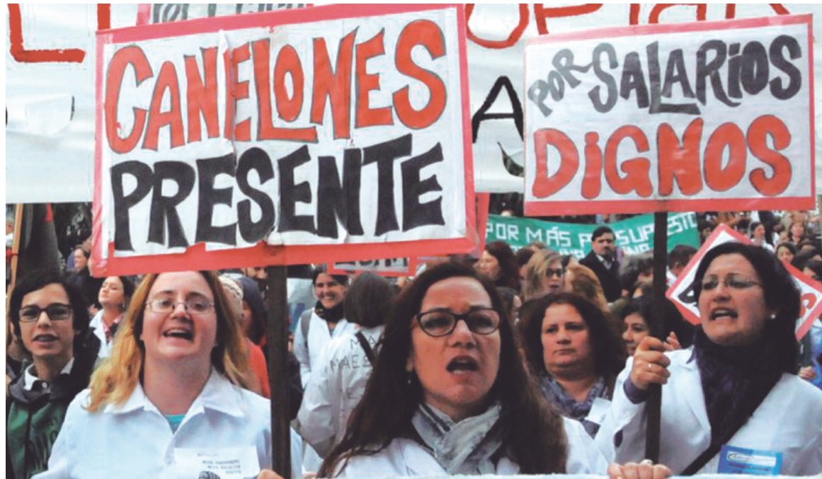
Docentes movilizados por la educación pública en Montevideo, en julio de este año.

Tabaré Vázquez intentó desactivar la creciente oposición interna con un anuncio de inversiones, pero a poco de analizar esos números queda claro que la inversión pública caerá alrededor de un 20% respecto del gobierno anterior, y la inversión privada son una serie de proyectos de dudosa implementación y que además requerirían ga-