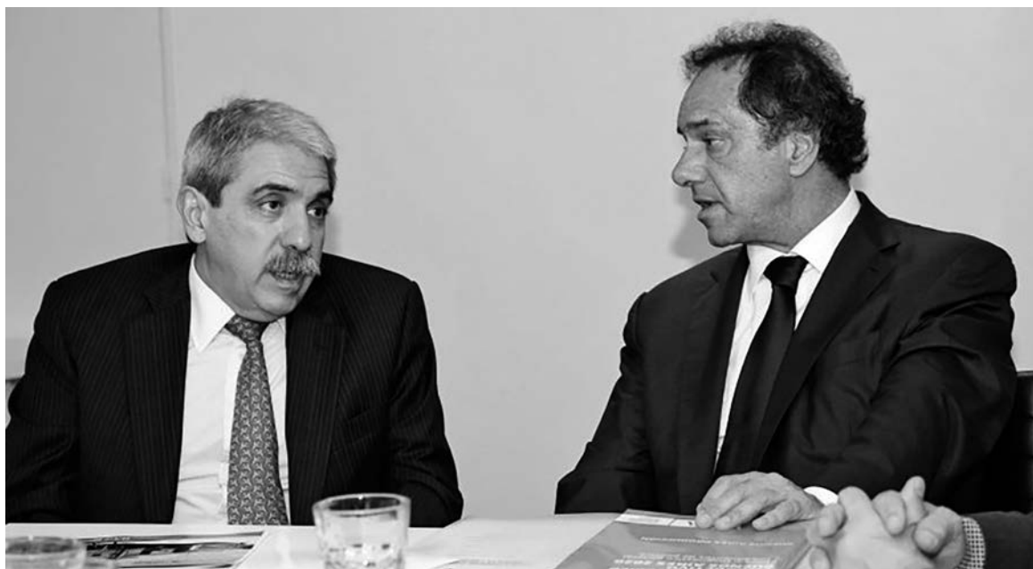
La victoria de Scioli, por un lado, y de Aníbal, por el otro, refuerza las contradicciones de un futuro gobierno bicéfalo

Aunque Massa jura que no hará componendas con Scioli o Ma-