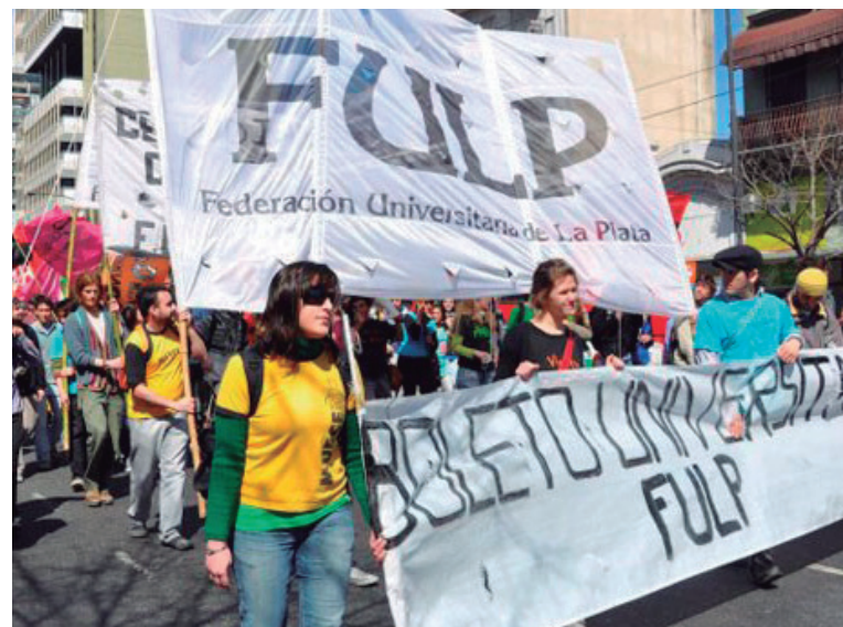
Movilización en La Plata por el boleto estudiantil

Este 12 de agosto hemos dado un primer paso, logrando que nuestro proyecto de ordenanza pase a discusión en las comisiones de Interpretación, Reglamento y Asuntos Legales, Servicios Públicos, Tránsito y Trans-