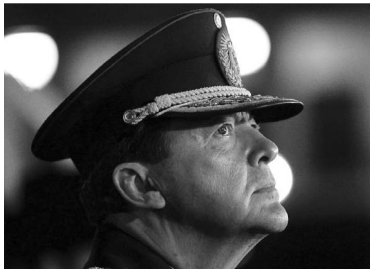
El gobierno nacional, el provincial y la Justicia federal maniobran para asegurar la impunidad del ex jefe del Ejército.