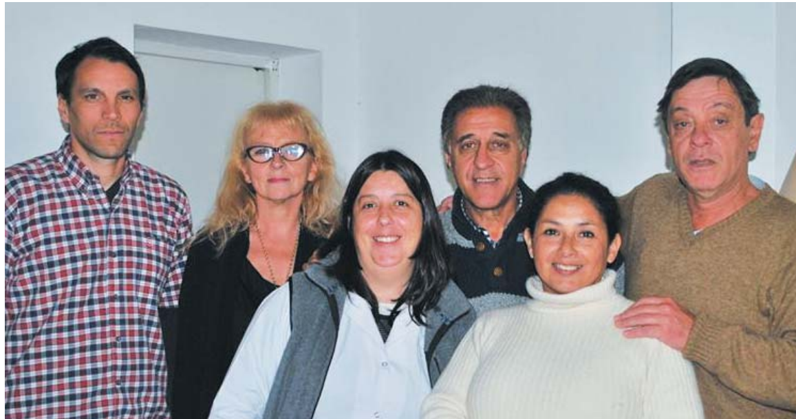
Néstor Pitrola con candidatos del interior de la provincia

En el mismo día visitó Olavarría, donde la gira incluyó una intensa recorrida de medios. Los periodistas mostraron particular interés sobre la crisis que vive Grecia. Pitrola aprovechó para caracterizar las violentas contradicciones económicas que vive la Argentina como la