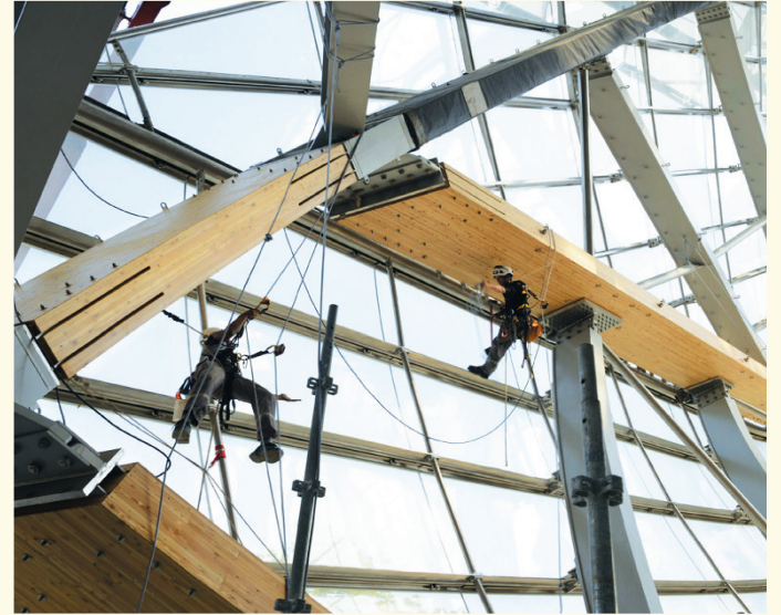
Fundación Louis Vuitton.

Ciertamente, la mercancía es anterior al capitalismo, pero también, ciertamente, el arte es muy anterior a la mercancía. De hecho, es bajo el capitalismo que los bienes artísticos devienen mercancía y se genera una industria de su producción y distribución.