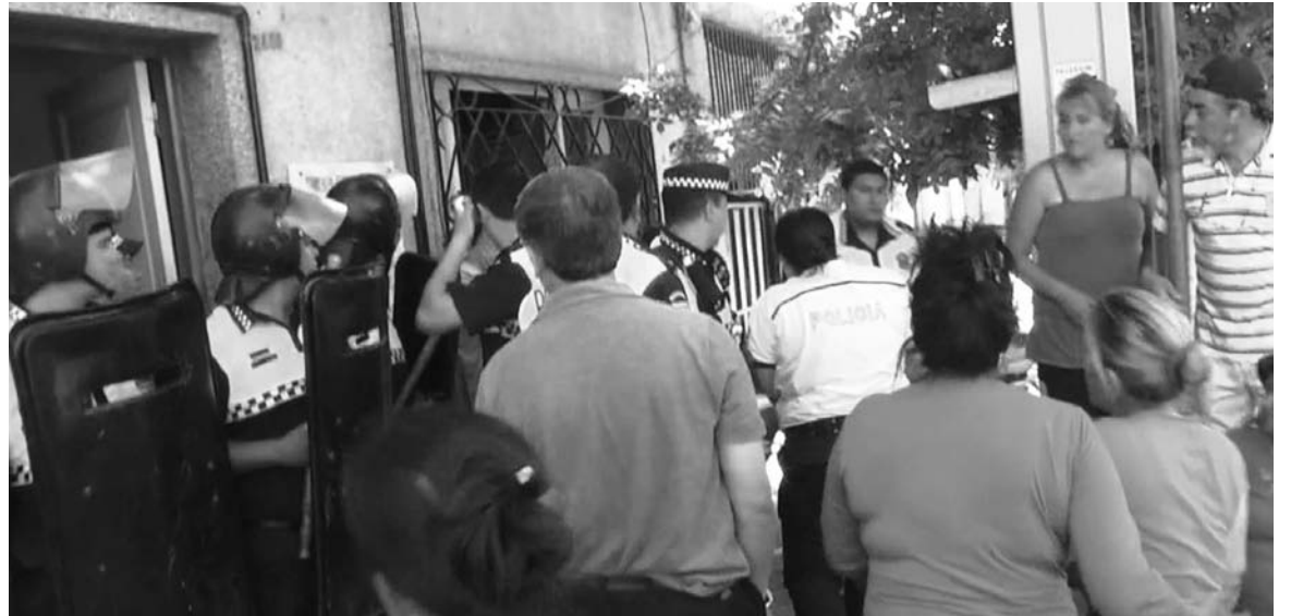
El PO impulsa el desmantelamiento de la policía, el Servicio Penitenciario y los servicios de inteligencia.

Desde el Partido Obrero planteamos que la policía, el Servicio Penitenciario y los servicios de inteligencias (D2) deben ser desmantelados. Se debe anular la ley de contravenciones. Se debe poner todas las comisarías y la propia cárcel bajo control de las organizaciones de derechos humanos y populares, interesadas en rescatar a todos aquellos que han caído en conductas y accio-