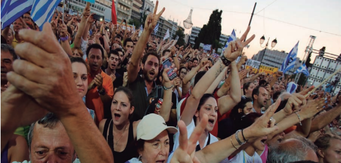
Festejos por el resultado del domingo. El referendo ha sido usado por el gobierno griego para neutralizar a quienes se oponen a la capitulación, no como un arma de lucha contra el asedio a Grecia.

Más allá de los términos con los que el gobierno acuñó la moción de rechazo al paquete de rescate que pretendía imponer el llamado Eurogrupo a Grecia, el vigoroso NO del pueblo griego a ese paquete, el domingo pasado, puede ser calificado como una rebelión popular contra la llamada troika que integran la Comisión Europea, el Banco Central Europeo y el FMI. Este trío siniestro del ajuste había desarrollado una fuerte campaña por el SI, no ya en términos mediáticos sino forzando al cierre indefinido de los bancos, en lo que puede ser calificado como un verdadero estado de sitio económico contra Grecia. En esta ofensiva, la troika había insistido en que el referendo carecía por completo de contenido, pues retiraba de la negociación el paquete de medidas que se ponía a votación. La victoria del NO sacudió a los pueblos de Europa, sometidos a la misma política de salvamento de la banca y del capitalismo por medio de la sangre, sudor y lágrimas de los trabajadores.