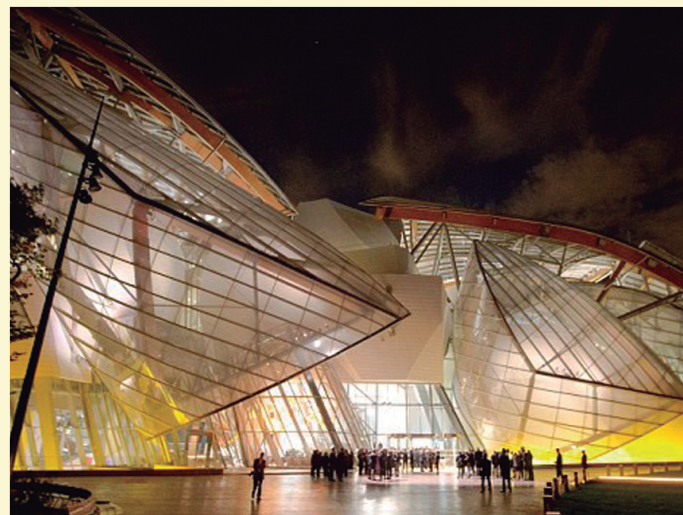
Museo de la Fundación Louis Vuitton.

La cultura en la sociedad actual es una mercancía. La mercancía es una forma social del producto del trabajo, propia de un modo de producir donde priman los productores privados independientes que se vinculan entre sí a través de lo que producen. La mercancía es anterior al capitalismo; en él, su circulación toma un carácter universal. Desde tiempos remotos la mercancía es el medio por el cual se vincularon los pueblos primitivos: comercian entre sí, quiebran el aislamiento, se convocan a una relación recurrente. Ese comercio, los puertos, la mercancía, constituyeron por los siglos de los siglos la vía del desarrollo de la cultura humana y del desarrollo de su fuerza productiva.