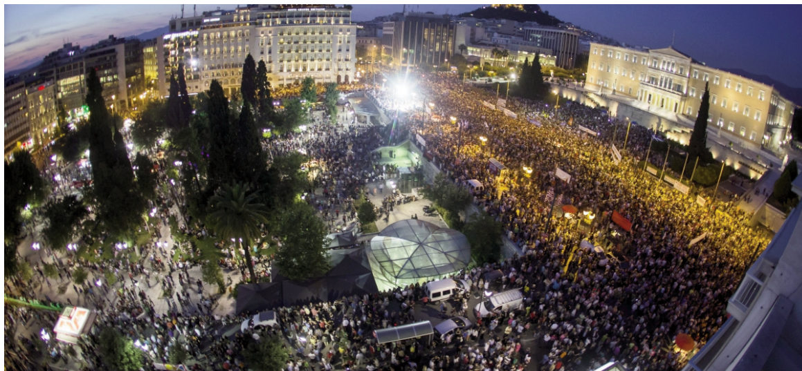
Movilización contra la Troika imperialista. El salto cualitativo de la crisis acentúa también la crisis de la dirección de las masas.

El principal promotor del endeudamiento europeo ha sido Alemania, que por este motivo lleva la batuta del ajuste contra Grecia. No se trata solamente del endeudamiento público; Alemania es el acreedor por excelencia de la banca privada. Por eso, el empeño del BCE por rescatar a los bancos griegos. Estos bancos usaron el financiamiento para expandirse en los Balcanes. La prensa internacional ya está avisando que, en caso de defol, el BCE incautará las sucursales de la banca de Grecia. El Fondo de Emergencia creado por la Comisión Europea para hacer frente a eventuales bancarrotas se financia con los Tesoros nacionales, pero también en el mercado internacional de deuda. Esto significa que el 'defol' arrastraría a muchos jugadores, tanto públicos como privados. Es necesario advertir que el Bundesbank tiene una abultada cartera de créditos incobrables contra el Banco Central de Grecia, por los préstamos otorgados a la industria alemana que exporta a Grecia (operatoria "Target II"), que serían de unos 150 mil millones de euros. Con esto a la vista hay 'economistas' que niegan el 'contagio' griego.