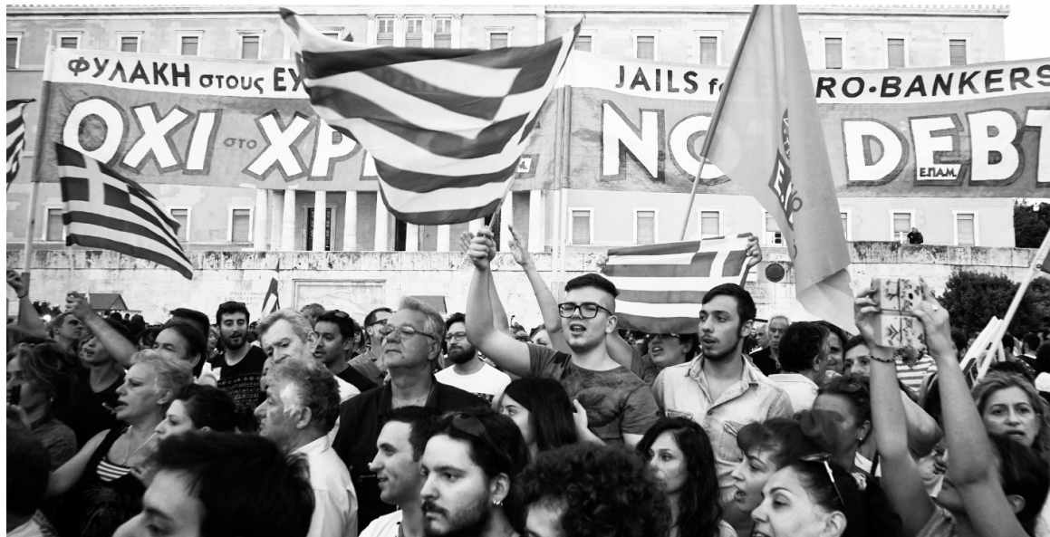
Movilización por el No. Syriza se ha fijado el objetivo contradictorio de atenuar el ajuste y, al mismo tiempo, pagar la deuda impagable.

En situación igual o peor que la de Grecia se encuentran otros doce países, entre ellos Ucrania, Venezuela, Granada, Ecuador y hasta Puerto Rico o Rusia, con Argentina en las gateras. El epicentro de la crisis está en los países desarrollados -los emergentes son el síntoma. Un defol de Grecia iniciaría un nuevo período de bancarrotas.