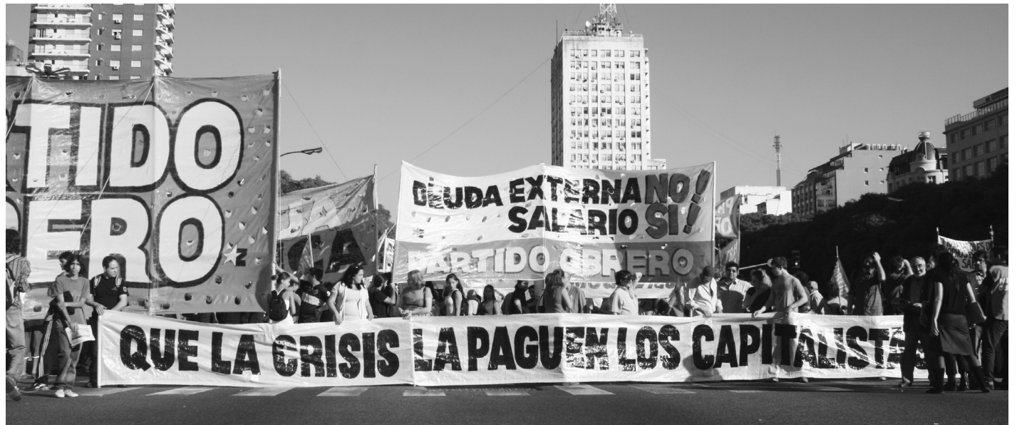
La crisis mundial y su repercusión en Argentina. Las elecciones no se desarrollan dentro de una torre de marfil sino en un marco de crisis y lucha de clases.

Los términos completos del acuerdo entre Scioli y CFK los conoceremos con el tiempo, o mejor dicho andando. Algunos observadores apresurados atribuyeron a este acuerdo la caída, en Wall Street, de las cotizaciones de empresas argentinas y bonos públicos. No se les ha ocurrido que, crisis griega, ucraniana, portorriqueña y petrolera mediante, la burbuja especulativa se encuentra al borde de un colapso, en especial si incorporamos a la Bolsa de Shangai, y no por desconfianza a Zannini. Ahora que el dólar se empuja hacia los 14 pesos en las transacciones en la Bolsa de Buenos Aires, los comentaristas se están avivando que el desbarajuste financiero se debe a algo más que a Zannini. Si, como cuenta Carlos Burgueño en Ambito Financiero de la semana pasada, el 'chino' y el motonauta acordaron dedicar los primeros cien días de un eventual gobierno a arreglar con los buitres, la designación del consejero íntimo de CFK podría ser el gran espaldarazo para las Bolsas. Bien mirado, el problema ahora lo pasan a tener los fondos buitres, quienes deberán pensar dos veces an-