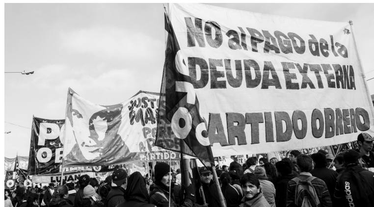
Movilización del Partido Obrero, denunciando la deuda externa. Después de dos mandatos, el gobierno "nacional y popular" ha reconstruido integralmente la hipoteca de la deuda.

De tanto compararse con Grecia, sin embargo, los apóstoles del ajuste no han reparado en los alcances de la crisis helena; el default asoma en una decena de países, y ya empezó en Puerto Rico y Ucrania. Mientras los voceros de Macri o Scioli prometen una "lluvia de capitales", esos mismos capitales se fugan de los mercados emergentes, porque temen además una suba del precio del oro y de las tasas de interés. El rumbo de la crisis mundial se juega hoy definitivamente en la arena política, debido a la pretensión de transferirle a las masas el rescate estatal de los bancos; en Grecia y en