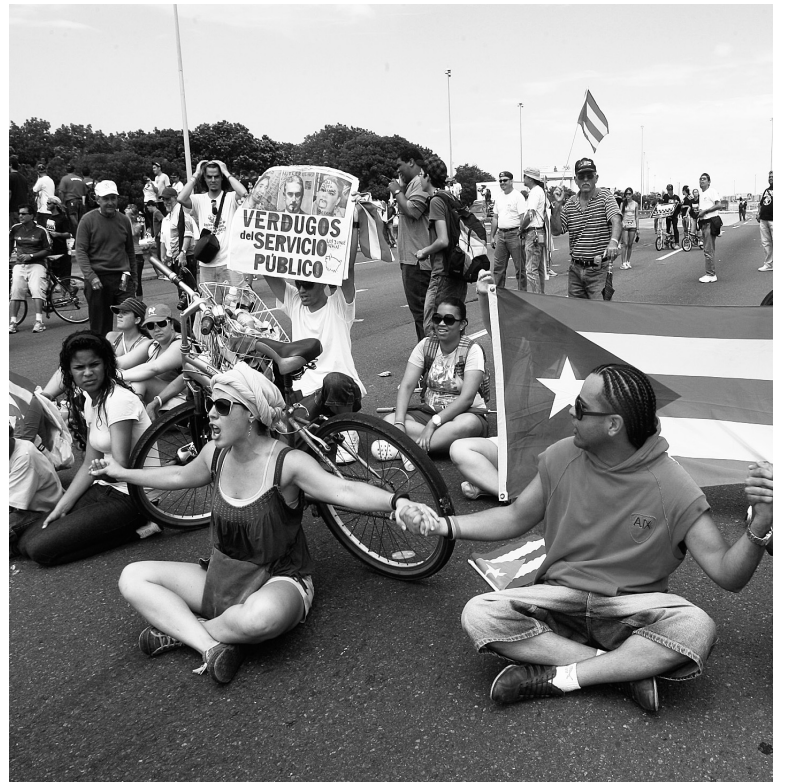
Puerto Rico es el eslabón más débil de una cadena de insolencias.

Hace mucho tiempo que los círculos de poder conocen al dedillo que Puerto Rico, el "Estado asociado" de la Unión Americana, se encuentra en bancarrota. Es un testimonio de la miopía interesada de los medios de comunicación que hubieran mantenido en la ignorancia a la opinión pública.