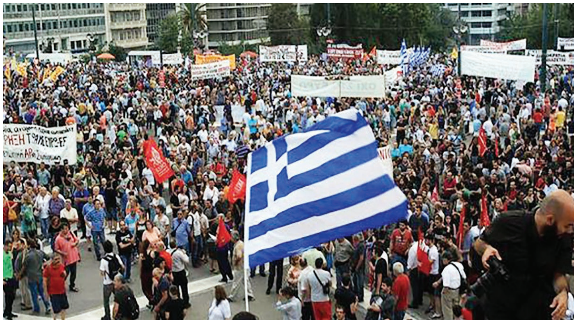
Movilización de trabajadores en Atenas, contra los planes de ajuste.

Los anuncios están sacudiendo fuertemente la confianza popular en el gobierno. Para el secretario general de la Federación de Jubilados del sector privado, el nucleamiento más representativo, "el paquete no es en absoluto positivo, y no hablo