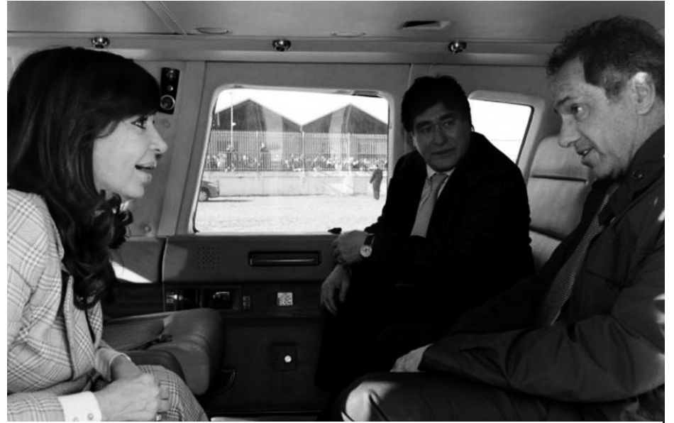
Cristina Kirchner, Carlos Zannini y Daniel Scioli en el helicóptero.

Los voceros del sciolismo ya le habrían comunicado a las grandes patronales el contenido del pacto. La Bolsa, luego de un derrumbe por el 'susto', retomó el alza. Las patronales quieren que se solucione lo que llaman "falta de dólares", porque exigen la entrega de los 14 mil mi-