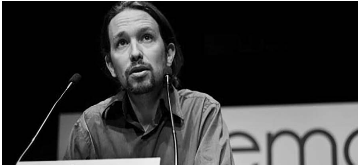
Pablo Iglesias, líder de Podemos. En una semana de gobierno, las limitaciones de la agrupación salen a la luz.

Para ponerlo en palabras de un militante de la Plataforma de Afectados por la Hipoteca (PAH), con fuerte presencia en la candidatura de Carmena, "les va a resolver a los bancos el problema de alquilar los pisos vacíos con un alquiler social que nadie estará en condiciones de pagar". La alcaldesa de Barcelona, activista fundadora de la PAH, tiene otro estilo más agresivo y combativo, pero choca con los mismos límites. Resolver el problema de la vivienda supone expropiar a la banca, la gran propietaria inmobiliaria de España, y ceder sus viviendas a los ciudadanos sin techo o amenazados por los desahucios. El gobierno socialista de la Junta de Andalucía está en este sentido por delante de Podemos y sus aliados con un decreto que propone el derecho prioritario de compra de cualquier vivienda en proceso de desahucio para cederla en alquiler social a sus anteriores propietarios.