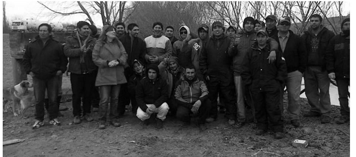
Nuestra diputada Gabriela Suppicich con los trabajadores en lucha.

-La obra se encuentra en un 40 por ciento. Te entra la bronca, porque queda un año completo de trabajo y la empresa decide despedir 54 trabajadores, gente capacitada. Los compañeros aprendieron a leer y ejecutar planos, a dirigir gente, explotaron toda su capacidad, se vio realmente el potencial de todos nuestros obreros de Zapala y Las Lajas. Estos despidos son arbitrarios, por eso decidimos subirnos a la ruta y movilizarnos a la Subsecretaría de Trabajo. A causa de estas medidas de fuerza conseguimos una conciliación obligatoria, que plantea que a partir del lunes 21 deberíamos estar ingresando con todos los