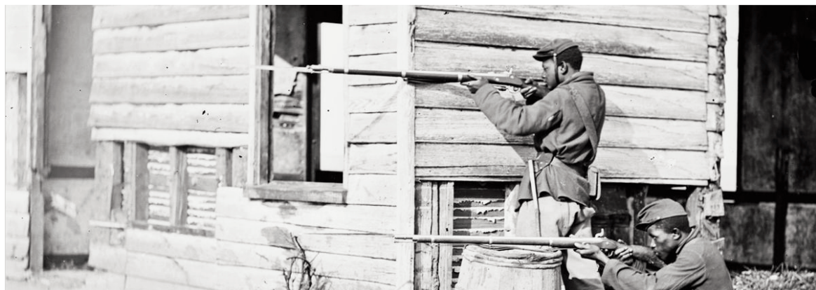
Soldados de color peleando para la Unión. Las derrotas del inicio de la guerra obligaron a Lincoln a ir más allá de su programa inicial, liberando a los negros e integrándolos al ejército.

En 1865 culminaba la guerra de secesión -también conocida como guerra civil estadounidense-, que enfrentó durante cuatro años a los estados del norte con los estados del sur.