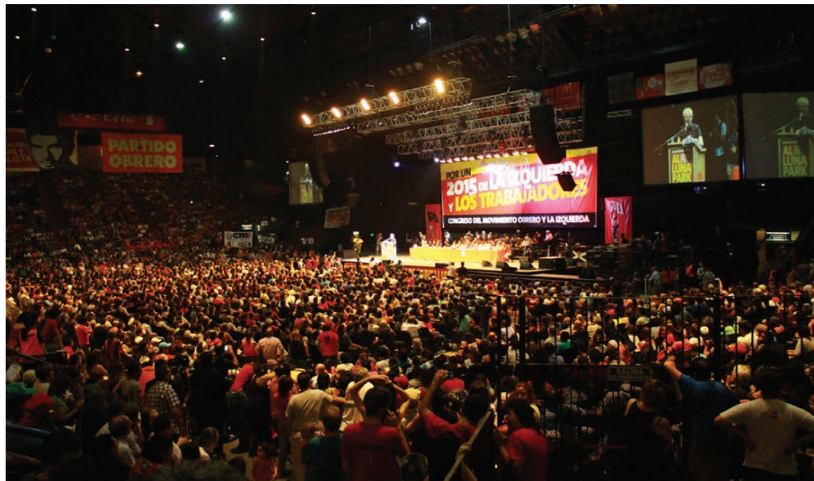
El Congreso en el Luna Park fue diseñado para que sea realizado en común por todo el Frente de Izquierda.

Según el PTS, los "frentes únicos" son válidos para la "lucha de clases", pero no para elecciones, anunciando la posibilidad de una política socialista que no se base en la lucha de clases. Se trata de un dislate, por un lado, y de una concesión al anarquismo, por el otro. Es una posición electoralista, que busca los votos por los votos mismos. Diferencia al Frente de Izquierda, al que adjudica la tarea de desarrollar una "agitación electoral" (textual) de la lucha de clases, privando a esa agitación de contenido socialista -o sea de una convocatoria a una lucha de clases. Este electoralismo en su campaña aflora con planteos acerca del "perfil joven" -a la Du-