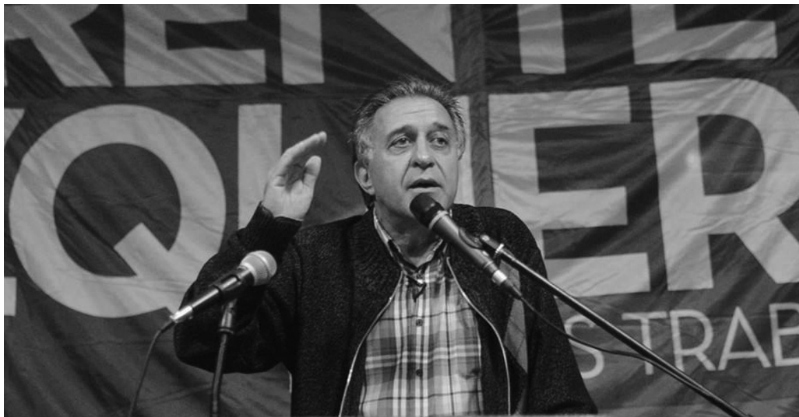
Néstor Pitrola en el acto de La Matanza. Se abre la posibilidad de ingresar en los principales concejos deliberantes de la provincia.

Ya se han realizado las presentaciones de las principales candidaturas en más de cuarenta distritos, y las listas se están constituyendo en 94, con posibilidades de llegar a los cien propuestos. Los