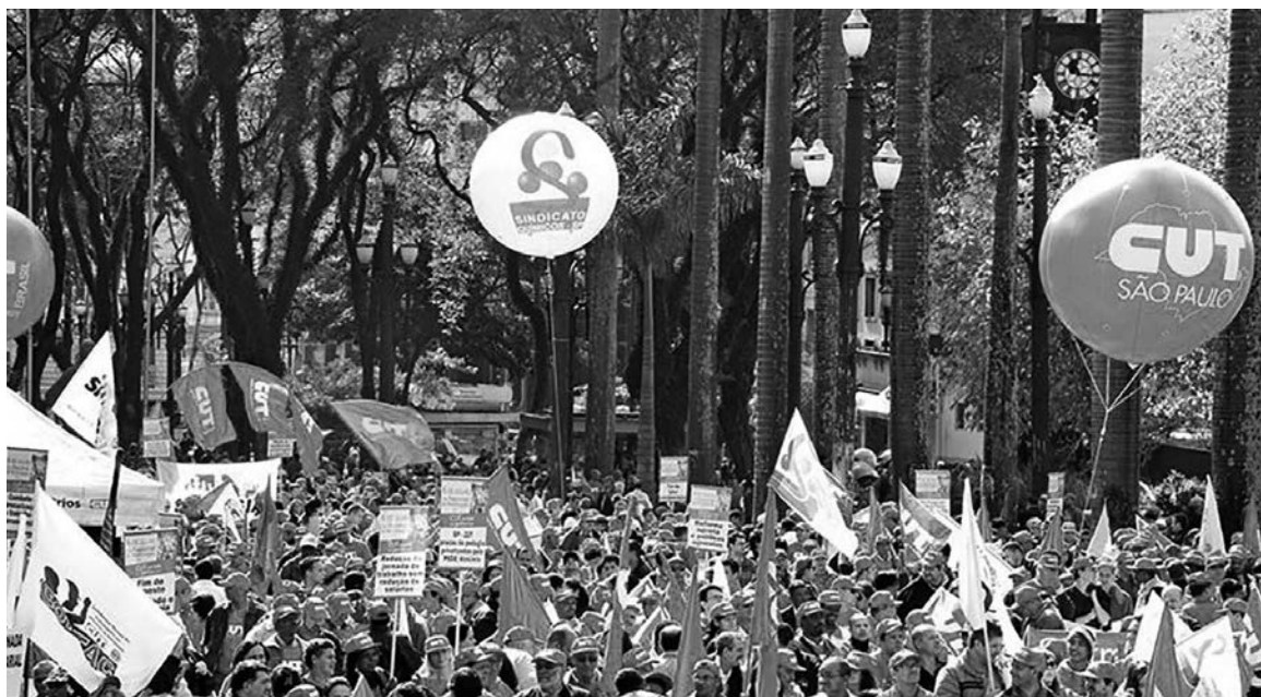
Los trabajadores brasileños enfrentan el ajuste de Levy-Rousseff. El congreso convocado por Conlutas tiene la oportunidad de fijar un programa obrero frente a la crisis capitalista.

En coincidencia con un nuevo aniversario del Cordobazo argentino, la clase obrera brasileña protagonizó una importante segunda jornada nacional de luchas (convocada por la CUT y Conlutas, entre otras centrales sindicales) el 29 de mayo pasado, contra las medidas de ajuste de Levy-Rousseff. La decisión oficial de descargar la crisis capitalista sobre las espaldas de las masas se cristaliza en suspensiones masivas en la industria y en un crecimiento del desempleo, que en el