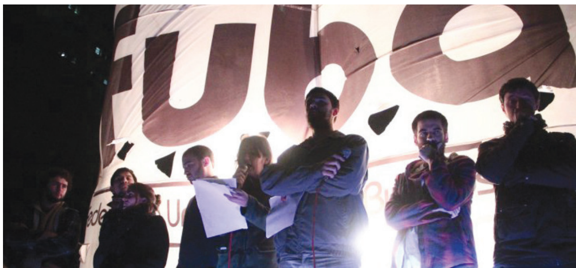
Congreso de la Federación Universitaria de Buenos Aires. Su convocatoria fue un factor de clarificación política y recuento de fuerzas.

La Fuba, junto a la Asociación Gremial Docente, es la oposición estratégica y sistemática a la acción ajustadora del Rectorado. Frente a los carpetazos que evidenciaron una UBA copada por los servicios de inteligencia y la corrupción, la Federación impulsó el apartamiento de los funcionarios involucrados y la formación de una comisión investigadora independiente. Mostramos, además, que no se trata de "dos o tres inadaptados"; la corrupción es consecuencia de la asfixia presupuestaria y la penetración capitalista en la universidad, que adop-