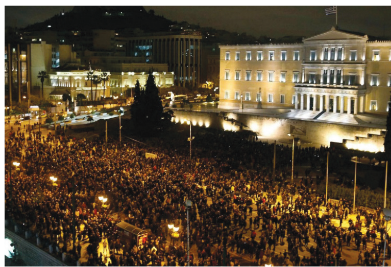
Marcha contra la austeridad en febrero de este año. Un protagonismo mayor de los trabajadores jugará un papel determinante en el desenlace del actual proceso político.

Si fracasa este propósito, se están barajando planes alternativos que podrían consistir en la permanencia de Grecia en la UE, pero con una moneda propia. Esto implicaría un ajuste fenomenal y un enorme golpe al bolsillo popular, pues los salarios y jubilaciones pasarían a cobrarse en esta nueva