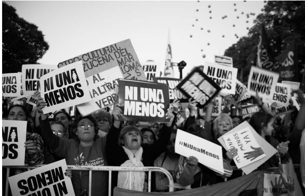
La movilización del 3 de junio. La acción callejera más grande de la historia argentina en defensa de los derechos de las mujeres.

El protagonismo político de la jornada lo tuvieron las organizaciones que vienen batallando desde hace décadas por la igua-