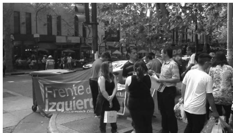
Salimos nuevamente a copar las calles con nuestro programa. Las consignas vacías de los candidatos patronales chocan con la defensa de la Mendoza que trabaja.

El apuro de CFK por rescatar a los Pescarmona, que se beneficiaron con las privatizaciones del Banco Provincia y el de previsión social, contrasta con los miles de desocupados que dejó la Vale, los despídos