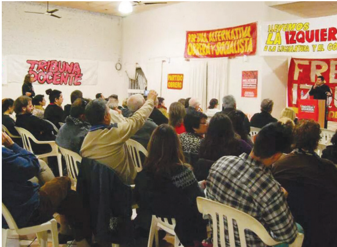
Un sector de la concurrencia del acto en la ciudad de Santa Fe. El Frente de Izquierda es un factor político.