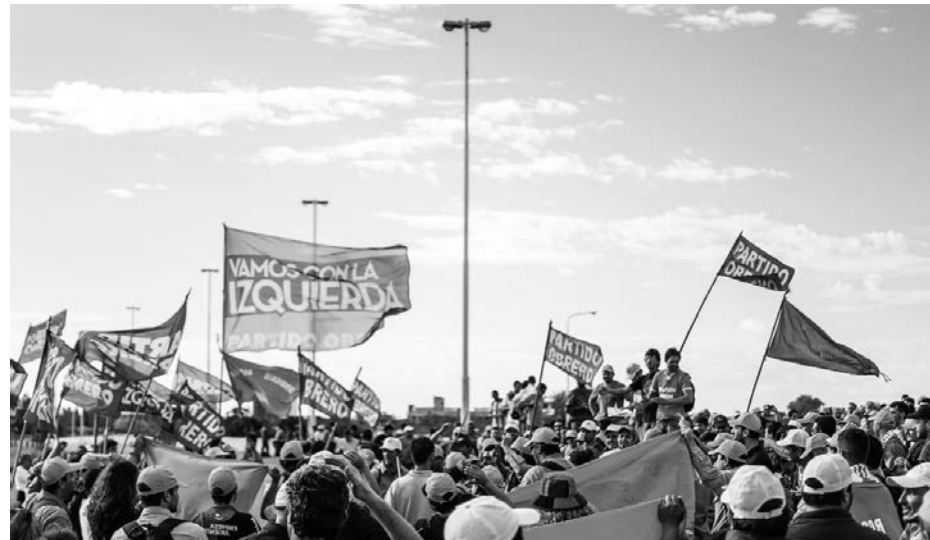
Piquete de los aceiteros. La huelga mostró la tendencia unitaria entre el movimiento obrero y la izquierda.

Scioli duplica en intención de voto a Randazzo, cuya candidatura sólo parece un arma de presión sobre Scioli y los pejetistas. La única incógnita importante es si Cristina Kirchner se anota en las listas de la interna oficial como gobernadora, diputada o parlamentaria del Mercosur. En los dos primeros casos deberá elegir entre uno de sus subordinados, Scioli o Randazzo, salvo que se convierta en prenda de unidad. Es una maniobra arriesgada, porque el tiro podría salir por la culata.