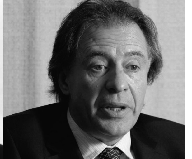
Mauricio Macri y Cristóbal López. El macrismo apunta a reemplazar al kirchnerismo en la sociedad siniestra entre el Estado y el juego que ha montado un gigantesco negocio a costa de la miseria popular.

hombre del PRO, tiene sus fichas colocadas en la expansión de los bingos en la provincia de Buenos Aires.