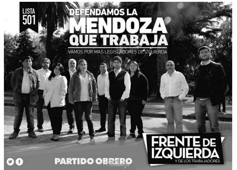
Relanzamos la campaña electoral mendocina del Partido Obrero en el Frente de Izquierda.

Los ganadores de las Paso no logran encolumnar a todos los derrotados de sus espacios detrás de ellos, esto plantea objetivamente una posibilidad de crecimiento electoral para el Frente de Izquierda, sobre todo