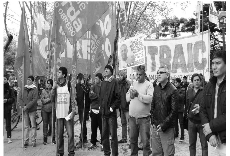
El Sitraic, en estado de alerta y movilización.

Sindicato de Trabajadores de la Industria de la Construcción y afines (Sitraic)