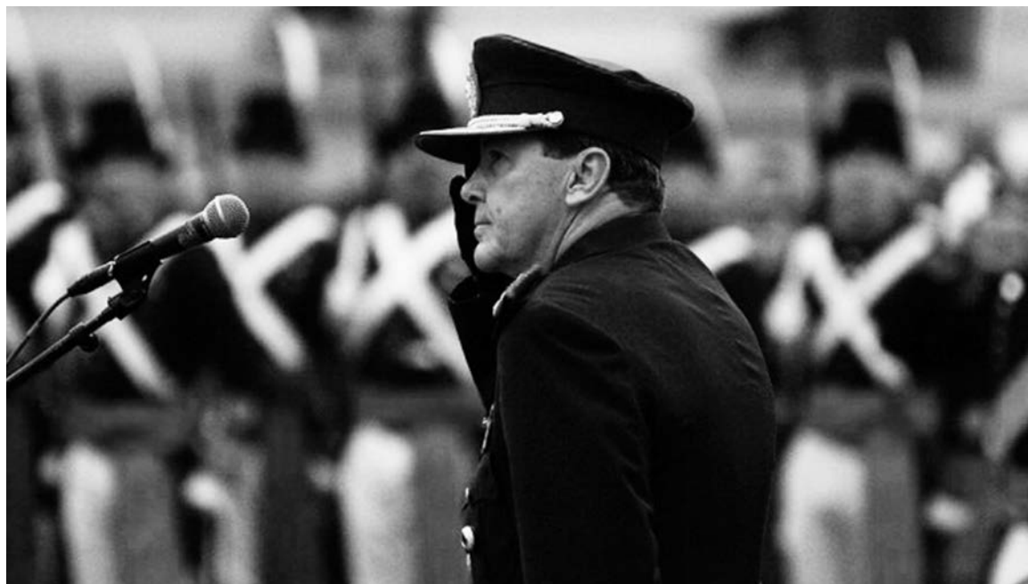
César Milani. Una cuidadosa puesta en escena, cuyo rasgo distintivo fue el protagonismo de las Fuerzas Armadas y de su jefe.

Los juicios a los genocidas, cada día más ralentizados, se producen más de treinta años después de la dictadura y son la cortina de humo sobre el accionar represivo del conjunto de fuerzas a lo largo y ancho del país, con cen-