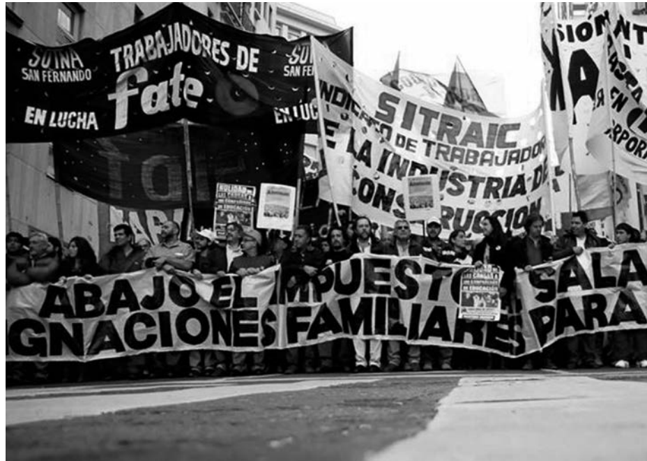
Movilización del plenario del Sutna San Fernando. El kirchnerismo y la oposición tradicional quieren valerse del peso del Estado y de la burocracia sindical para impedir la irrupción de la clase obrera en la crisis.

Cristina Kirchner quiso presentar en la plaza un discurso de "despedida", pero la camarilla oficial ya se ha mimetizado con la liga pejetista que se postula a sucederla -Scioli, Anibal Fernández, Randazzo. Unos días antes de invocar la bandera de la soberanía, los diputados y asesores económicos del kirchnerismo se confundían en Washington con los de Massa y el macrismo, prometiendo el mismo rumbo para después del 10 de diciembre: arreglo con los fondos buitres, aumento de tarifas y devaluación, para abrirle paso a un nuevo reendeudamiento con el capital financiero internacional. Mientras en la tribuna de la Plaza se invocaban los derechos humanos, los actos del 25 subrayaron el protagonismo político que el kirchnerismo le ha devuel-