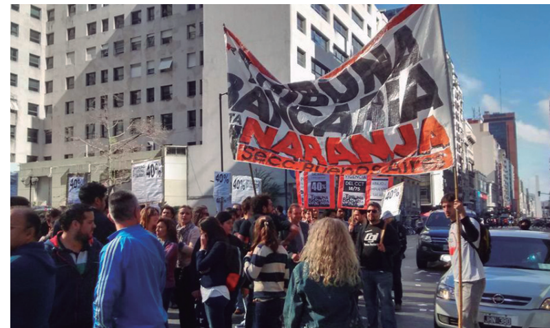
El 12 de mayo los bancarios pararon masivamente. Después de tres meses de paritaria empantanada, no hay un verdadero plan de lucha.

La mayor dificultad que enfrentamos los bancarios para conseguir el aumento es la ausencia de un verdadero plan de lucha, ya que luego de tres meses de paritaria empantanada, nos