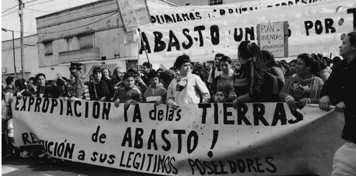
Familias de Abasto. La ocupación de tierras ociosas en La Plata por los sin techo ya es un proceso popular.

Una brutal represión contra 700 familias de un asentamiento en Abasto se llevó adelante el pasado 7 de mayo, a cargo de la Bonaerense de Scioli y su ministro Granados.