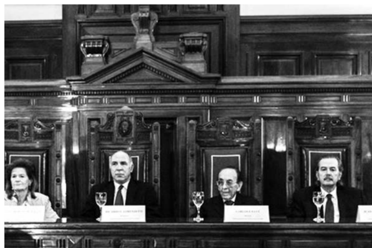
La Corte Suprema. Pelea de camarillas y conspiraciones por el control del Poder Judicial, el garante de última instancia de los intereses generales de la clase capitalista.

Ese rol reservado para la Corte por la Constitución Nacional retrata la incompatibilidad del actual régimen político con un funcionamiento democrático. El "control de constitucionalidad" está en manos de un cuerpo vitalicio al margen de cualquier control popular y colocado por enci-