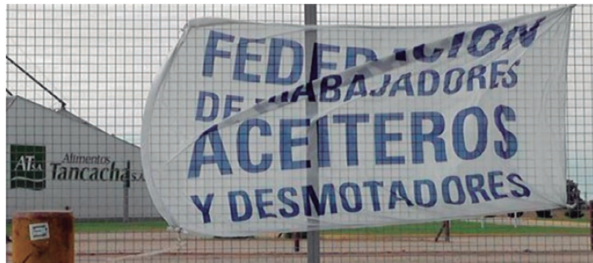
Aceiteros en lucha. Su victoria impulsaría a todo el movimiento obrero a quebrar el techo salarial.

Desde el lunes 4, la Federación Aceitera sigue firme en huelga nacional por tiempo indeterminado. Las sucesivas audiencias en el Ministerio de Trabajo con las patronales aceiteras y Tomada no resolvieron el conflicto. Los aceiteros sostienen a rajatablas el reclamo de un aumento en paritarias de 42% para 2015. De esa forma, el salario de la categoría inferior alcanzará los 14.931 pesos, que es el costo de la canasta familiar de acuerdo con la Universidad Nacional de Rosario. Las cámaras aceiteras ofrecen un aumento de 24%, de acuerdo con el techo salarial del gobierno.