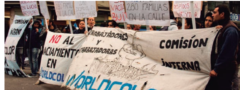
Los obreros de WordColor, contra los despidos y el cierre.

La Bordó -agrupación que orienta el PTS- le sacó el cuerpo a la movilización que acompañó a la au-