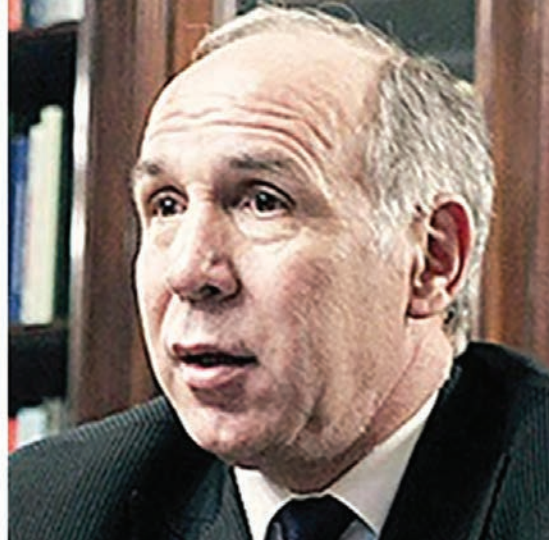
La rebelión de los empleados judiciales enfrenta al gobierno nacional como al tándem Lorenzetti-Piumato.