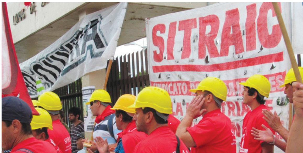
Asamblea del Sitraic. El sindicato combativo de la construcción se consolida en el conurbano bonaerense.