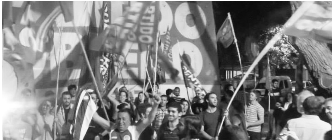
La militancia del Frente de Izquierda de Mendoza festejando los resultados de las PASO.

Un gran campo de acción para el Frente de Izquierda