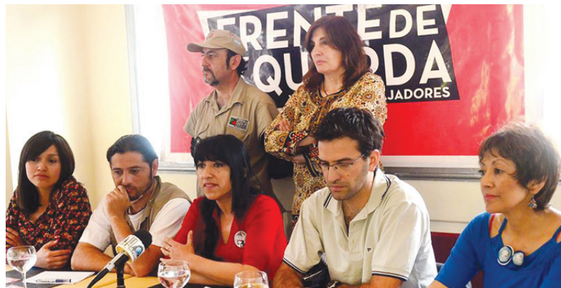
El Frente de Izquierda consiguió 6.000 votos más que en 2011.

mites en el movimiento docente, a pesar de la reciente vuelta de los K a la dirección del sindicato. El recule de la burocracia K ante el paro nacional del 31 de marzo, en el que la oposición y especialmente Tribuna Docente tomaron la iniciativa, es expresión de ello. La campaña desenvuelta en las escuelas por Tribuna ha sido extraordinaria y su trabajo histórico en el gremio ha sido el gran punto de apoyo del PO para su desarrollo.