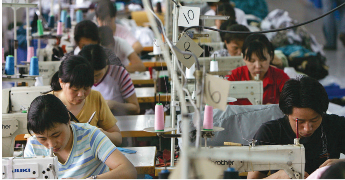
La contracción del mercado mundial pone en la superficie el carácter ficticio de gran parte de la acumulación de capital en China.

En octubre pasado, las autoridades de China anunciaron una "co-