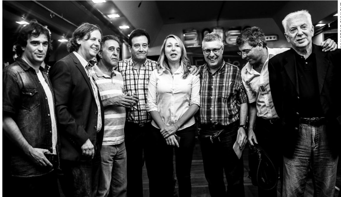
En el bunker del Frente de Izquierda, la noche de la elección de la Ciudad de Buenos Aires.

Las elecciones de la Ciudad y de Neuquén han acentuado el retroceso del kirchnerismo, después de los magros resultados de Mendoza y Santa Fe. En particular, la elección porteña es otro golpe a La Cámpora, cuyo candidato recibió la bendición presidencial y sólo logró el 12% de los votos. Algo similar había pasado con el candidato camporista en Mendoza, semanas atrás. El derrape electoral refuerza la posición del derechista Scioli, cuya candidatura ya no recibe cuestionamientos por parte de ningún miembro de la camarilla presidencial. La bendición a Scioli va de la mano del nuevo reendudamiento usurario (Bonar 24) y, en cierto modo, es su condición: el carísimo socorro financiero que