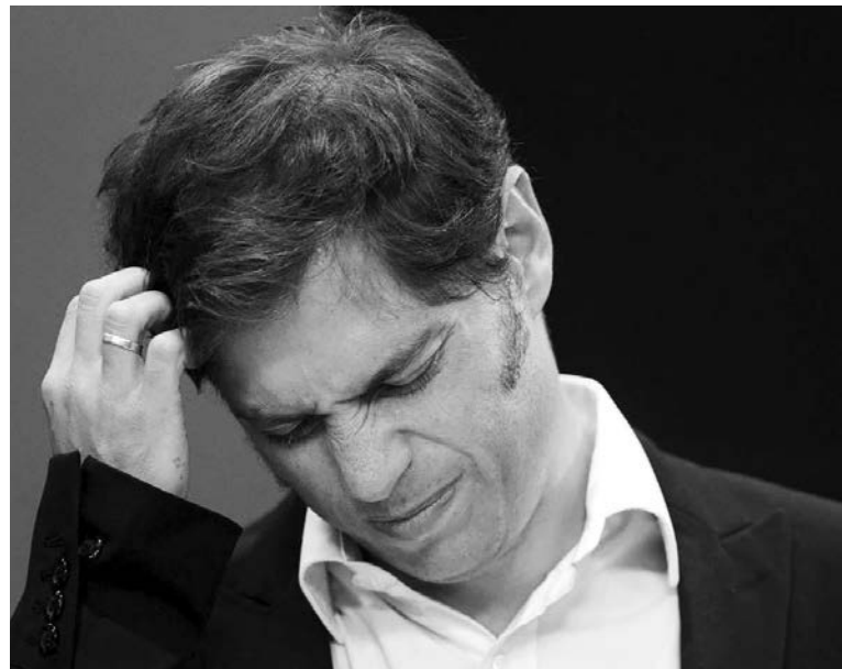
El ministro de Economía Axel Kicillof. El recurso a nueva deuda extranjera para pagar deuda vencida revela la condición colonial de la Argentina K.

La operación ha sido cuestionada, de todos modos, ante el juzgado de Griesa, con el argumento de que cualquier emisión en dólares es deuda externa, sin que importe la jurisdicción en que se haya hecho. YPF hizo una emisión propia, dos días después, ¡bajo legislación norteamericana! El nac&pop 'Kici' resultó ser un alumno aventajado de Martínez de Hoz, quien endeudó a YPF en dólares a cambio de pesos -como ocurre ahora con Galuccio- y la mandó a la quiebra. Pedir dólares para invertir en pesos es del más rancio monetarismo, el pecado capital que los K atribuyen al 'neoliberalismo', y una clara manifestación de sometimiento nacional. En ambos casos, la deuda nueva es para pagar deuda vieja y girar dinero al exterior. La tesis de los fondos buitres no es caprichosa: es la misma que aplicó la Comisión de Valores de Estados Unidos al BNP de Francia, por operaciones en dólares con Irán, a pesar de que respetaban la legislación