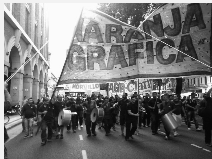
Al cierre de esta edición, casi 450 gráficos de Morvillo, AGR-Clarín, Interpack e Ipsa, convocados por la Lista Naranja, se movilizaron hacia la sede de la Federación Gráfica Bonaerense para reclamar la urgente reunión del plenario de delegados y un plan de lucha en defensa de los puestos de trabajo y por un 40 por ciento de aumento.