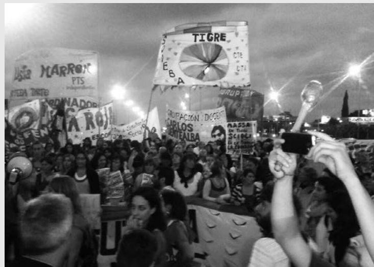
Permanencia, piquete y paro. Los docentes del Suteba Tigre están desarrollando una gran pelea en reclamo de los salarios atrasados.

enfrentar con la mayor unidad los métodos burocráticos y fraudulentos de la actual dirección celeste de nuestro sindicato. Llamamos al conjunto de los afiliados a tomar en sus manos esta tarea, aportando avales, siendo candidatos y fiscales, y difundiendo en las escuelas esta necesidad: que haya un frente único alternativo a la Celeste para que se exprese en estas elecciones la voz de los docentes que repudian