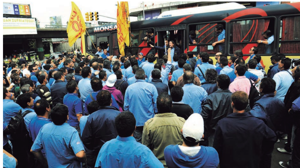
Protesta en la línea 60. El paro nacional mostró el alcance de la inquietud en el movimiento obrero.

El paro nacional mostró el alcance de la inquietud en el movimiento obrero. Como están planteadas las cosas, las reivindicaciones del movimiento obrero deben ser planteadas como parte de un programa de conjunto que prepare la ocupación de las fábricas que cierren, la cuestión del salario en referencia a la canasta familiar y la abolición de ganancias en los salarios de convenio.