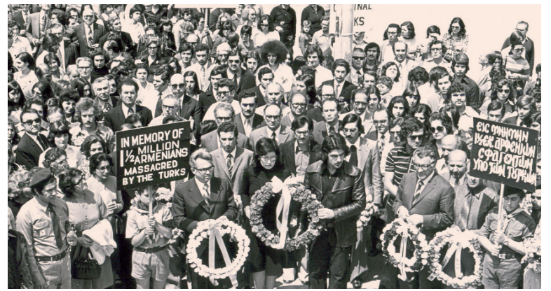
Movilización por el genocidio. Erevan, 1975.

La Rusia de los soviets (1917) renunció a los proyectos imperialistas del gobierno del zar, contenidos en los tratados secretos firmados con los aliados, y los hizo públicos. Lenin se pronunció en favor del derecho de autodeter-