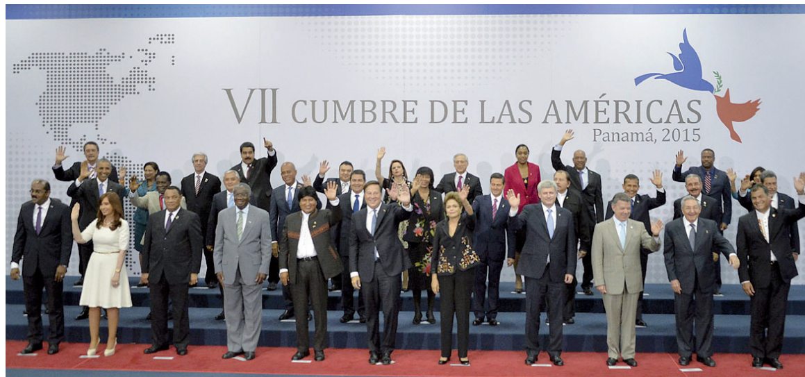
Los presidentes. En un cuadro de crisis y rebeliones, Estados Unidos busca un nuevo punto de apoyo en las burguesías latinoamericanas.

La Cumbre en cuestión forma parte del sistema interamericano, fue una iniciativa en el marco de la OEA. La participación de Cuba en el evento constituye una señal en dirección a su reingreso en la OEA, de la que fuera expulsada en 1962. La participación en la OEA supone la adhesión a sus principios estratégicos, que explícitamente son los principios jurídicos del capitalismo y del estado constitucional basados en el capitalismo. En este marco, la participación en la Cumbre se relaciona directamente con el llamado 'deshielo' entre Estados Unidos y Cuba, que tiene en vista la reanudación de las relaciones diplomáticas y la promesa de una atenuación del bloqueo. Desde que Obama anunciara el fin del bloqueo, hace un par de meses, no se ha avanzado nada por este camino, el cual depende legislativamente del Congreso norteamericano, dominado por los republicanos. De modo que todo este llamado 'deshielo' se encuentra en un verdadero impasse. Cuba se ha sumado a una operación de presión sobre el Congreso, con un resultado incierto, en lugar de poner el levantamiento del bloqueo como condición para los pasos posteriores. La asistencia a Panamá forma parte del nuevo juego de presiones. La incorporación de Cuba a la OEA cambiaría estratégicamente el alcance de un levantamiento o ate-