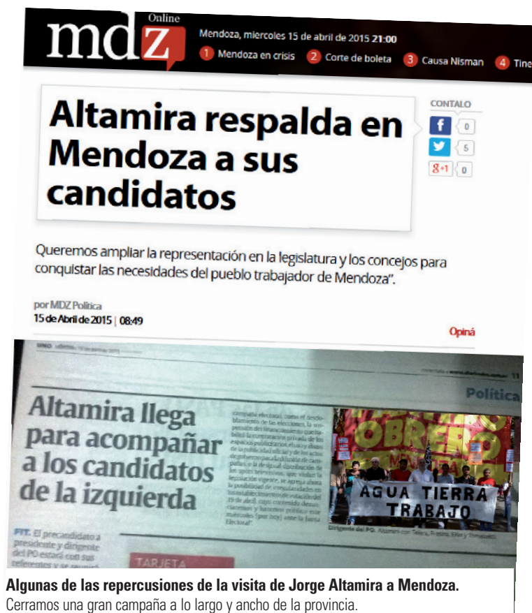
Algunas de las repercusiones de la visita de Jorge Altamira a Mendoza. Cerramos una gran campaña a lo largo y ancho de la provincia.

En Luján, la campaña ha sido simplemente impresionante. Hace algunos días, frente a más de 120 jóvenes, en un debate de candidatos a intendentes, nuestro