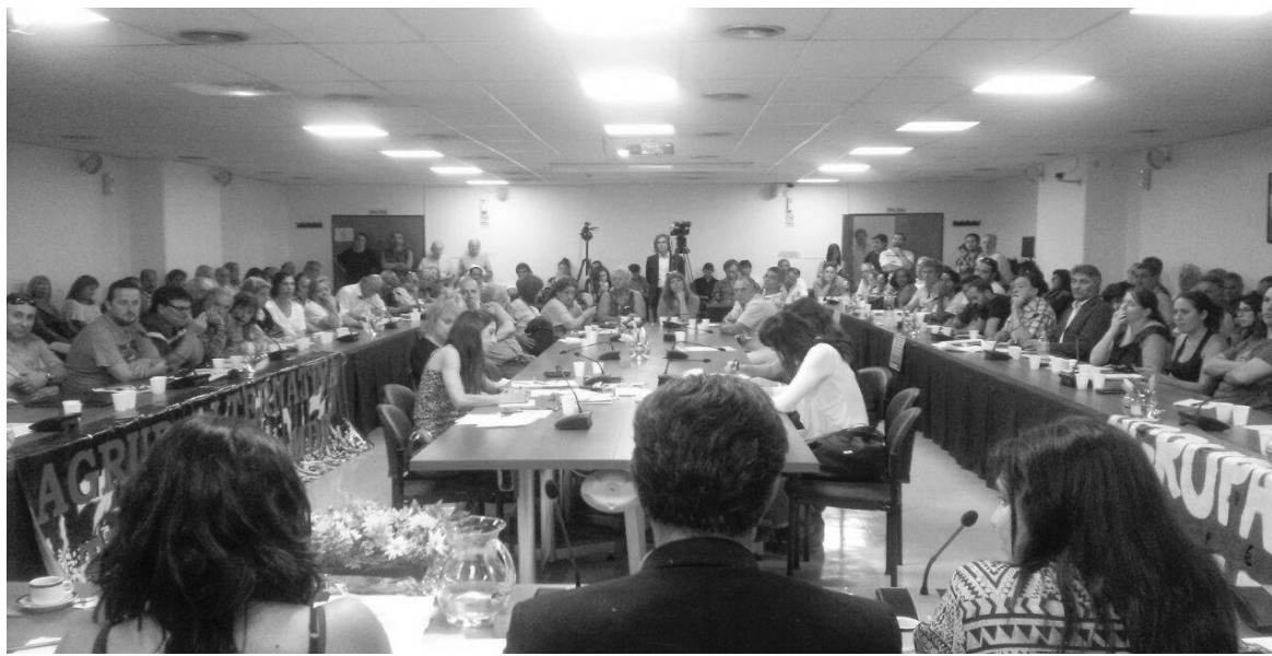
Doscientos trabajadores telefónicos en el Congreso de la Nación. Tenemos que poner en pie "el lobby de los trabajadores".

La audiencia del 19 de marzo superó los 250 participantes, que arrancó con un informe político de Néstor Pitrola y se transformó en una verdadera asamblea obrera. En apenas dos semanas se duplicó la cantidad de diputados que apoyan el proyecto.