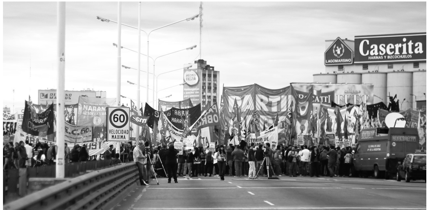
Corte del Puente Pueyrredón durante el paro nacional de abril de 2014. En oposición a la parálisis de la burocracia sindical, un gran plenario obrero en el Sutna San Fernando estableció un programa, piquetes y movilizaciones.

Esta tentativa fracasó: el gobierno no abrió mano del impuesto a las ganancias, y su ministro Kicillof