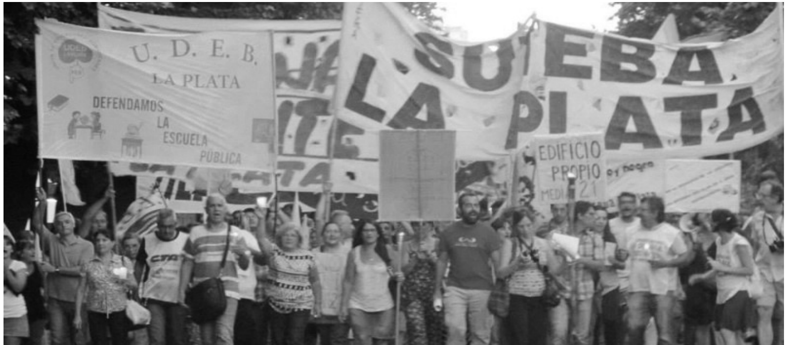
Movilización de los docentes combativos. La huelga docente fue un plebiscito contra el gobierno de Scioli.

El VII Congreso Nacional de Tribuna Docente registró ese panorama al detalle, incluyendo una decisión amplia en las bases de la