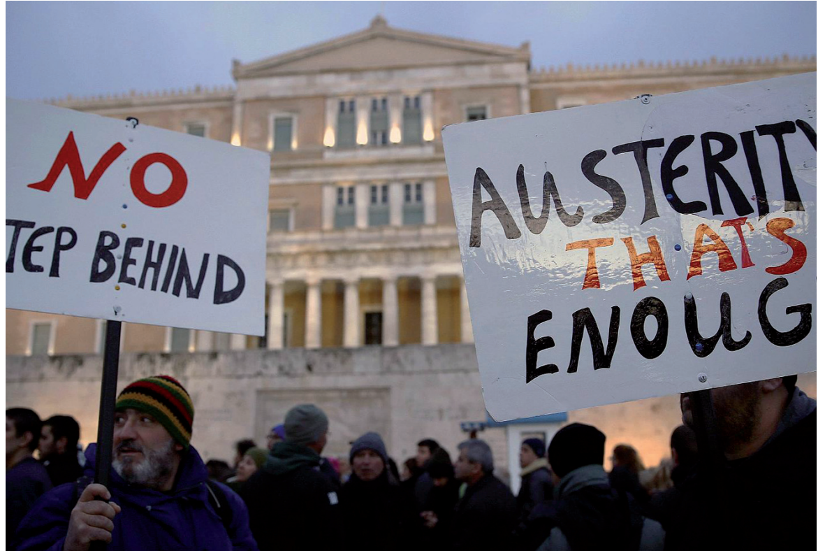
"Ni un paso atrás" y "la austeridad ya es suficiente", carteles en una movilización anterior al acuerdo entre Syriza y la troika.

Las capitulaciones son obligadas, a veces, para conservar posiciones estratégicas que permitan revertir en un futuro lo impuesto por extorsión. Hay numerosos episodios en ese sentido en la historia de las revoluciones. No es el caso de lo que acaba de ocurrir. Alexis Tsipras, flamante primer ministro, saludó el acuerdo como