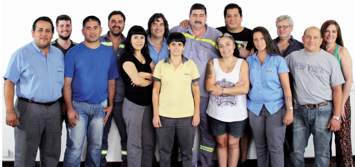
Los candidatos clasistas del subte. La Naranja es la única lista políticamente independiente.

En esta etapa de la campaña jugarán un papel destacado las posiciones específicas de La Naranja, tanto sobre sectores de trabajo, como las cartas de compañeros in-