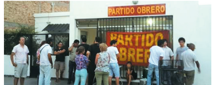
Inauguración del local de Cutral Co.

En el sector estatal, el gobierno se ha valido de la burocracia sindical para cerrar un acuerdo salarial, que no cubre la perspectiva inflacionaria y que no cuenta con una mesa de actualización salarial para mediados de año. Por otro lado, el gobierno no ha logrado contener la emergencia social, fruto de los efectos de la 'chevronización' de la provincia.