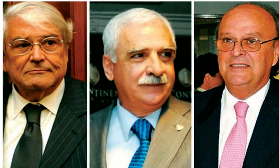
Los jefes de la Unión Industrial, divididos en torno a los acuerdos.

El gobierno está acelerando los trámites para el tratamiento de los acuerdos con China en Diputados, que ya tienen media san-