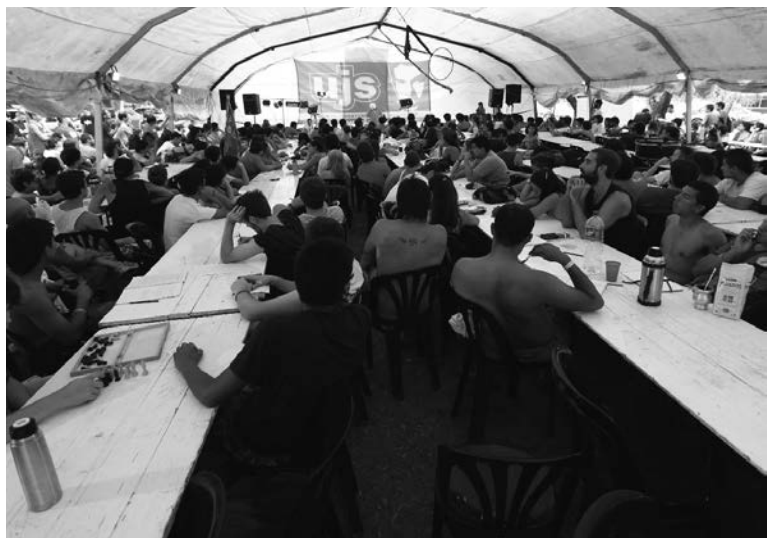
Un extraordinario esfuerzo de organización colectiva.

Más de 1.000 jóvenes, estudiantes y trabajadores, nos dimos cita en el campamento de la UJS, provenientes de la Capital, la provincia de Buenos Aires y Santa Fe. También participaron delegaciones de Chaco, Formosa, Misiones y un grupo de compañeros de la agrupación La Clase de Uruguay. Junto a los compañeros del movimiento estudiantil se destacaron importantes delegaciones sindicales, de telefónicos, gráficos, docentes, y la presencia de los principales dirigentes de la gran lucha de Lear. En paralelo, se realizaron otros campamentos regionales en el sur, el norte y el centro del país.