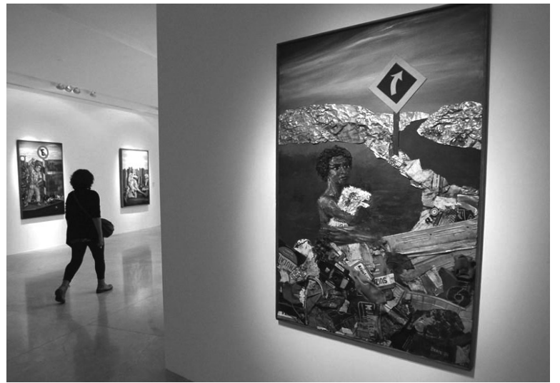
La obra de Berni es una ruptura con el "realismo socialista" estalinista.