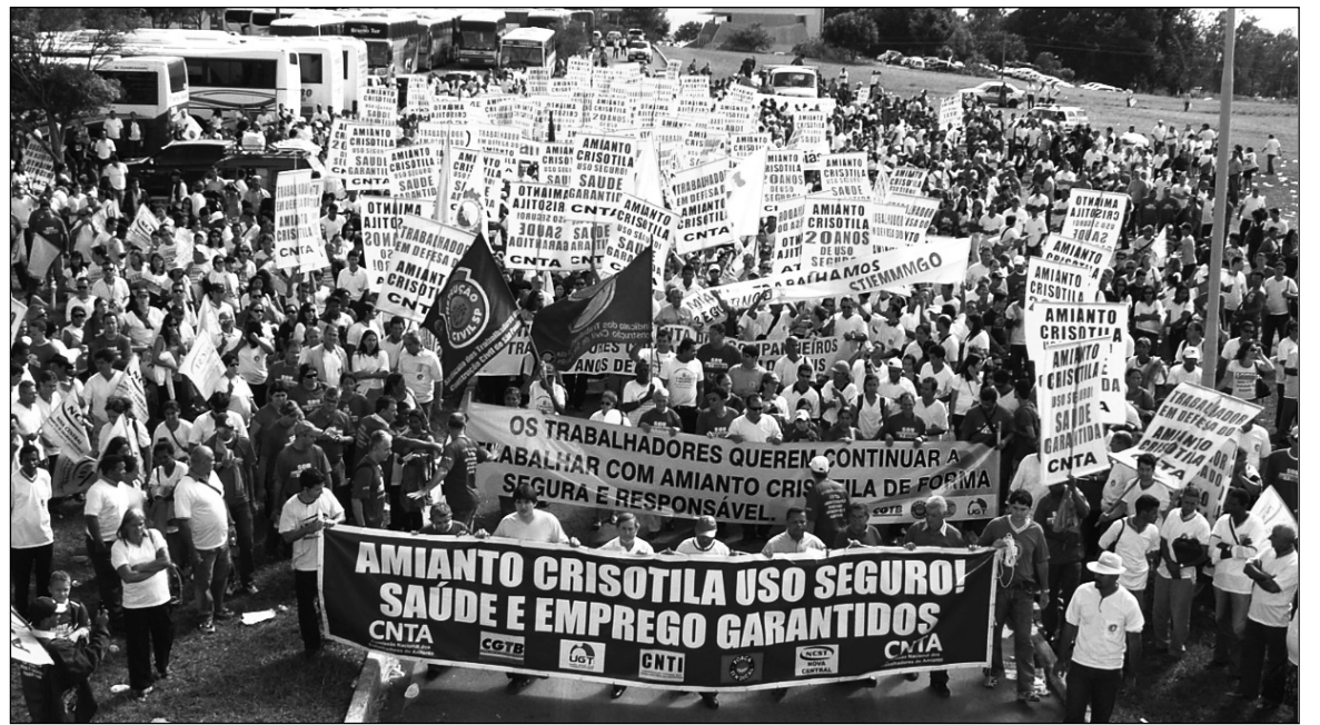
Movilización de trabajadores en defensa de la salud y el empleo. El ajuste ha engendrado una rápida respuesta popular.

"Tenemos fuerza para resistir el oportunismo y el golpismo, incluso cuando se manifiesta de forma disimulada", exhortó Rousseff a la