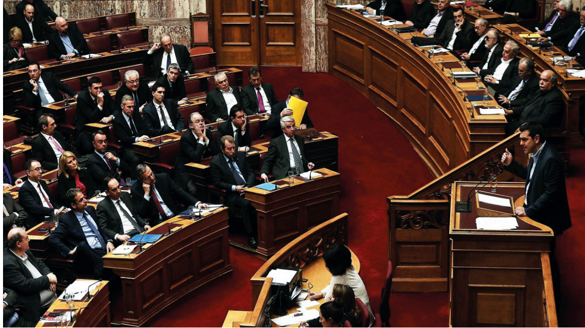
Alexis Tsipras, primer ministro griego, en el parlamento.

Syriza, entre los infinitos cabaldeos que precedieron y siguieron a su victoria histórica, ya había dejado gruesos jirones de su programa. Retiró el planteo de