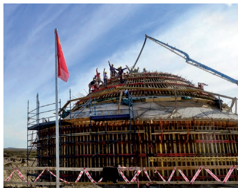
Estación espacial china en construcción en Neuquén.