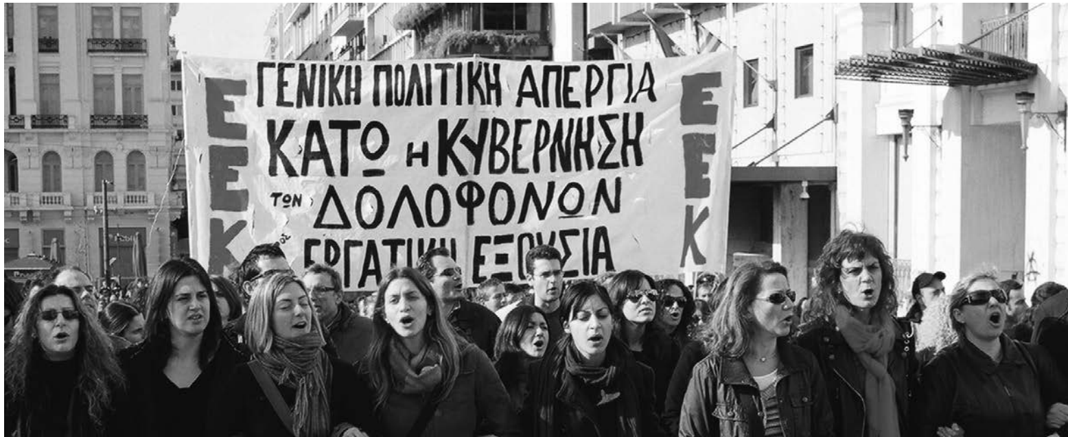
Movilización del Partido Revolucionario de los Trabajadores (EEK) en Atenas.

El 21 de diciembre pasado, se reunió una Conferencia de emergencia del EEK para discutir y definir los términos de su intervención en las elecciones presidenciales del país. A continuación, una síntesis de sus principales conclusiones. El texto completo puede leerse en nuestro sitio en internet.