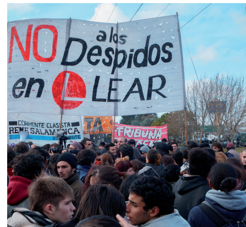
Piquete frente a Lear. La patronal hostiga a los reinstalados e incumple los fallos judiciales.

Ya pasaron más de siete meses del conflicto y el Ministerio de Trabajo jamás se pronunció por la reinstalación ni le exigió a la patronal justificar los despidos. En cambio, el conjunto de las fuerzas represivas del Estado, tanto nacional como provincial, actuaron sistemáticamente contra los trabajadores, defendiendo los intereses de la patronal norteamericana. La burocracia del Smata actuó en la misma línea, justificando los despidos, persiguiendo y destituyendo a los delegados combativos. La lucha por el reconocimiento de los delegados democráticamente electos continúa en la Justicia, en la planta y en el