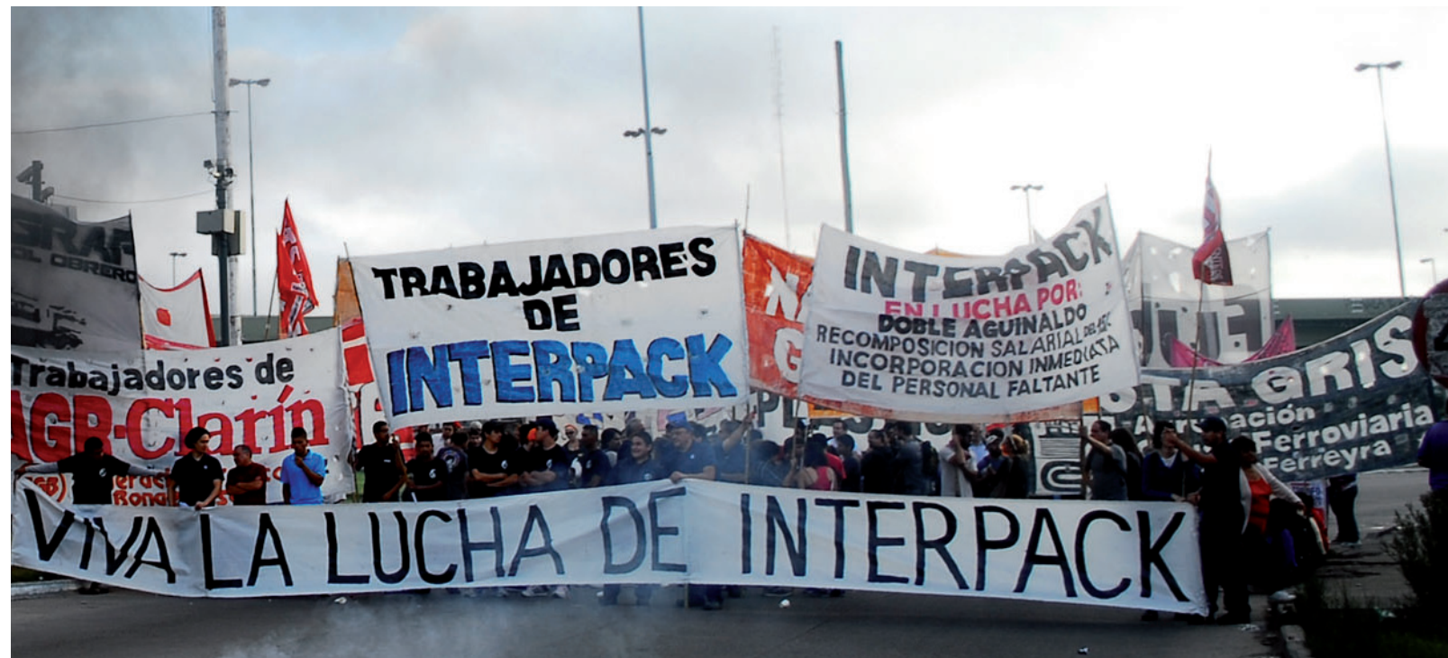
Corte de los trabajadores de Interpack en la rotonda de San Justo. Hace muchos años que no había en el gremio un conflicto tan crudo y extenso.

El conflicto de Interpack es, a esta altura, el más crudo y extenso que haya conocido el gremio en muchos años. Desde la ocupación de esta misma planta en el 2007 no se asiste a una confrontación tan extrema.