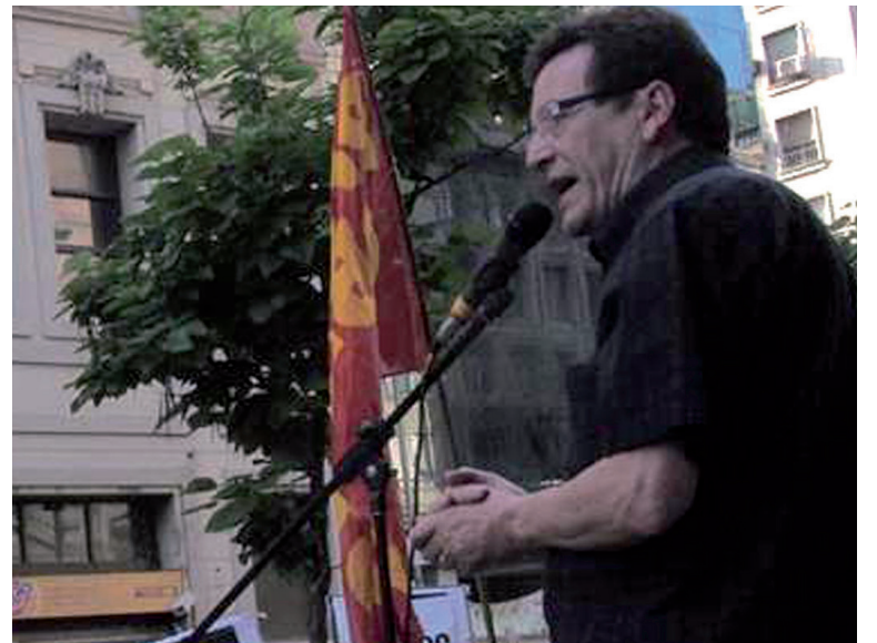
Ramal en el acto de repudio a las amenazas del Pro en la Legislatura

POLÍTICAS >EXCLUSIVO DE INTERNET >WWW.PO.ORG.AR