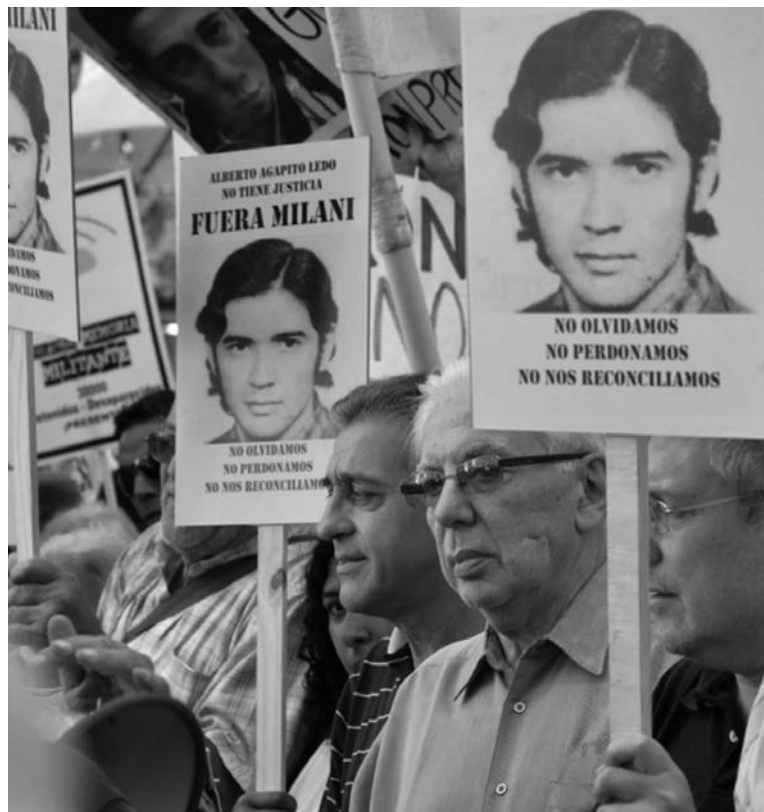
Altamira y Pitrola en marcha por la destitución de Milani.

En todos estos años, las tareas de los servicios kirchneristas se