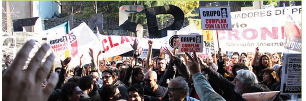
En el plebiscito, la votación en las empresas periodistas fue masiva. El nuevo sindicato de prensa que nace tendrá una enorme tarea por delante.

entender la descomposición de la UTPBA como el de una burocracia inexistente o inservible. La ausencia de la UTPBA en cualquiera de las cinco centrales ha sido criticada como la de una burocracia que no fija posición, pero creer esto es un error. La burocracia ha jugado bajo el kirchnerismo con objetivos propios de preservación de aparato cumpliendo un inestimable papel frente a patronales y opositoras, desorga-