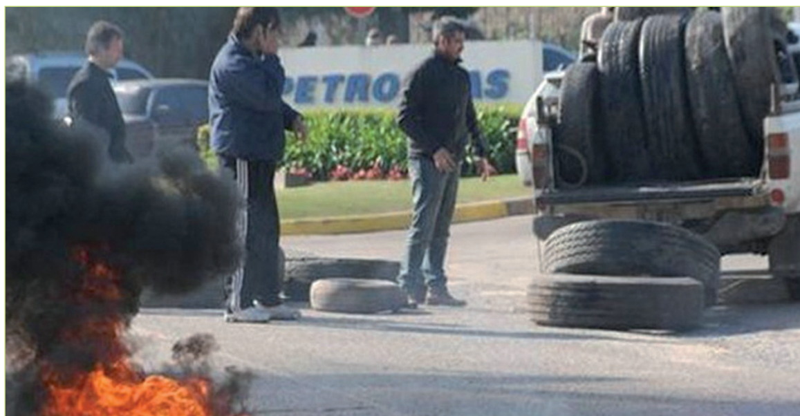
Obreros de TFL en lucha. La acentuación de la crisis y la extensión del conflicto plantea la ocupación general de las plantas químicas.

Los obreros químicos de Zárate y alrededores han forjado una tradición de defensa mancomunada de los compañeros ante despidos masivos. Así ocurrió hace un tiempo cuando los intentaron en Petrobras y otros.