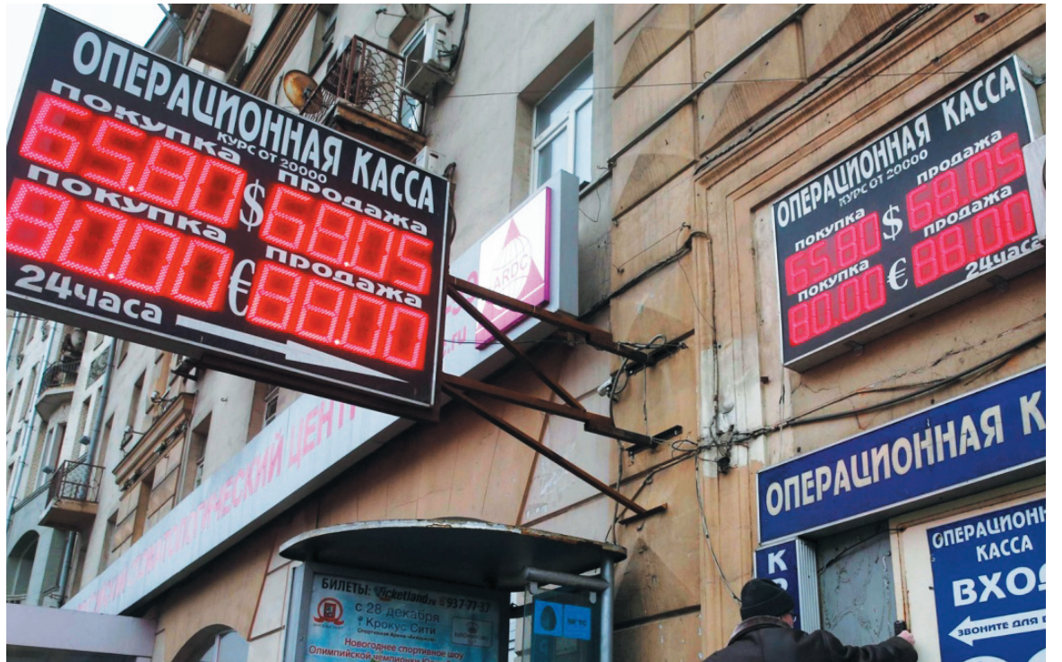
La crisis del capitalismo. Se prevén quiebras, cierres y una mayor concentración de capital, además de las consecuencias políticas y militares.

La caída de los precios no afecta solamente a las compañías petroleras y de servicios tecnológicos, como sería el caso de la norteamericana Conoco, la rusa Rosneft, PDVSA o Petrobras, cuyos costos de producción quedaron por arriba de los precios. Golpean en especial al Tesoro de los países que dependen en exceso de ella -como Nigeria, Venezuela, Brasil, México y, por sobre todo, Rusia. Pero esta afectación es en perspectiva, porque de acuerdo con los contratos que tienen firmados siguen vendiendo al precio elevado anterior del crudo. Si el impacto ha sido de todos modos enorme, ello obedece a que empalma con su vulnerabilidad sistémica: la deuda de las corporaciones de Rusia con el exterior es de alrededor de medio billón de dólares. Rusia ya venía registrando una salida de capitales con anterioridad a la debacle petrolera, debido a las sanciones in-