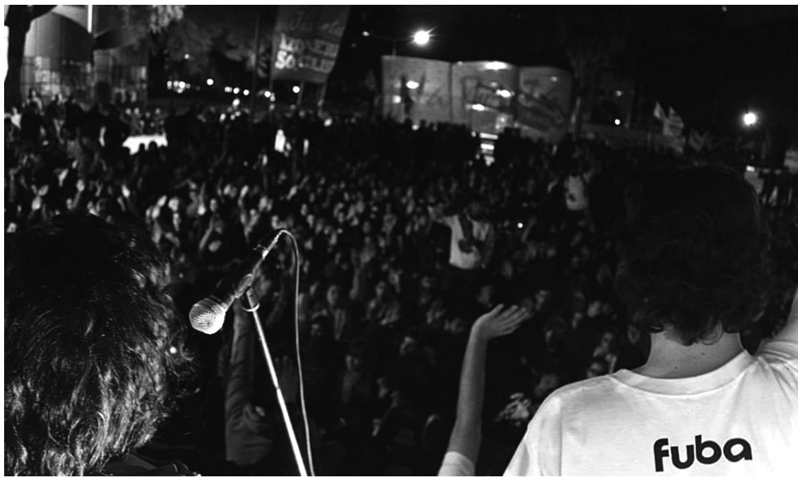
Los K fueron eficientes para reconstruir el régimen de las viejas camarillas y para cooptar a los más oportunistas.

Las elecciones en la UBA dejaron planteado un nuevo escenario en la Fuba. El frente de agrupaciones de izquierda que dirige la federación (UJS, Mella, La Corriente, Izquierda Socialista, Cauce) suma, en distintas coaliciones, la conducción de ocho de los trece centros de estudiantes - una mayoría en la Junta Representativa-. Sin embargo, en términos de delegados al Congreso que vota la presidencia de la Federación y reparte las secretarías de la Junta Ejecutiva, la situación es mucho más pareja. Esto se debe en gran medida al predominio que las agrupaciones cercanas al llamado "Nuevo Espacio" de Económicas (ex Franja Morada) han demostrado en las facultades más numerosas (Económicas, Derecho y Medicina). La Cámpora y las agrupaciones K representan un tercer bloque, más pequeño.