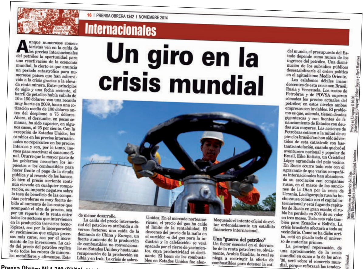
Prensa Obrera N° 1.342 (27/11). El "giro de la crisis mundial" consiste en que ella mutaría hacia la forma de una bancarrota del tipo 1929/30.

La caída de más de 5% en la Bolsa de Shanghai fue gatillada por la introducción de nuevas reglas o parámetros para calificar la solvencia de los bonos corporativos de corto plazo (hasta 182 días); una forma de reconocer que los que se trafican en la actualidad tienen incorporado un riesgo elevado. Apunta a frenar el alto en-