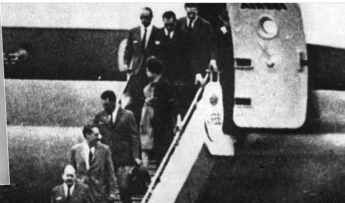
Izq: Folleto de Política Obrera, noviembre de 1964. Der: Perón y su comitiva descendiendo del avión en Río de Janeiro. Ante el Operativo Retorno, Política Obrera caracterizó que "Perón no vuelve": la burguesía y el imperialismo aún no lo necesitaban.

Hace cincuenta años, un 2 de diciembre de 1964 y luego de nueve años de exilio, partía de Madrid Juan Domingo Perón, el llamado Operativo Retorno. Lo acompañaban, entre otros, Augusto Vandor y Andrés Framini, las cabezas de la burocracia sindical. Cuando llegó a Río de Janeiro, el gobierno brasileño impidió la continuidad del viaje y devolvió a Perón a Madrid. En Argentina la movilización política por el retorno estuvo ausente: "no se equivoque, General -le escribía J.W. Cooke, referente de la izquierda peronista, días después. Fueron activistas... no (hubo) actos de movilización popular... Hemos llegado al fondo del drama, ¿Cómo salir ahora de la vía muerta?".