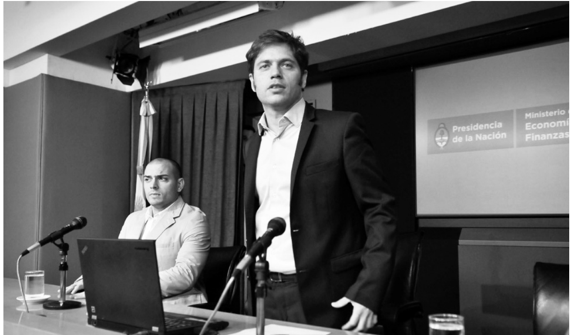
Axel Kicillof anuncia el canje del Boden 2015.

La deuda con vencimiento en 2015 no se limita, sin embargo, al Boden, pero mientras tanto se ha acumulado nueva deuda con los importadores, que debieron reemplazar el crédito interno con el externo. Se la estima en más de 5 mil millones de dólares, a los que habría que agregar deuda con cereaeras que adelantaron dinero, y con las provincias. Macri ha debido postergar su propio canje de deuda de la Ciudad, porque no hay lugar para más de un canje.