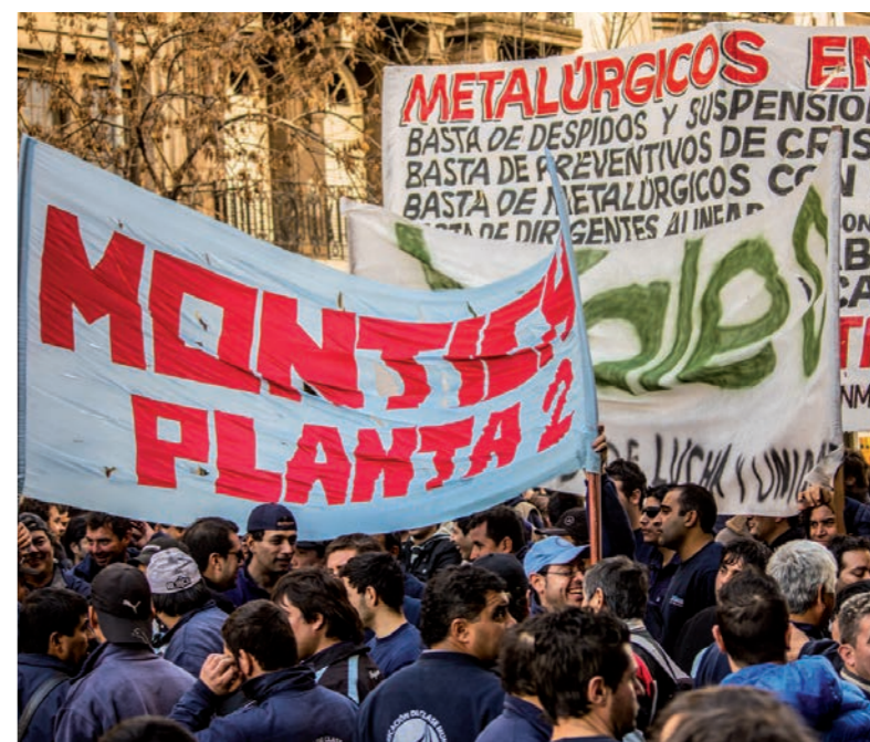
Mobilización UOM Córdoba.