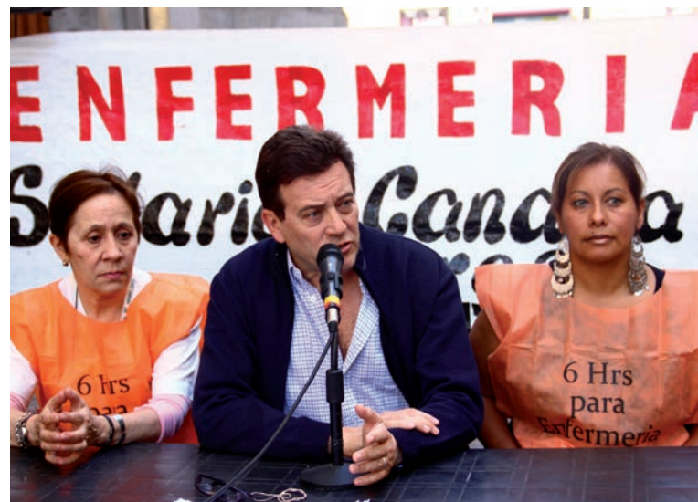
Conferencia de prensa en la Legislatura, llamando al voto del proyecto de seis horas. El triunfo de las seis horas fue el corolario de una movilización política.

Nunca se nos escapó el elemento de manipulación de una iniciativa desarrollada oficialmente por la propia Legislatura, donde la agenda de los trabajadores y vecinos es bloqueada con pactos de todo tipo.