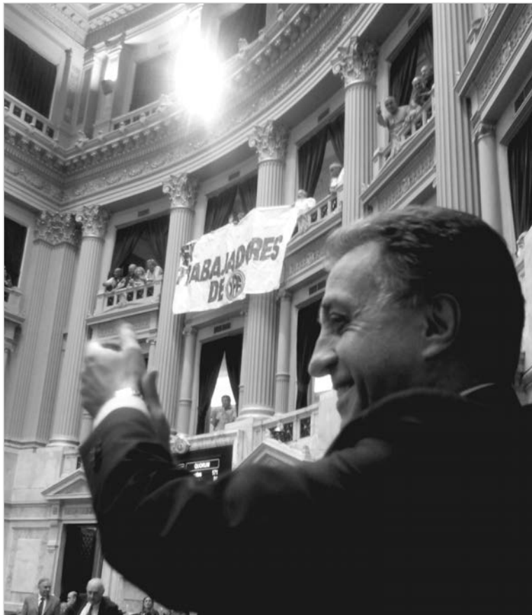
Momento de la votación, festejo de los trabajadores en las gradas

En la batalla por la letra final, se apreció la importancia de nuestro proyecto. El proyecto de Feletti, jefe de la Comisión de Presupuesto y, por lo tanto, "la voz de Kicillof" en el debate, compensaba sólo a los no hubieran recibido nunca importe alguno, que son unos 7.000 afectados; otros 22.000 quedaban afuera. Se adjudicaba un complemento en ¡120 cuotas! sólo a quienes estuvieran jubilados. Entre ese proyecto y lo que se aprobó hay un abismo. Cobrarán todos los afectados 956 acciones a precio de bolsa. Y aquellos que cobraron un importe en