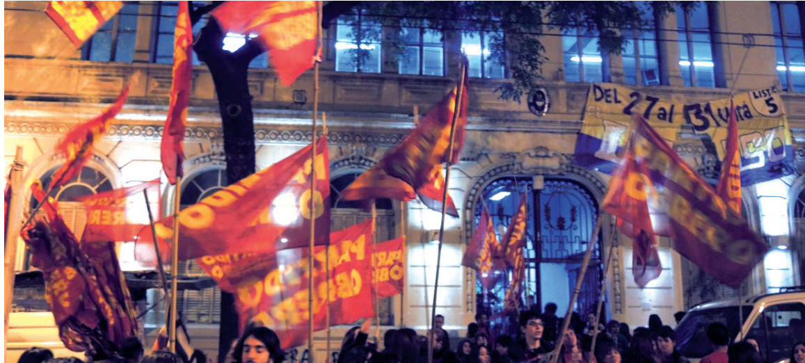
El kirchnerismo apadrinó el ascenso de las camarillas profesoras más derechistas.

En este cuadro político, La Mella, por caso, se jugó en forma desesperada a malograr el ascenso de la izquierda, por medio de coaliciones oportunistas. En Filo y So-