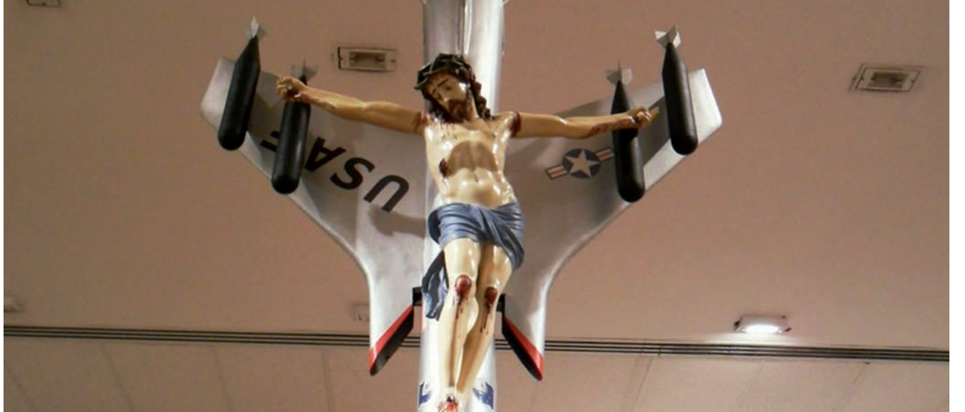
La obra de León Ferrari es una denuncia a la "civilización occidental" y al régimen cristiano.

Exposición de algunas de las obras fundamentales de Ferrari en el Museo de Arte Moderno