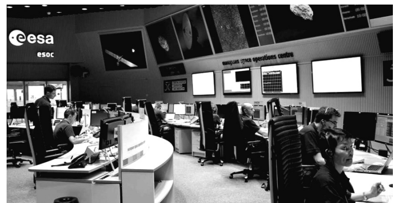
Arianespace es la primera compañía comercial dedicada a la puesta en órbita de vehículos espaciales.

Hay, obviamente, mucho en juego. Por un lado, el negocio de las lanzaderas: Arianespace, fundada en 1980, es la primera compañía comercial dedicada a la puesta en órbita de vehículos espaciales. Es la misma empresa que fue contratada por el gobierno argentino para lanzar el satélite de comunicaciones Arsat I hace un mes. No sólo utiliza las naves Ariane, que le dan su nombre, sino que además incluye las lanzaderas Soyus a través de una subsidiaria en sociedad con las agencias rusas Starsem. Ya en 2004, Arianespace tenía más del 50% del mercado mundial, con más de 240 contratos. A principios de 2014, Arianespace debió pedir subsidios especiales a los gobiernos europeos para reducir sus precios y enfrentar la creciente presión ejercida por su competidora americana, SpaceX, propiedad de