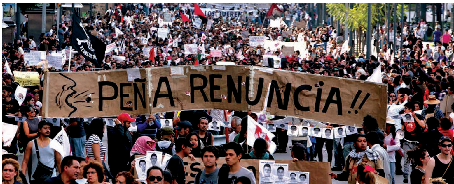
La movilización por los 43 estudiantes desaparecidos destapa otros crímenes y masacres hasta ahora ignorados.

La iniciativa de un paro nacional para el 20 de noviembre lanzada por los familiares de los estudiantes desaparecidos de Ayotzinapa, ha sido recogida por numerosas organizaciones, en un marco de radicalización de la movilización que se extiende por el país. Han habido tomas de cabinas de peaje, bloqueos al aeropuerto de Acapulco, nuevos ataques contra el Palacio de Gobierno en Chilpancingo, el incendio de un local del PRI. Acompañados por estudiantes de Ayotzinapa, los familiares han iniciado una caravana que recorrerá todo el país. Las protestas son multitudinarias y el movimiento estudiantil no se deja amedrentar: los estudiantes de la Unam montaron barricadas y se enfrentaron a las fuerzas policiales para impedir la violación de la autonomía universitaria, luego de que dos agentes ingresaran a las instalaciones y balearan a un alumno. Una asam-