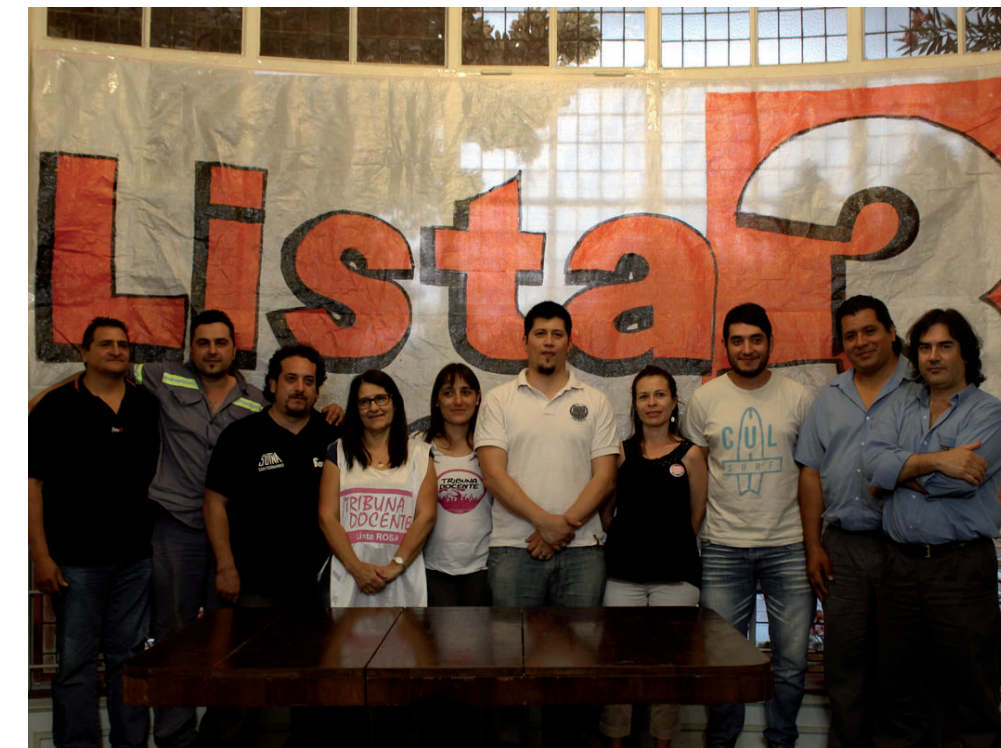
La Lista 3, la lista de la izquierda y el clasismo.

"Siempre que el gobierno sale con un discurso contra los trabajadores, está Yasky aplaudiendo".