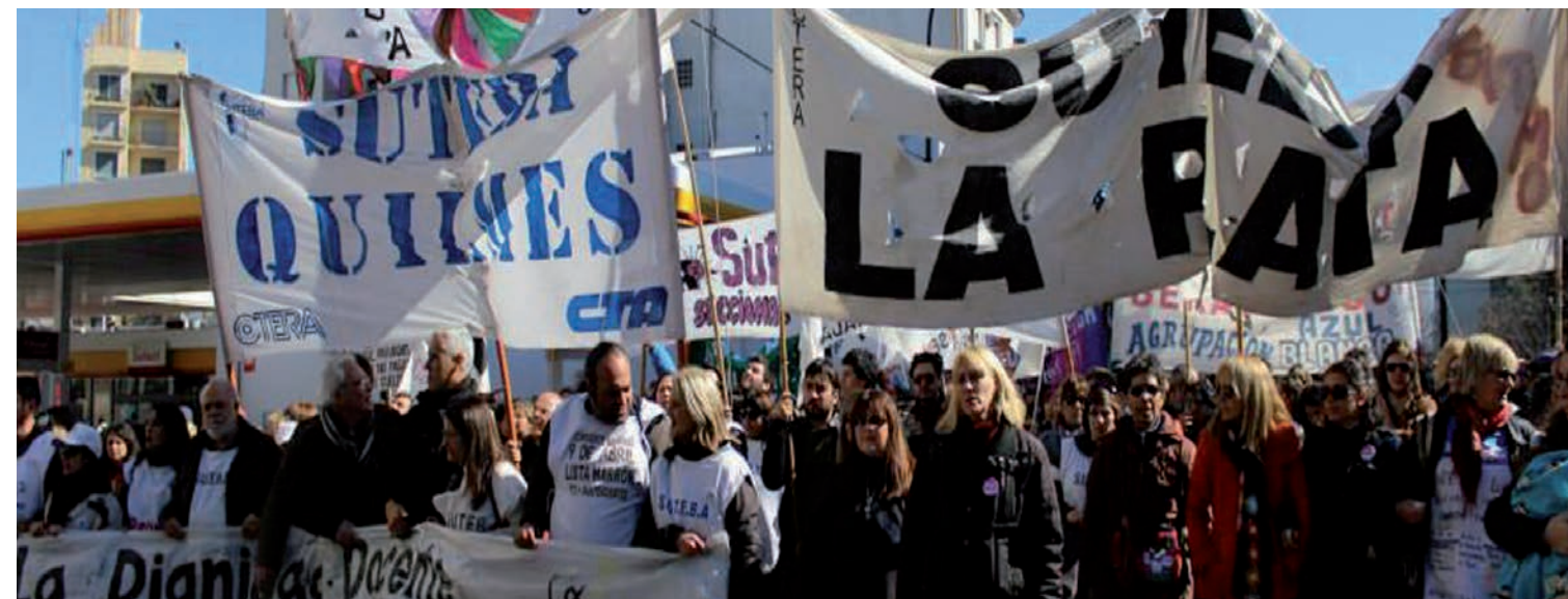
Movilización de los Suteba combativos. La bronca docente rompió la parálisis de la burocracia sindical.

El deterioro salarial por la inflación, que supera los 12 puntos al mes de septiembre respecto de lo pactado por la burocracia del Suteba a comienzos de año, está en el centro de este gran paro. El otro combustible es el hachazo a los ingresos que caracteriza a toda la burocracia sindical docente. La FEB sostiene la parálisis o las medidas aisladas del Suteba, pero actúa en rescate de la burocracia celeste en retroceso.