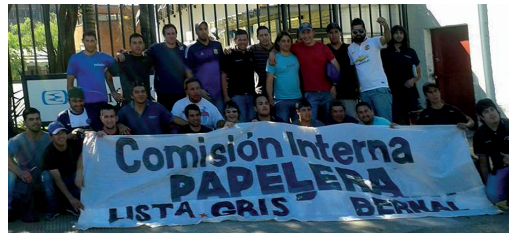
Los Papeleros Combativos de Smurfit. Su gran triunfo es un mandato para dar pelea por una nueva dirección en el gremio.

Las antiguas instalaciones de Celulosa Argentina en la ciudad de Bernal, en los años '80, pasaron por diferentes administraciones, desde el Citibank hasta varias firmas papeleras para, finalmente, a mediados de los '90, dividirse la gigantesca planta entre las multinacionales Kimberly-Clark y Smurfit-Kappa. La primera dedicada al papel tissue y la otra al papel para embalaje. El gremio papelerero en la última década viene atravesando una situación crítica por los numerosos cierres de fábricas importantes -como Massuh, Witcel, Serenity, Azuleña, Puerto Piray y Andino- y la constante zozobra en las más pequeñas.