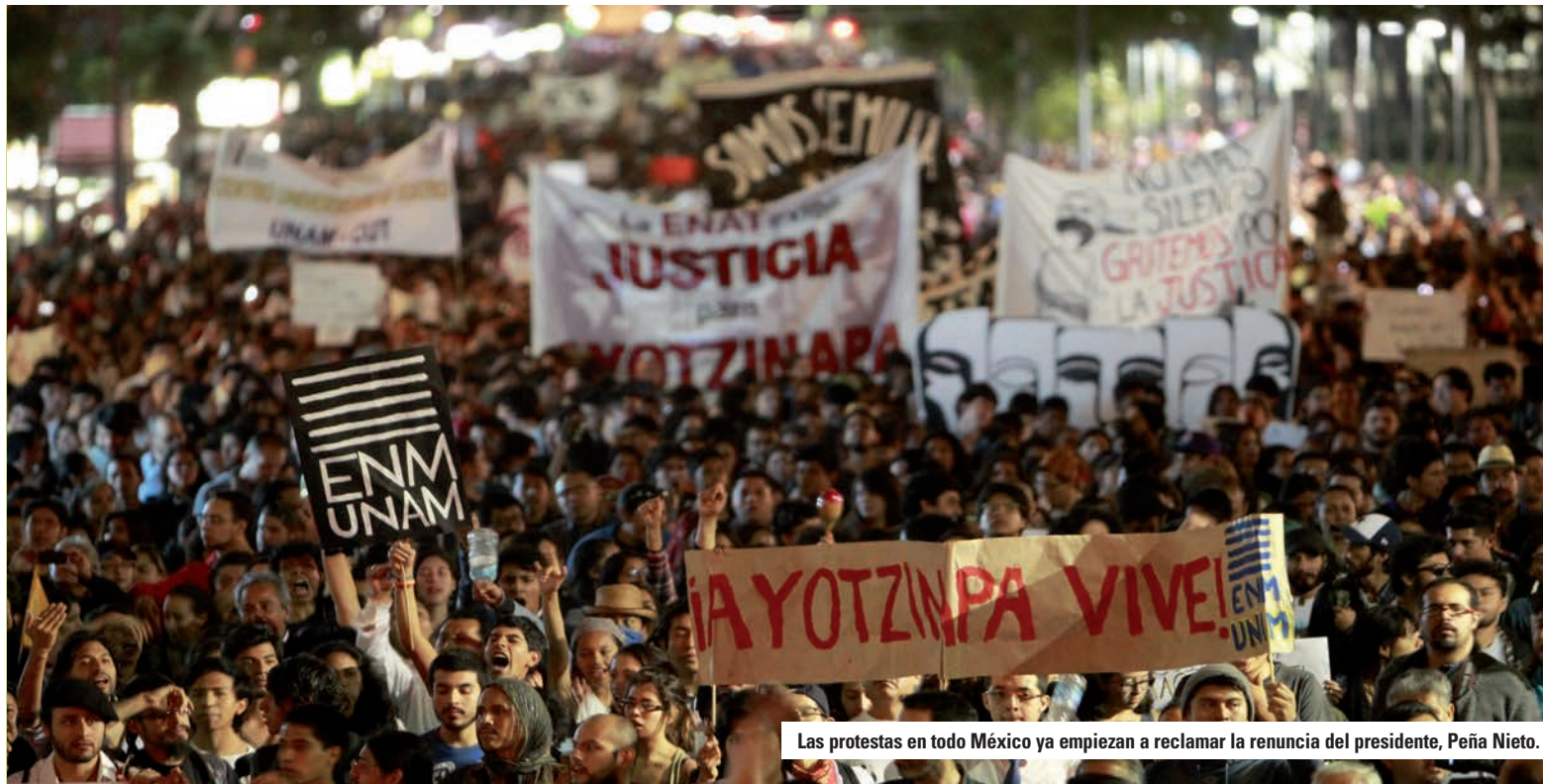
Las protestas en todo México ya empiezan a reclamar la renuncia del presidente, Peña Nieto.

El informe aparece en el preciso momento en que las protestas empiezan a reclamar la renuncia del presidente Peña Nieto y casi en simultáneo con una nueva jor-