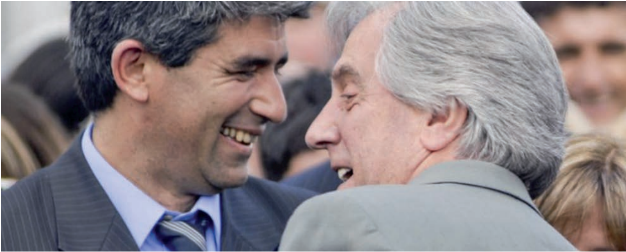
Tabaré Vázquez festeja junto a su compañero de fórmula Raúl Sendic.

El Frente Amplio está en mejores condiciones que cualquier otro para aplicar el programa del FMI.