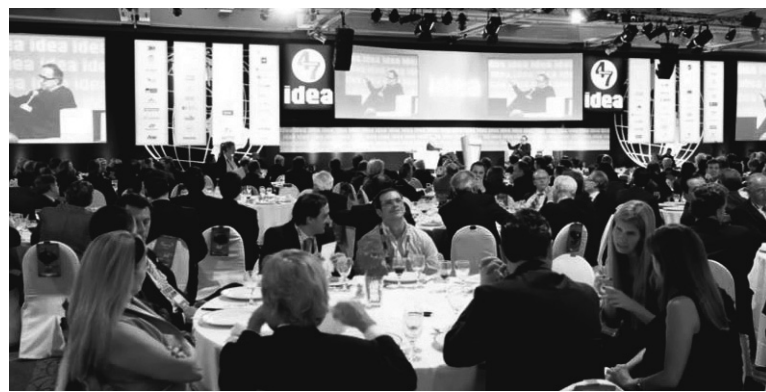
50° Coloquio de Idea, en la ciudad de Mar del Plata. El objetivo de los capitalistas es que el gobierno llegue al final de su mandato y haga el trabajo sucio.

Las disidencias entre los capitalistas se eliminaron cuando fueron consultados sobre qué medida debe tomarse ante el agravamiento de la crisis económica. La respuesta unánime fue arreglar con los fondos buitres, para por esta vía volver a obtener financiamiento in-