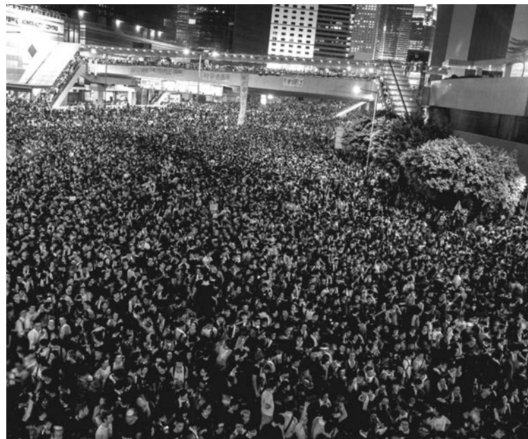
Continúan las manifestaciones en Hong Kong. Las protestas coinciden con el desarrollo de huelgas obreras en todos los sectores del país.

Aunque un profesor hongkonés observa que "la clase trabajadora, en su mayoría, es incapaz de sentirse identificada con unas propuestas que sólo tratan la superficie del problema, el proceso electoral" ( El País , 3/10), existe, de todos modos, una participación obrera. La Confederación de Sindicatos de Hong Kong (HKCTU), un sindicato independiente, declaró que "no podemos permitir que los estudiantes luchen solos" ( Europe Solidaire , 29/9) y convocó a un paro de emergencia para repudiar la represión gubernamental,