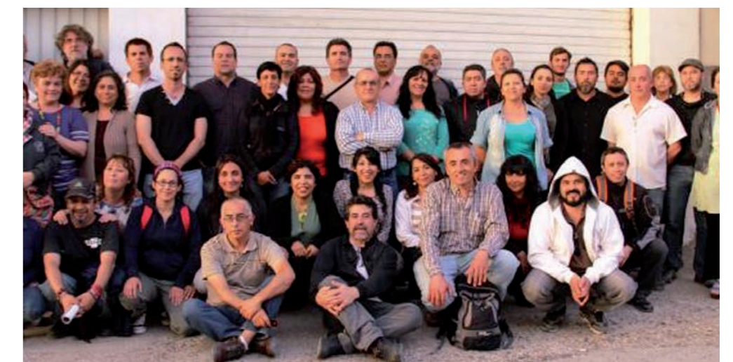
Se juega mucho: Aten fue un gran factor de unificación y de impulso a las luchas del movimiento obrero neuquino.

El kirchnerismo ha apelado a las mayores manipulaciones políticas para reconquistar el sindicato.