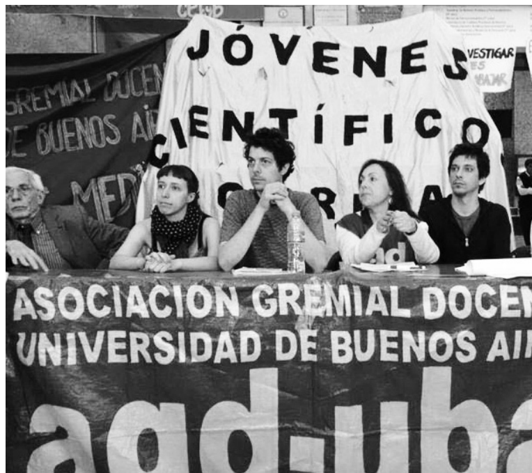
La AGD-UBA y Jóvenes Científicos precarizados, junto a los becarios.

Desde un primer momento el movimiento se nucleó junto a Jó-