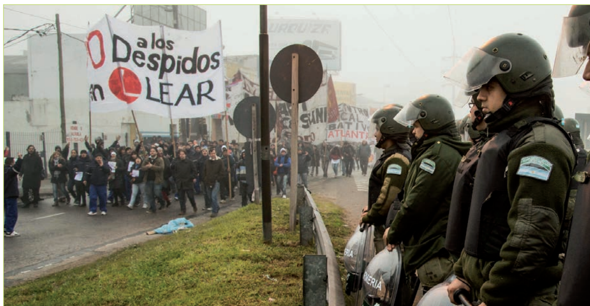
La Gendarmería frente a los obreros de Lear. El propósito de la reforma del Código Procesal Penal no se limita a garantizar la impunidad de la camarilla oficial, sino que incluye un ataque a las libertades democráticas y otras disposiciones represivas.

La reforma del Código Procesal Penal se inscribe en la batalla de fondo que el gobierno libra en el frente judicial. Se ha publicitado largamente su propósito de garantizar la impunidad de la camarilla oficial, agobiada por denuncias de corrupción. Pero no ocurrió lo mismo con sus ataques a las libertades democráticas, en la línea de las leyes antiterroristas y otras disposiciones represivas que la oposición, de un modo general, apoya.