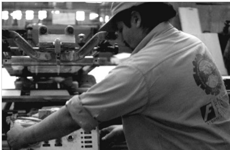
Obrero de Fasinpat, ex Zanón. En la sociedad capitalista, las "fábricas sin patrones" no suprimen la explotación colectiva del capital.

tea el peligro de separar a sus trabajadores del conjunto del movimiento obrero, en primer lugar porque sus reclamos son diferentes y hasta podrían ser antagónicos (aumento de precios para los productos autogestionados). No han acompañado, en casos notorios, varias huelgas generales rr-