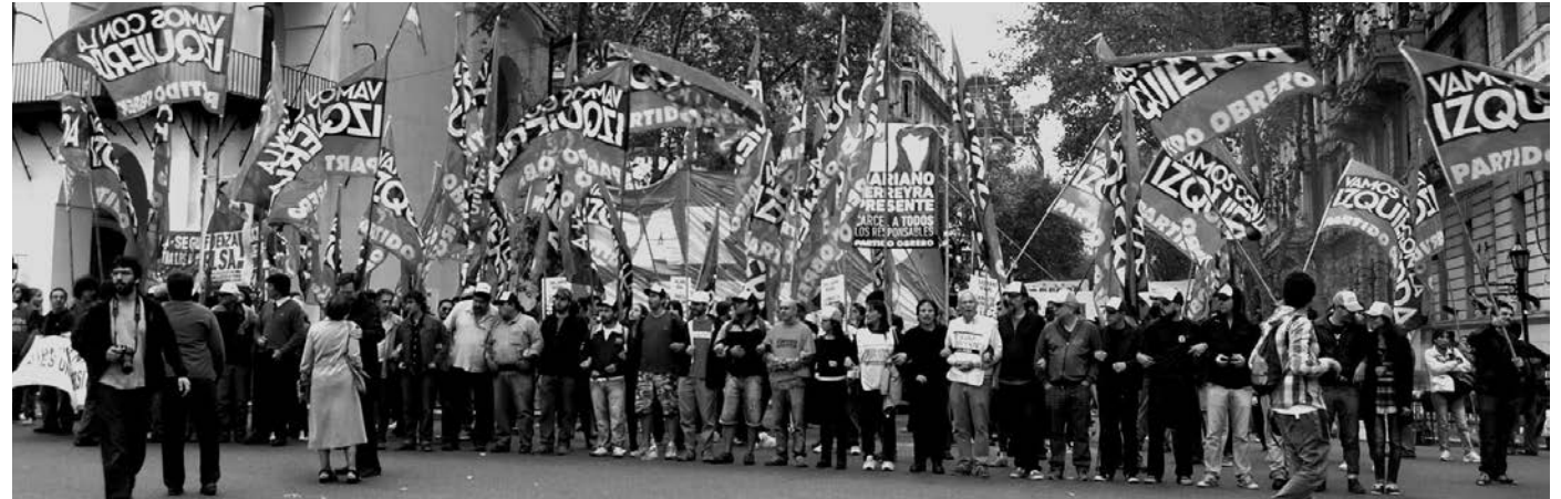
En las vísperas del Congreso del movimiento obrero y la izquierda.

Este es el marco de la crisis industrial, que ha provocado un derrumbe