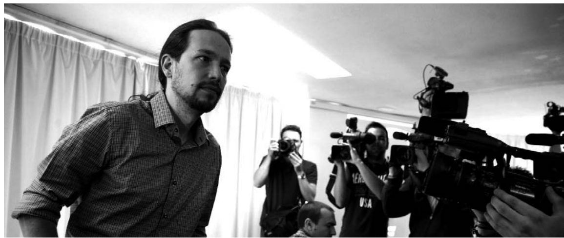
Pablo Iglesias, líder de Podemos. El estrellato mediático tiene límites políticos muy precisos.

Otro fenómeno, si se puede llamar así, es el del italiano Beppe