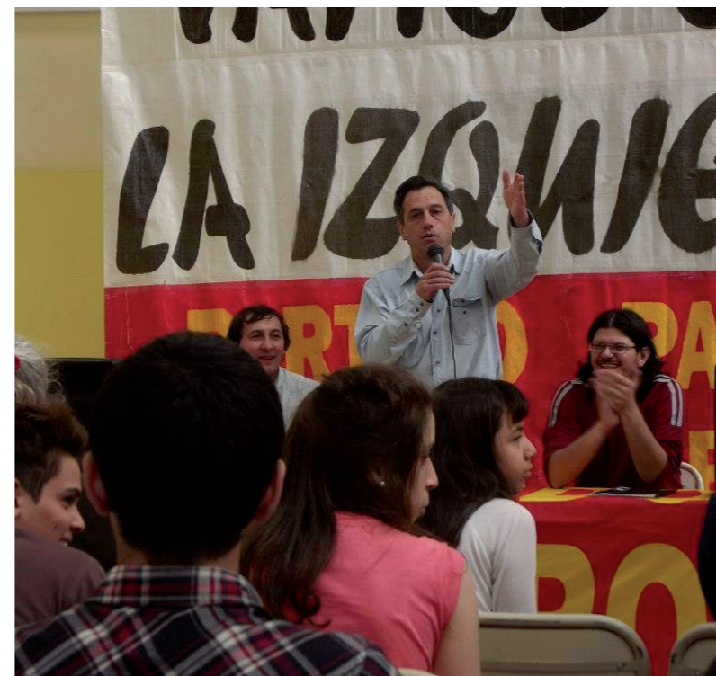
La Coordinadora del norte de Santa Cruz tiene una fortísima representación obrera.

Entre los días 11 y 12 de octubre se desarrollaron sendas asambleas en Las Heras y Caleta Olivia.