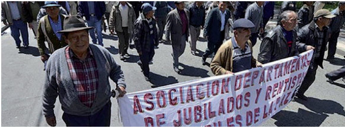
Movilización de jubilados por un bono de aumento, septiembre de 2014.

El éxito de la 'redistribución' es episódico, porque no cambia las relaciones de propiedad. El gobierno admite que no avanza la industrialización. El sectarismo vacío de la izquierda "antielectoral". La burocracia conservadora. Las grandes utilidades de empresarios y banqueros.