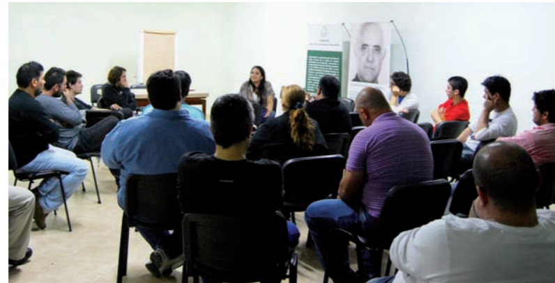
El Estado santafesino es el primer empleador en negro de la provincia.

En el cordón industrial del sur de Santa Fe se formó una mesa regional con importantes referentes gremiales de la zona. La mesa abordó los problemas políticos del movimiento obrero. Sobre esta base, elaboró una declaración para debatir con importantes luchadores y activistas gremiales.