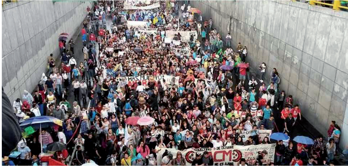
El reclamo de aparición con vida de los estudiantes desaparecidos se convierte en una enorme causa popular.

Los estudiantes del combativo liceo habían arribado a fines de septiembre a la ciudad de Iguala, en el departamento de Guerrero, con el propósito de recaudar fondos para participar de la movilización del 2 de octubre en el Distrito Federal, donde se conmemora y aún se exige justicia por la masacre de Tlatelolco contra cientos de estudiantes en la Plaza de las Tres Culturas, en 1968. Como represalia por intentar protestar en un acto político promovido por el intendente, los estudiantes fueron atacados -en un operativo concertado de la policía y un cartel del narcotráfico- con disparos de ametralladora, dejando como saldo tres jóvenes muertos. El resto fue secuestrado y torturado y, aparentemente, fueron rematados en los montes próximos a Iguala y enterrados en fosas comunes.