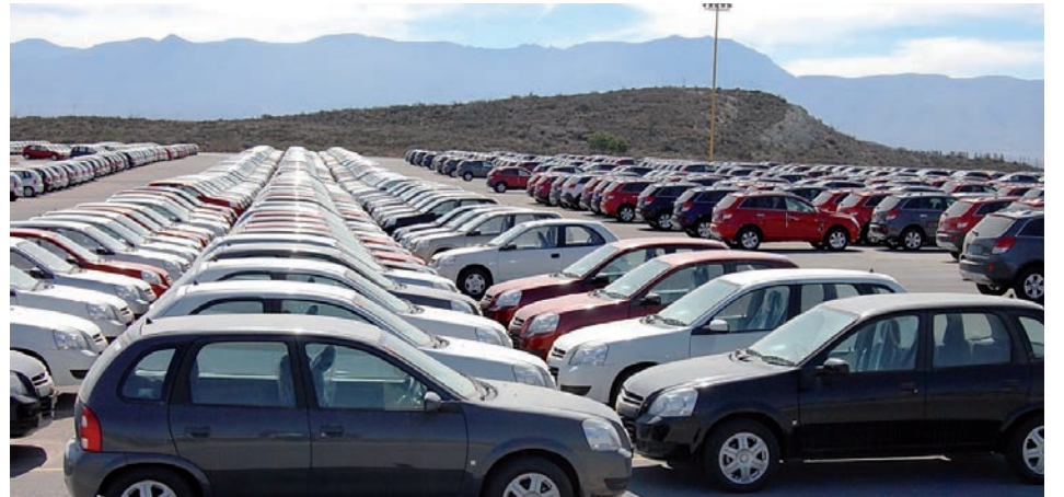
Stock auto retenidos para especular. El "modelo productivo" es un mecanismo de formación de deuda en divisas.

La crisis automotriz fue explicada por el burócrata patotero del Smata, Pignanelli. En un reportaje a Clarín (7/9), justificó a las empresas, (que) "no quieren que crezca la producción local porque la tienen que vender en moneda nacional", mientras "cubr(en) sus operaciones financieras en dólares". Las terminales no entregan vehículos a las concesionarias por la expectativa de una nueva devaluación; fabrican a precios actuales para vender cuando los suba la devaluación. Por los mismos motivos, los sojeros se han sentado sobre sus silobolsas, reduciendo drásticamente sus liquidaciones de divisas. En enero pasado,