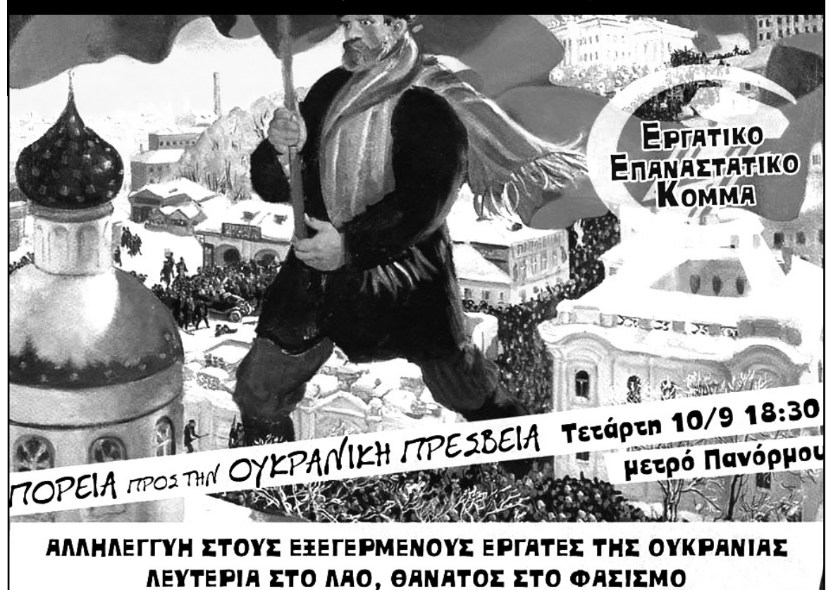
Afiche del Partido Revolucionario de los Trabajadores (EEK) de Grecia, convocada a una marcha realizada el miércoles 10 de septiembre

Solidaridad con la rebelión de los trabajadores de Ucrania. Libertad al pueblo, muerte al fascismo