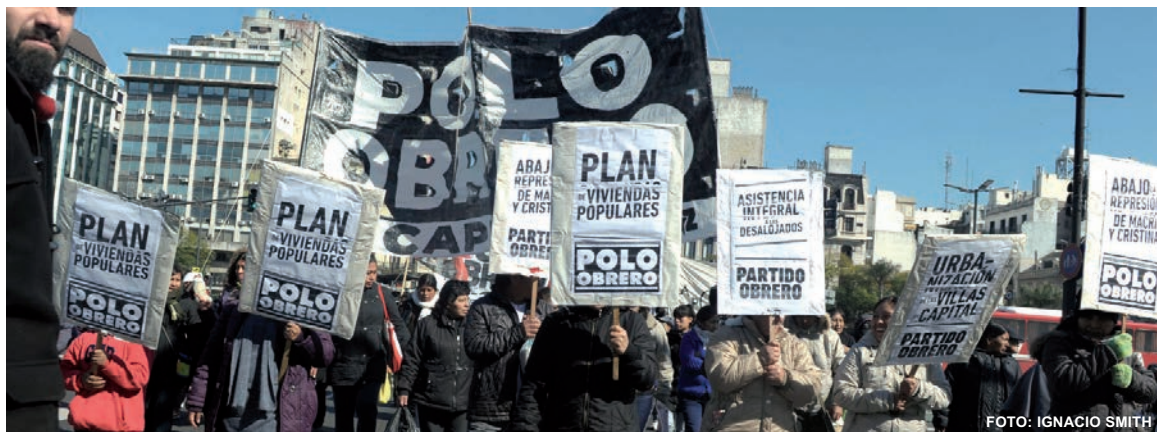
Movilización del Polo Obrero por un plan de viviendas populares. En la Legislatura, el macrismo tuvo que traer de apuro a un legislador para evitar que se apruebe en comisión el proyecto de urbanización integral del barrio "Papa Francisco" y de la Villa 20.

La reunión de la Comisión de Vivienda de este lunes concentró todas las tensiones políticas derivadas del desalojo de Lugano. Más de doscientos vecinos, de la villa 20 y de otros barrios, se hicieron presentes y expresaron su situación: la brutalidad del desalojo ejecutado por la Metropolitana y la gendarmería nacional; el maltrato y hostigamiento que reciben ahora en los paradores u hogares donde fueron alojados; la vía libre a los narcos por parte del Estado y de sus fuerzas de 'seguridad'. Fue una denuncia brutal contra los dos gobiernos. A renglón siguiente, el presidente de la comisión propuso tratar los proyectos "relacionados con la toma de Lugano". Entre ellos, varias declaraciones o "pedidos de informes". Pero no incluyó en el temario al proyecto de urbanización integral del barrio "Papa Francisco" y de la Villa 20, que nuestra banca presentó junto con otros diputados a partir de un trabajo de docentes de Arquitectura de la UBA y de los propios delegados villeros. El argumento exhibido por la mayoría de los diputados, tanto macristas como kirchneristas, es que resultaba "absurdo" votar un proyecto que aún no había sido discutido por los asesores de la comisión. Una pura dilación, porque hace semanas que fue presentado y porque el PRO no quiere ninguna urbanización, cualquiera sea el