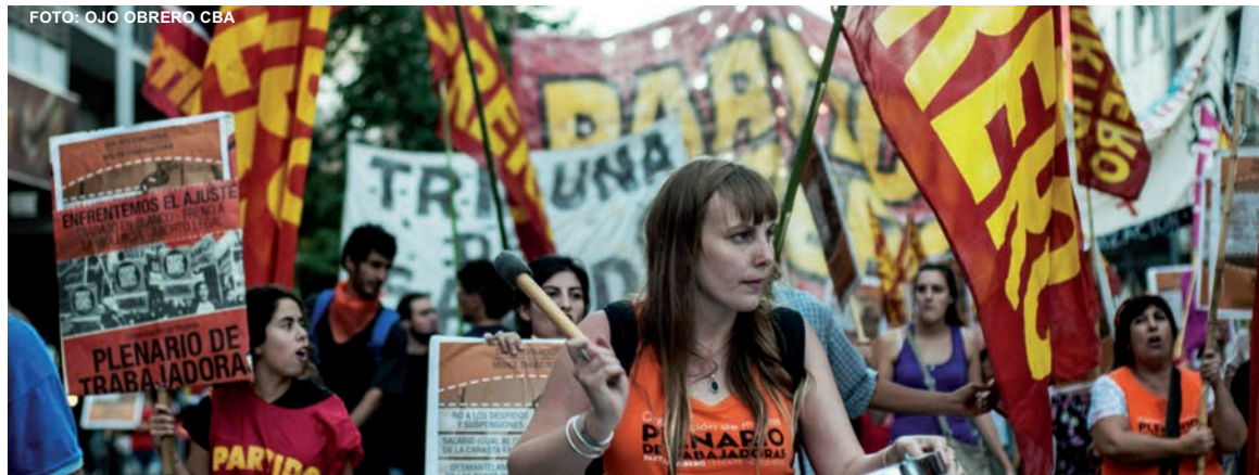
Plenario de Trabajadoras de Córdoba. En marcha por un Encuentro Nacional de Mujeres laico y anticlerical.

Con gran impulso avanza nuestra campaña por congregar un amplio contingente de compañeras de la provincia para el Encuentro Nacional.