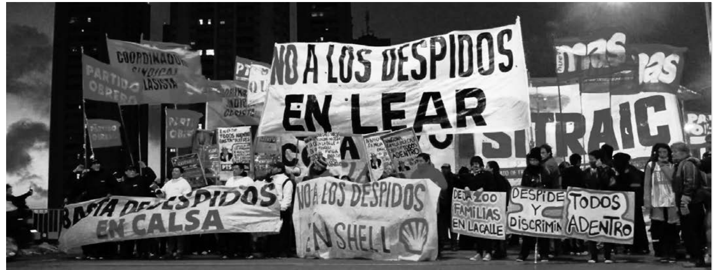
Piquete en apoyo a los trabajadores de Lear. Se diseña una situación semejante a 2001, cuando la bronca popular se conjugó con la ruptura del frente capitalista afectado por el derrumbe inminente de la convertibilidad.

Por otro lado, el plan oficial contra el 'defol' decretado por los buitres y los bancos internacionales, consiste en financiar la economía con mayor infla-