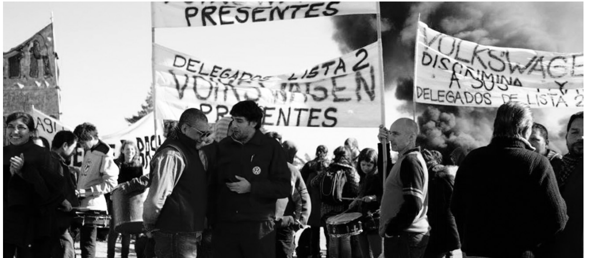
Movilización de los obreros de Volkswagen. El PJ bloquea en la legislatura provincial todas las iniciativas del Frente de Izquierda para prohibir despidos y suspensiones.

Dragún fue descalificado por su propio jefe político: De la Sota juzgó como "un golpe muy fuerte (...) quitar el 30 por ciento del ingreso a esa familia". Fue más lejos y atacó a la empresa señalando que "levantaron la plata en pala". La queja de De la Sota por la decisión de VW revela su impotencia como gobernador frente a la crisis laboral y pretende disimular la responsabilidad de su gestión en la situación. De la Sota le dio (y le sigue dando) a VW subsidios y beneficios impositivos que se pagan con fondos públicos. El fracaso de esta política (beneficios a las patronales a costa de los presupuestos públicos para promover el empleo) terminó de recibir un nuevo empujón. El gobierno de Córdoba mandó la policía a VW para permitir que la empresa violara decisiones judiciales que reinstalaban a trabajadores despedidos. Su mi-