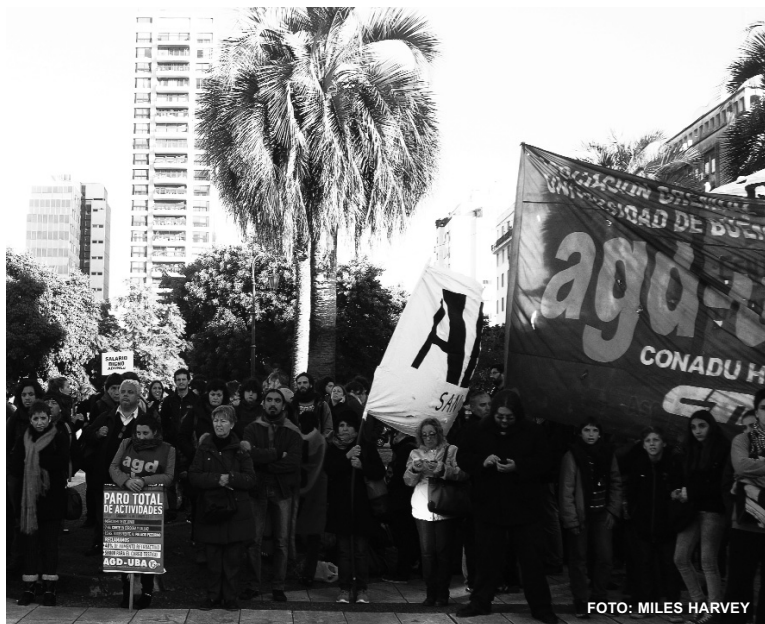
Concentración de Conadu Histórica frente al Ministerio de Educación. Los sectores combativos impusieron la continuidad de la lucha y preparar el No Inicio.

La gran huelga que se generó en Tucumán hoy sigue vigente en todo el país. Tucumán, Cuyo y San Luis continúan en paro por tiempo indeterminado; en el resto de las universidades los docentes repudian la propuesta y, con distintas medidas, se mantiene la huelga o se prepara el no inicio. En Ro-