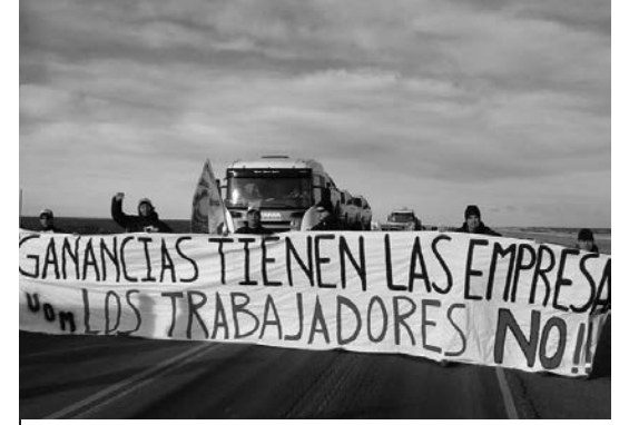
Corte de ruta de los obreros de Aluar. En Chubut, decenas de gremios reclaman contra el cobro del impuesto a las ganancias.

Decenas de delegados y activistas de distintos gremios manifes-