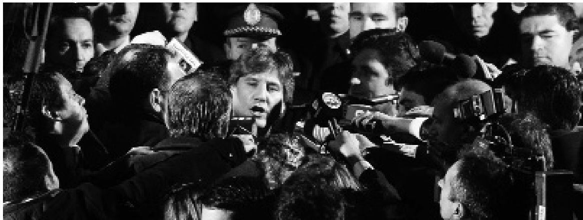
Amado Boudou. El freno del pedido de juicio político en el Congreso no detiene la andanada de cargos sobre el vicepresidente.

La tentativa de juicio político con final anunciado pone de manifiesto que la oposición aún mantiene las causas judiciales en el plano de la extorsión política. Bajo la picota de su propia corrupción, la permanencia de los K en el gobierno se encuentra condicionada a su capacidad de timonear la bancarrota económica y, sobre todo, de trasladarle la hipoteca a los trabajadores. En la lista de ese trabajo sucio, se encuentran el arreglo con los fondos buitres y el capital financiero internacional. Pero, principalmente, las condiciones que éste exige para refinanciar la quiebra nacional: por un lado, el levantamiento del cepo cambiario, una nueva devaluación de la moneda y un tarifazo en regla. Por el otro, exigen que los K hagan de la recesión un