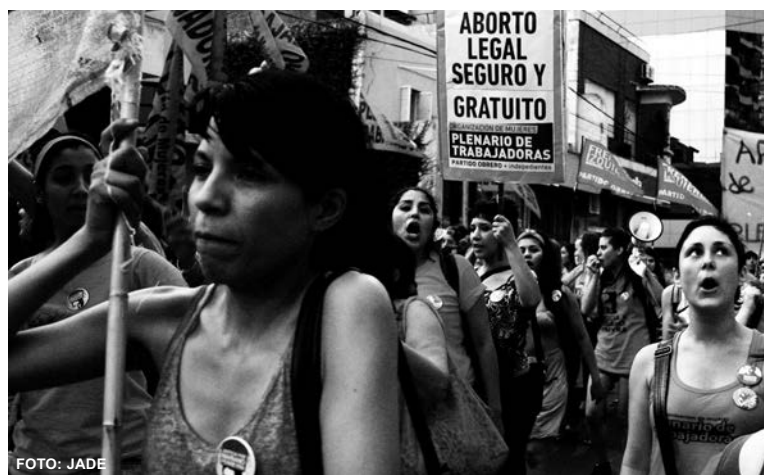
Hacia el Encuentro Nacional de Mujeres. En Salta y otros puntos del país, se conforman mesas de mujeres luchadoras que se pronuncian por un Encuentro laico y de lucha.

El movimiento de mujeres de todo el país debe tomar nota del resultado de esta batalla e intensificar una agenda de acción común. Este desafío existe, en primer lugar en Salta, donde está planteado convertir el Encuentro