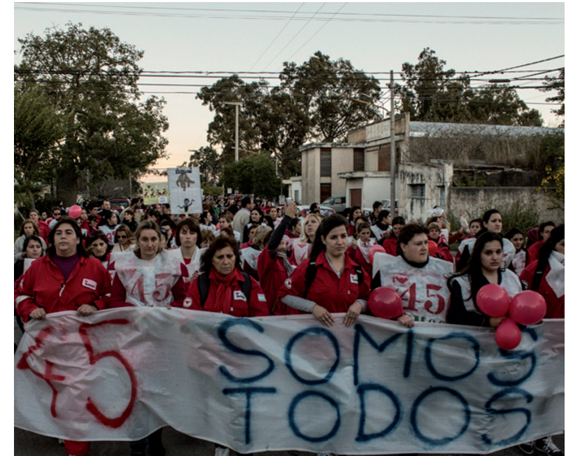
Los trabajadores cuentan con el apoyo popular del pueblo de Río Tercero. Kirchneristas y delastotistas cierran filas con la multinacional norteamericana.

Kirchneristas y delastotistas han cerrado filas tras los intereses y extorsiones de la multinacional norteamericana; sin embargo, la empresa ya ha comenzado a pagar cuantiosas multas por el incumplimiento de contratos con sus clientes, ante la incapacidad de producción y la imposibilidad de sacar lo producido del predio. Se vuelve imprescindible reforzar la lucha, sostener el bloqueo y avanzar en la unificación del conjunto de los trabajadores de la planta para imponer la reincorporación a los 61 despedidos y los 15 suspendidos. Todo nuestro apoyo a esta gran lucha de Río Tercero.