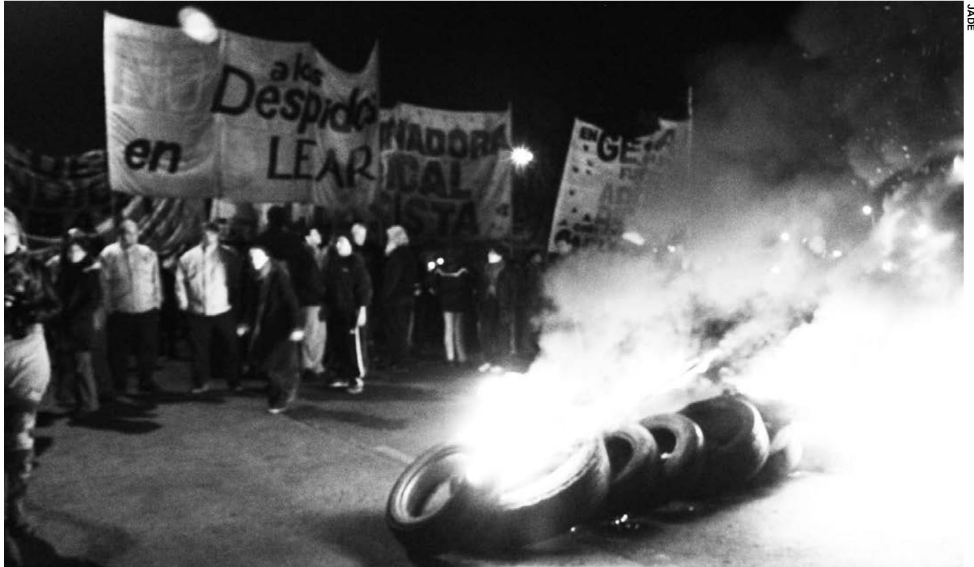
Piquete de los trabajadores de Lear. La clase obrera va emergiendo en la crisis como el único sector social que ofrece una salida en función de los intereses populares.

El paro nacional bancario reclama la reincorporación de 36 despididos en la Caja de Tucumán y nuevamente el reclamo de la abolición del impuesto al salario, al que el gobierno ha resuelto mantener sin modificación luego de las paritarias, lo que lleva, indefectiblemente, a que parte del aumento logrado sea confiscado por el Estado. Si los porcentajes de las paritarias ya están varios puntos por debajo de una inflación que se estima en el orden del 40 por ciento, el congelamiento del mínimo no imponible y de las escalas