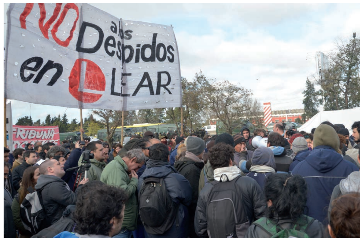
Trabajadores de Lear, en un momento crucial. Todos los recursos puestos al servicio de quebrar su pelea han fracasado.

A pesar del intento de desalojo por parte de la Justicia y la Policía bonaerense, el acampe instalado por los trabajadores de Lear alrededor de la planta sigue firme, reagrupando a los compañeros de la fábrica y recibiendo la solidaridad de miles de trabajadores. Aunque la policía desplazó el bloqueo de la puerta principal, la patronal no ha podido ingresar material ni tampoco retirar producción. Esta situación sigue siendo de mucha importancia, dado que la patronal de Lear no logra abastecer de mazos a la Ford, que al día de hoy tiene parada la producción de la camioneta Ranger y el Focus, por esta causa. El tiempo que la patronal pretendió ganar importando mazos