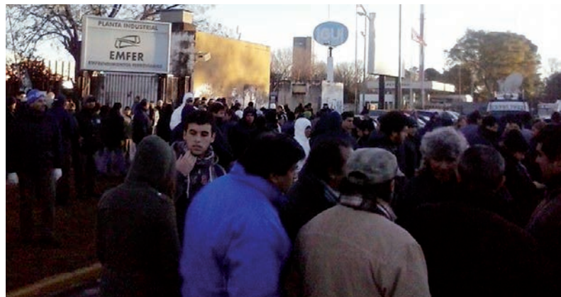
Piquete, represión y ocupación. La enorme experiencia y vitalidad de los trabajadores de Emfer y Tatsa muestra un nuevo escenario para el conjunto de la clase obrera.

Estas empresas pertenecen al grupo Cirigliano, uno de los grupos económicos "nacionales y populares", que se convirtió en tal, a partir del sostenimiento kirchnerista del régimen de privatizaciones montado por el menemismo. Los Cirigliano tomaron posesión de la empresa en el año 94, en el cuadro