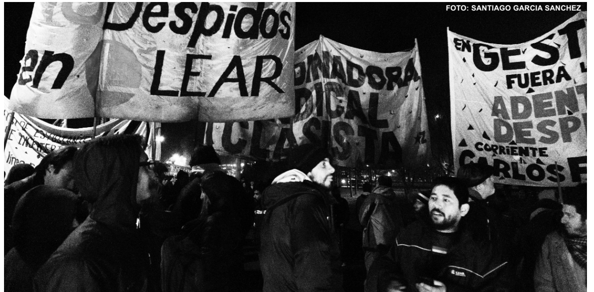
Ola de despidos y suspensiones en las autopartistas. Plan de lucha y ocupación de toda empresa que cierre o despida.