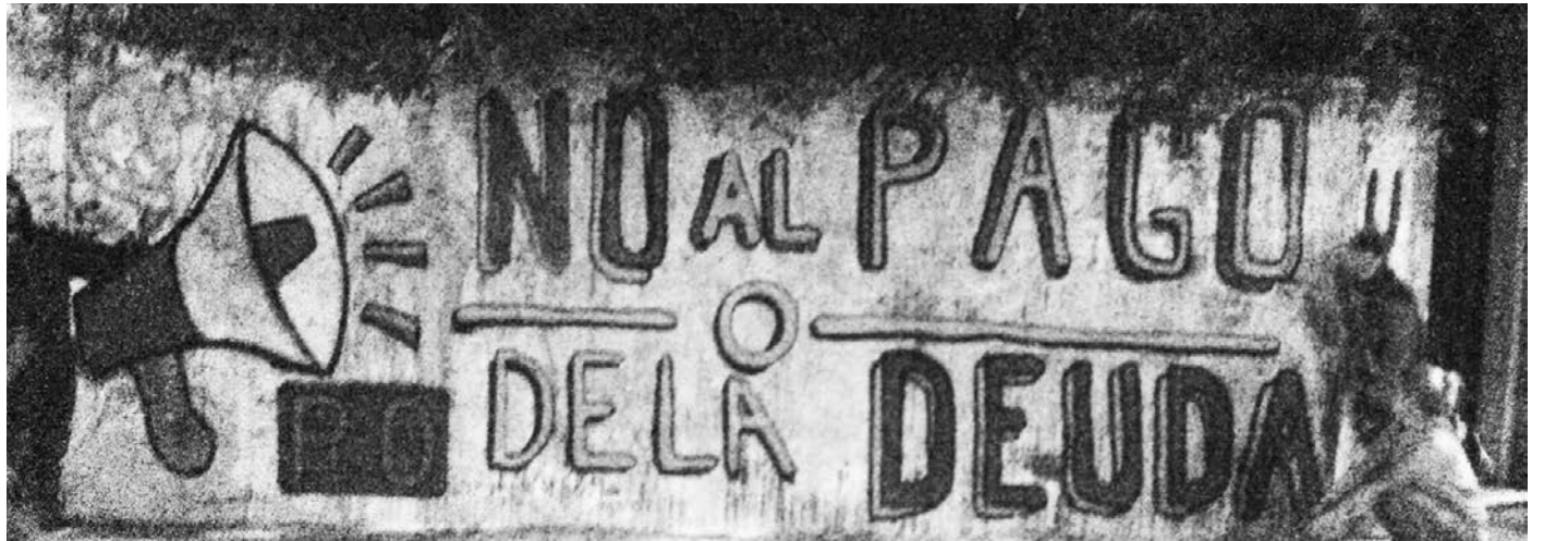
Pintada del Partido Obrero repudiando la deuda usuraria. Tiene que decidir el pueblo.

A la vista de este resultado, el Financial Times califica de "extorsión" la orden de pagar al mismo tiempo a los buitres y a los acreedores regulares, y descalifica el criterio de 'pari passu' (igual trato) aplicado por la Justicia norteamericana. En resumen, Argentina se encuentra en un laberinto: si no cumple con el fallo entra en defol, y si lo hace se arriesga a una serie de procesos judiciales que la arrastrarían al defol. Defensor del capital financiero internacional, el Financial Times recomienda arreglar con los 'buitres' y afrontar el riesgo de juicios ruinosos. El planteo de que el pago a los buitres, en el caso de una orden judicial, sería inocuo, no es más que una triquiñuela mediática que pondría a la Argentina en un estado de vulnerabi-