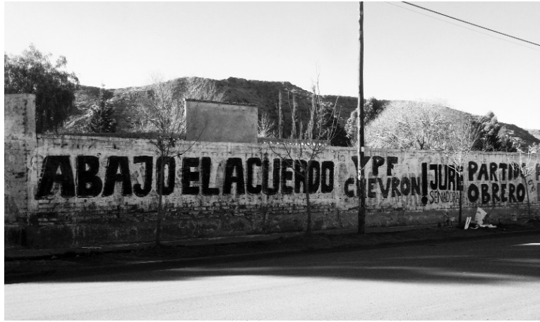
Campaña contra el saqueo de los hidrocarburos.

Aquí están delineados los puntos centrales de un programa que vienen fogueando la clase capitalista y la oposición patronal, el cual plantea el levantamiento del cepo cambiario y poner fin, de un modo general, a las regulaciones presentes en la política económica oficial. Esto es, precisamente, sobre lo que ponen énfasis las provincias. Los gobernadores, encabezados por Jorge Sapag, Martín Buzzi y Paco Pérez, han elaborado una contrapropuesta al proyecto K nacional, en la que apuntan a defender su tajada en el negocio pero, como contrapartida, terminan yendo incluso más lejos que el gobierno nacional. Junto a la necesidad de extender las concesiones a 35 años, plantean un régimen de promoción, exenciones y beneficios fiscales similares a los que cuenta la actividad minera y el establecimiento de otro régimen cambiario que permita la libre disponibilidad de las divisas y la autorización de girar utilidades al exterior.