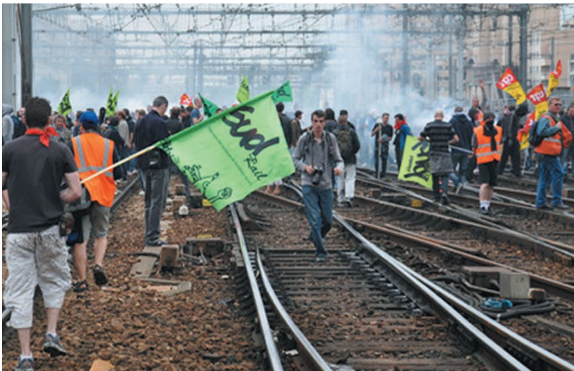
Piquete de obreros ferroviarios. Una huelga política de masas contra el gobierno socialista y su política.

La huelga ferroviaria terminó definitivamente el 24 de junio, luego de más de diez días de duración. La reivindicación central de la huelga fue la oposición a la ley de reforma, que precisamente se aprobó ese día en la Asamblea Nacional, con cambios cosméticos en relación al proyecto original del gobierno.