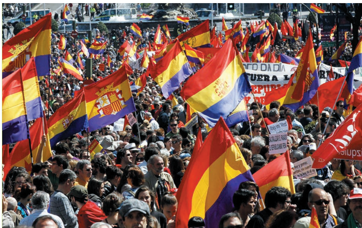
La reivindicación de la república traduce la aspiración a una salida popular a la crisis capitalista.

En este cuadro, ¿cuáles son las alternativas? Felipe pretenderá fingir que su función es reinar pero no gobernar, pero no hay que olvidar que es el jefe de las fuerzas armadas y por lo tanto de todo el aparato de represión. Recurrirá a la burguesía europea para aplacar los afanes independentistas de Cataluña, pero esta reivindicación ha penetrado fuerte en la pequeña burguesía y en una parte de los trabajadores, detrás del espejismo de que la separación sería la salida