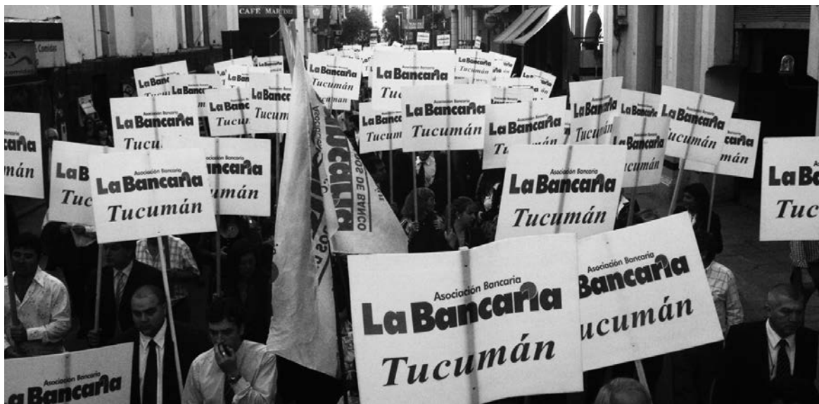
Diez mil bancarios de todo el país se movilizaron en Tucumán, el jueves 22, en apoyo a la lucha de la Caja Popular.

La movilización por la represión del 13 de mayo se transformó en un plan de lucha de todo el gremio. Paros progresivos y crisis política.