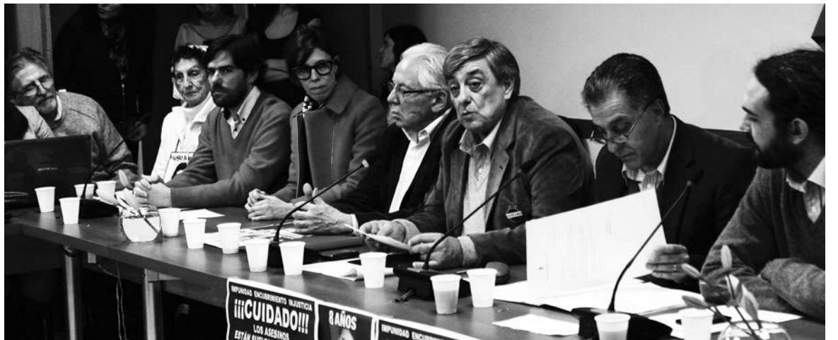
La audiencia contó con la asistencia de importantes luchadores contra la impunidad.