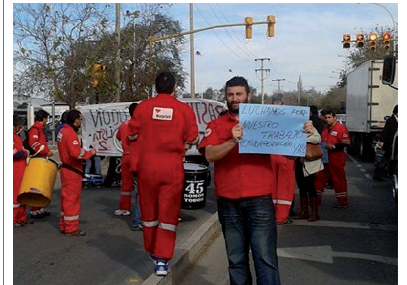
CÓRDOBA - CRISIS DE LA INDUSTRIA METALMECÁNICA