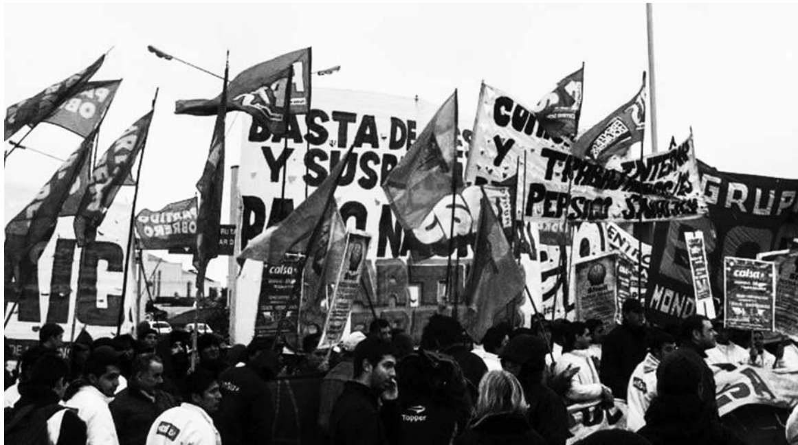
Los trabajadores de Casla, y una pelea que ya lleva 45 días.

La lucha por la reincorporación de más de 60 trabajadores de Calsa ya supera los 45 días. Los trabajadores siguen acampando en la puerta de la fábrica y el paro de la producción es total.