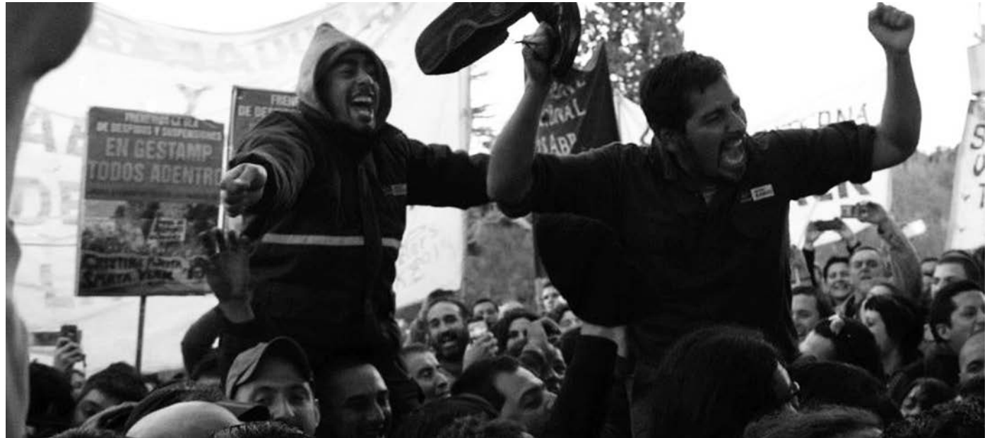
El gobierno y las patronales van a pagar caro el desalojo de Gestamp, que lograron con mentiras y estafas.

luego de todos estos arreglos entre-guistas, si luego los "inversores" no pueden ejercer "el derecho de propiedad", disponiendo de la fuerza de trabajo de acuerdo con su conveniencia? ¡La promesa de "crear trabajo" en el futuro empieza por la destrucción de la fuerza de trabajo en el presente! El ingreso de los despedidos, que establecía la conciliación luego derogada, afectaba el "clima de inversiones" que promueven los nacionales y populares. Tolerar un triunfo obrero habría convertido en inútiles todas las agachadas ante el gran capital. Cuando el 'labu-