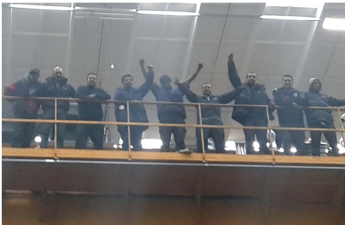
Obremos de Gestamp en la toma de la planta. El discurso presidencial contra la toma del Palacio de Invierno descubre el enorme desprecio 'nacional y popular' por los esfuerzos gigantescos que han realizado las masas populares para conquistar una dignidad humana.